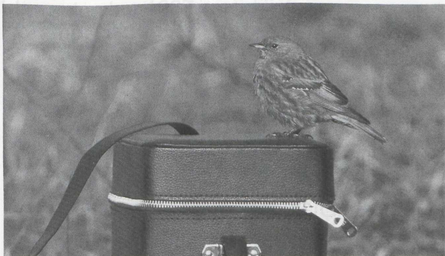
102 Alpenheggemus Prunella collaris , Groningen, Groningen, April 1986