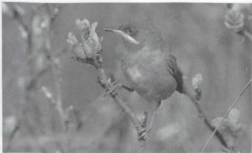
92 Subalpine Warbler Sylvia cantillans , male, Schoorl, Noordholland, May 1986

* Forster's Tern Sterna forsteri 0,1 ZEELAND Ritthem, 1-2 November, adult, photographed (A H Ovaa et al ; van Dongen et al 1987a, Ovaa 1987)