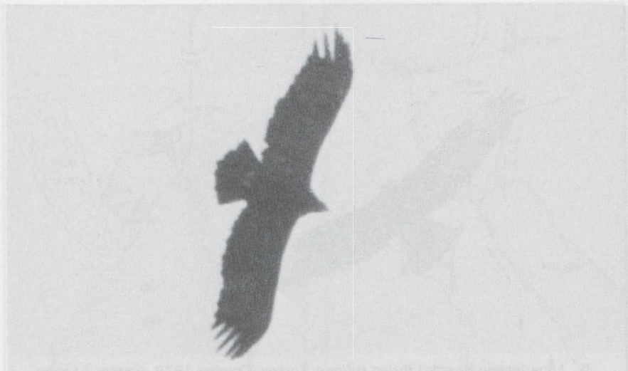
6 Spotted Eagle Aquila clanga , Iran, October 1978.

Spotted or Steppe Eagles. Plumage characters were often not seen but quite often it was possible to distinguish between Lesser Spotted and Steppe by silhouettes alone. This was easiest when they were soaring on straight held wings, Steppe showing its characteristic long slender wings with obvious 'square' wing-tip and short inner primaries giving a distinct S-curve to the trailing edge. When gliding, with carpal joint held forwards and primaries backwards, identification by silhouette usually was more difficult but the wing-tip of Steppe is more pointed and reaches further back than in Lesser Spotted.