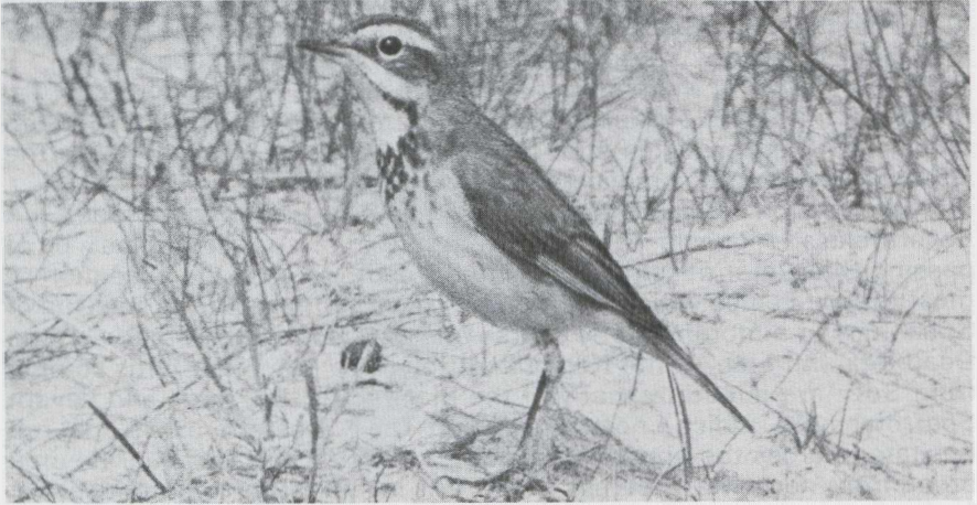
7 Bluethroat Luscinia svecica , female in first-winter plumage, Maasvlakte, Zuidholland, May 1984.