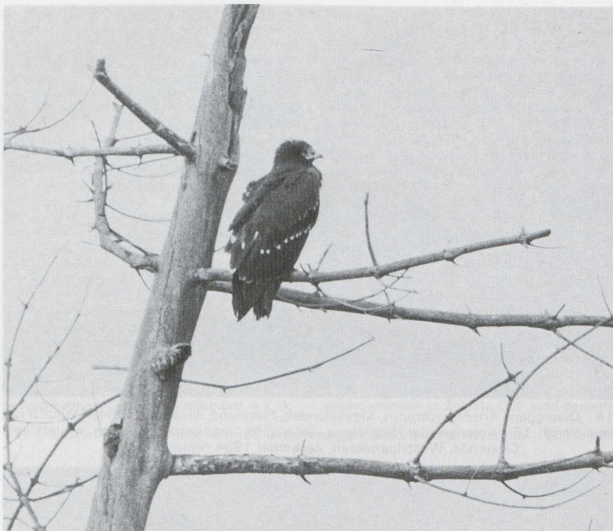
16 Schreeuwarend Aquila pomarina in juveniel kleed, Katwijk aan Zee, Zuidholland, november 1984.

ber zou een vrouwtje zijn gezien in de Braakmanpolder Z. Witoogenden A nyroca pleisterden onder andere op het Alkmaardermeer Nh van 21 tot eind oktober, te Halfweg van 30 oktober tot 6 november, te Minderhout A vanaf 15 november, te Lelystad Fl op 13 december en te Duffel A van 28 december tot 2 januari. Verrassend was de ontdekking van een mannetje Koningseider Somateria spectabilis in eerste winterkleed die vanaf 13 december te Oostende Wvl verbleef. Dit was het eerste geval voor België en het vierde voor de Benelux. Op 11 november vloog een Zeearend Haliaeetus albicilla over de Maasvlakte en op 29 en 30 december werd er een waargenomen in de Kievitslanden. Een juveniele Steppekiekendief Circus macrourus verbleef op 3 en 4 oktober op de