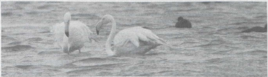
12 Flamingo's Phoenicopterus ruber roseus , Oostvoornse Meer, Zuidholland, januari 1985 (Arnoud B van den Berg).

Voorkomen van Flamingo in Nederland Naar aanleiding van een waarneming van drie adulte Flamingo's Phoenicopterus ruber roseus in januari 1985 in en bij het Oostvoornse