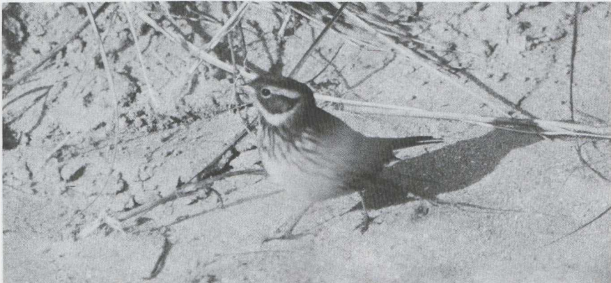
21 Dwerggors Emberiza pusilla , IJmuiden, Noordholland, oktober 1984 (René van Rossum).

geval voor Nederland en de Benelux. Te Westkapelle werd op 1 oktober een Sperwergrasmus S nisoria waargenomen. Een Pallas' Boszanger Phylloscopus proregulus werd op 1 november gevangen op het Vogelringstation Castricum in het Noordhollands Duinreservaat Nh. Tussen eind september en begin november werden 15+ Bladkoninkjes P inornatus gemeld, de meeste langs de kust maar ook enkele in het binnenland zoals in Amsterdam Nh (3-5 en 9 oktober), op het Muiderzand (3-4 oktober) en te Voorthuizen Gld (19 oktober). Vanaf 8 november zat er een in Het Zwin; op 27 november werden er zelfs twee waargenomen. Een Bruine Boszanger P fusca-tus verbleef van 1 tot 3 november te Heist. Op precies dezelfde plaats werd van 29 oktober tot 6 november 1982 ook de vorige Belgische Bruine Boszanger waargenomen! Dit was het derde geval voor België en het vierde voor de Benelux. De waarneming van een Fitis Ptrochilus (waarschijnlijk een oostelijke) op 2 november te Heist was laat. Van de Kleine Vliegenvanger Ficedula parva werden in september en oktober 10+ exemplaren gemeld. Hierbij trokken de gevallen op het Muiderzand (4 oktober) en te Schiedam-Kethel Zh (20 september) de aandacht. Er werden Buidelmezen Remiz pendulinus waargenomen op de Vijfhoek bij Diemen Nh op 27 september, te Antwer-