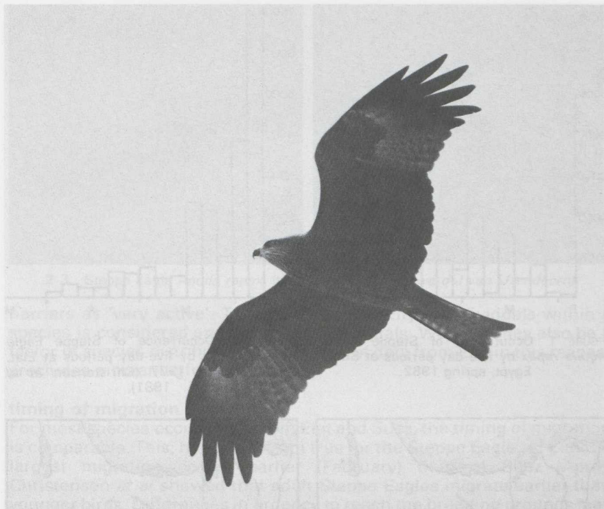
1 Black Kite Milvus migrans , Israel, April 1984.

reluctance of broad-winged raptors to cross even small stretches of water. Thus, these species tend to avoid crossing the mouth of the Gulf of Suez, a crossing made without hesitation by, for instance, Honey Buzzard. It is possible to divide migrating raptors into several categories according to how 'active' or 'passive' they are in migratory behaviour (Bruun & Schelde 1957, Wimpfheimer et al ).