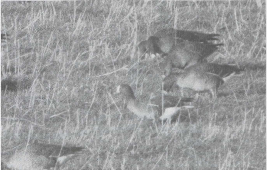
14 Dwerggans Anser erythropus , Kievitslanden, Flevoland, december 1984. 15 Koningseider Somateria spectabilis , mannetje in eerste winterkleed, Oostende, Westvlaanderen, december 1984.