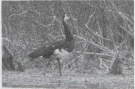
8-9 Spur-winged Goose Plectropterus gambensis , Morocco, June 1984.

GENERAL APPEARANCE & STRUCTURE Large, strongly built goose-like bird with broad wings and long legs and neck. Bare skin on forehead.