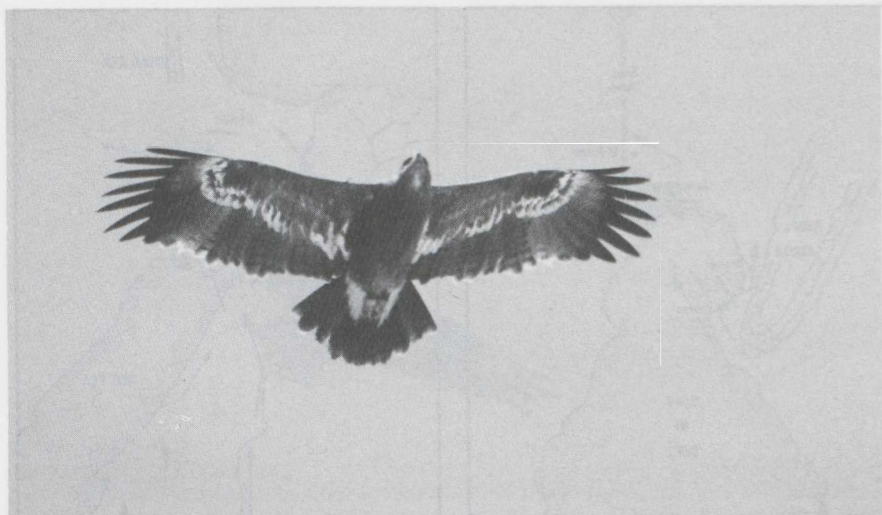
4 Steppe Eagle Aquila rapax , Israel, April 1984 (Edward J van IJzendoorn).