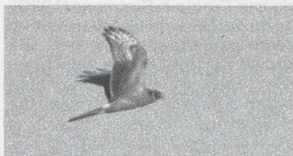
10 Steppekiekendief Circus macrourus . Bergen op Zoom, Noordbrabant, oktober 1984 (Edward J van IJzendoorn).

De kiekendief werd op 4 oktober door een 20-tal vogelaars gezien. Hij hield zich op in een vrij klein en overzichtelijk gebied, ongeveer een kilometer lang en 500 m breed, dat bestond uit verwaarloosd bouwland met aardhopen en riet. De vogel was veel en langdurig zichtbaar, meestal vliegend maar ook zittend op de grond. Verschillende malen vloog hij op minder dan 100 m voorbij en soms kon hij in de zit van deze afstand met de telescoop worden bekeken. De Steppekiekendief at enkele malen van een dode Houtduif Columba palumbus . Het stond niet vast dat hij deze zelf had geslagen. Wel werd gezien dat hij een Spreeuw Sturnus vulgaris sloeg. Op beide dagen was het zonnig. Op 3 oktober stond er een zwakke zuidoosten wind en op 4 oktober nam deze in de loop van de dag toe tot krachtig. Op die dag werd de Steppekiekendief na 13:00 niet meer gezien. Vermoedelijk was hij weggetrokken; er was vrij veel trek en er passeerden verscheidene andere roofvogels.