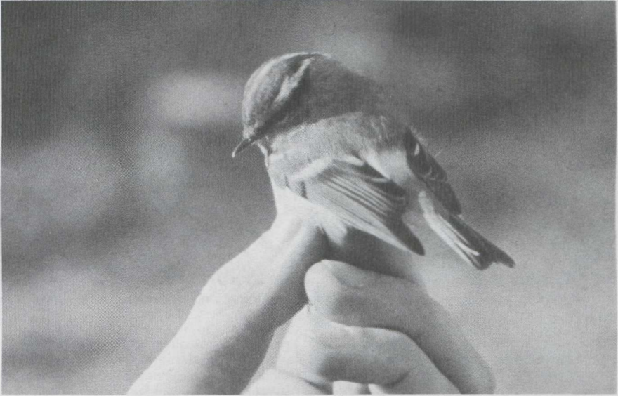
19 Pallas' Boszanger Phylloscopus proregulus , Castricum, Noordholland, november 1984. 20 Bruine Boszanger P fuscatus , Heist, Westvlaanderen, november 1984.