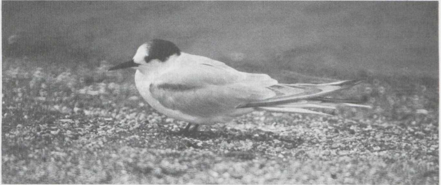
110 Visdief Sterna hirundo in eerste wisselkleed (= eerste zomerkleed), Harlingen, Friesland, juni 1982 (Joop Jukema).

van een vogel in definitief wisselkleed, bij de andere drie was de staart kort. De vogels konden van de Noordse Stern S paradisaea worden onderscheiden door de aanwezigheid van verschillende generaties handpennen.