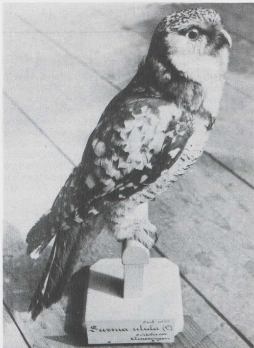
21 Sperweruil Surnia ulula , Rijksmuseum van Natuurlijke Historie, Leiden, Zuidholland, april 1983 (Arnoud B van den Berg). Verzameld op 5 oktober 1920 te Amerongen, Utrecht.

maart een Sperweruil bij het vliegveld Münster-Osnabrück te Greven, Westfalen, op c 50 km van Enschede O. In België en Nederland werden tijdens de invasie geen Sperweruilen gemeld. De oorzaak van deze invasie was waarschijnlijk voedselschaarste. Rond Helsinki, Finland, vond ook van Oeraluil Strix uralensis en Laplanduil S nebulosa een invasie plaats (Lasse Laine in litt ).