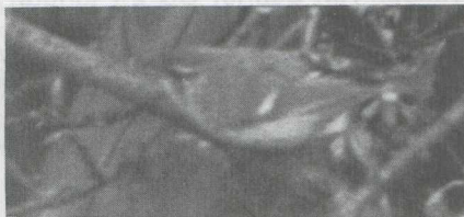
16 Bladkoninkje Phylloscopus inornatus , Hoogeveen, Drenthe, maart 1975 (E Bernardus).

VERENKLEED Vaalgroene kruinstreep; donkergroene laterale kruinstreep; dunne donkere oogstreep; vuilwitte wenkbrauwstreep, vooral duidelijk achter het oog; wangen donker gevlekt; keel wit. Nek donkergroen; mantel en rug vaalgroen. Borst, buik en flanken vuilwit. Tertiairs met duidelijke vuilwitte randen; een brede vleugelstreep gevormd door vuilwitte randen op de toppen van de grote vleugeldekveren. Staartpenen donker met laterale vuilwitte randen.