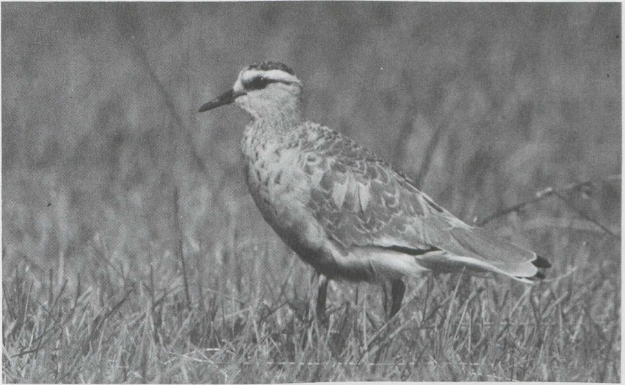
55. Steppekievit Chettusia gregaria , Schiermonnikoog (Fr), augustus 1982 (René Pop)

Grote Zilverreiger x Blauwe Reiger geobserveerd. Zwarte Ooievaars Ciconia nigra waren schaars: zij werden gemeld te Kalmthout (A) op 16 augustus, in oostelijk Groningen op 4 september (twee) en in het Lauwersmeer (Fr/Gr) op 5 september.