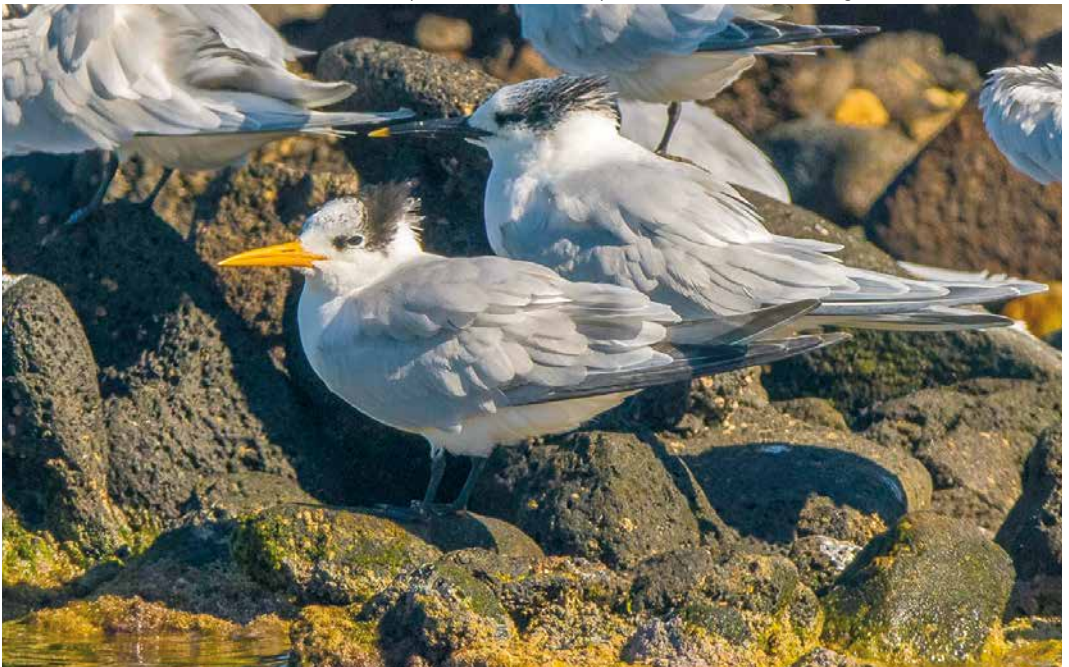
152 Lesser Crested Tern / Bengaalse Stern Sterna bengalensis , with Sandwich Terns / Grote Sterns S sandvicensis , Arrecife, Lanzarote, Canary Islands, 12 February 2019 (David Pérez Rodríguez)