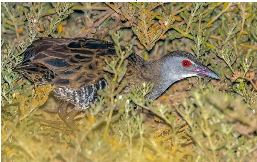
132 African Crane / Afrikaanse Kwartelkoning Crex egregia , Santa Maria, Sal, Cape Verde Islands, 9 March 2019 (Vincent Legrand)