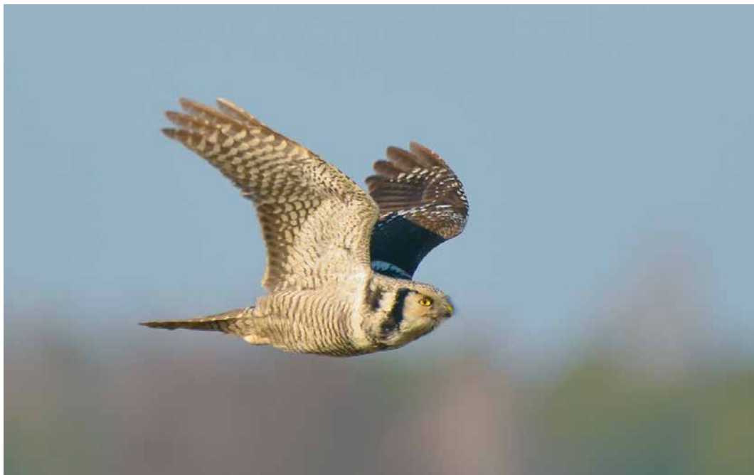
131 Northern Hawk-Owl / Sperweruil Surnia ulula , Bachury, Podlasie, Poland, 10 February 2019 (Młosz Cousens)