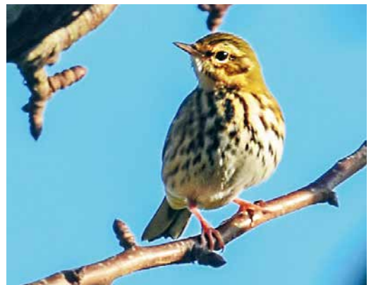
100 Pallas' Boszanger / Pallas's Leaf Warbler Phylloscopus proregulus , Hondsbossche Zeewering, Noord-Holland, 5 november 2018 101 Bruine Boszanger / Dusky Warbler Phylloscopus fuscatus , Amsterdam-Buitenveldert, Noord-Holland, 24 december 2018 102 Humes Bladkoning / Hume's Leaf Warbler Phylloscopus humei , Sint-Oedenrode, Noord-Brabant, 21 november 2018 103 Witsluitbarmsijs / Coues's Redpoll Acanthis hornemanni exilipes , adult mannetje, Meijndel, Wassenaar, Zuid-Holland, 9 november 2018 104 Mogelijke Oostelijke Gele Kwikstaart / possible Eastern Yellow Wagtail Motacilla tschutschensis , eerste-winter, Rhooon, Zuid-Holland, 2 december 2018 105 Siberische Boompieper / Olive-backed Pipit Anthus hodgsoni , Noordwijk, Zuid-Holland, 8 november 2018