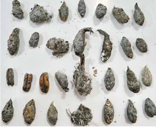
37 Pellets of Sooty Falcon / Woestijnvalk Falco concolor , Wadi el Gemal island, Egypt, 29 November 2017 (Mohamed I Habib). Note date palm seeds.

Seven pellets found at 'nest 1' on Wadi El Gemal in October 2017 ranged in size between 20 mm and 27 mm in length and between 11 mm and 12.5 mm in width. The 24 pellets found at 'nest 2' on the same island in October 2017 ranged in size between 17 mm and 31 mm in length and between 8.5 mm and 12 mm in width. Pellets of nest 1 only contained passerine remains (bone and feather fragments), while those of nest 2 also some insect material (12.5%), besides passerine remains (87.5%). For an extensive list of prey items in the Arabian peninsula, see Jennings (2010).