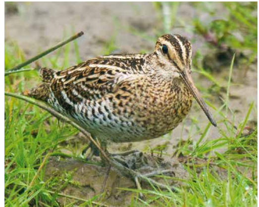
5 Amerikaanse Oeverloper / Spotted Sandpiper Actitis macularius , Medemblik, Noord-Holland, 17 april 2015 (Co van der Wardt) 6 Grijsje Junco / Dark-eyed Junco Junco hyemalis , tweede-kalenderjaar vrouwtje, Beijum, Groningen, Groningen, 19 februari 2015 (Arnoud B van den Berg) 7 Woestijngasmus / Asian Desert Warbler Sylvia nana , Terschelling, Friesland, 14 november 2015 (Jaap Denee) 8 Poelsnip / Great Snipe Gallinago media , Broekhuizen, Limburg, 28 april 2015 (Arnoud B van den Berg)

uit te gaan. Wel trok na acht jaar zonder Siberische Strandloper C acuminata de door Pierre van der Wielen ontdekte vogel in de Putten van Camperduin, Noord-Holland, tussen 6 en 19 september veel aandacht (achtste geval van in totaal negen vogels) en was een Ruigpootuil Aegolius funereus die zich tegen een Amsterdams schoolraam doodvlog op 12 oktober opmerkelijk als 's lands meest westelijke ooit. Curieus was dat een Vorkstaartplevier G pratincola op 18-23 oktober juist Terneuzen, Zeeland, uitkoos omdat de vorige twee gevallen in het late najaar uit precies dezelfde gemeente stamden. Een Mongoolse Pieper A godlewskii , de eerste twitchbare sinds 2007, liet zich op 31 oktober en 1 november bij tijd en wijle goed zien bij Ridderkerk, Zuid-Holland. De vogel was op de