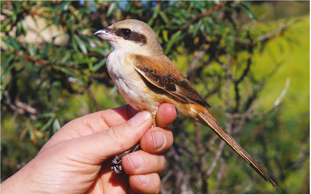
564 Long-tailed Shrike / Langstaartklauwier Lanius schach , first-year, Het Zwin, Knokke, West-Vlaanderen, Belgium, 15 October 2017