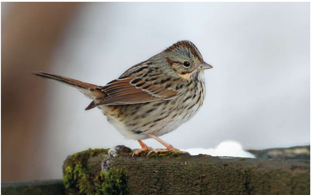
61 Lincoln's Sparrow / Lincolns Gors Melospiza lincolnii , Hafnarfjörður, Iceland, 9 December 2013