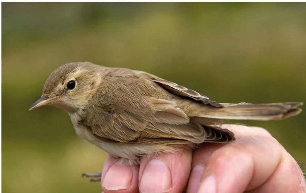
514 Booted Warbler / Kleine Spotvogel Iduna caligata , Bloemendaal, Noord-Holland, 28 August 2013 (Arnoud B van den Berg/Vrs van Lennep)