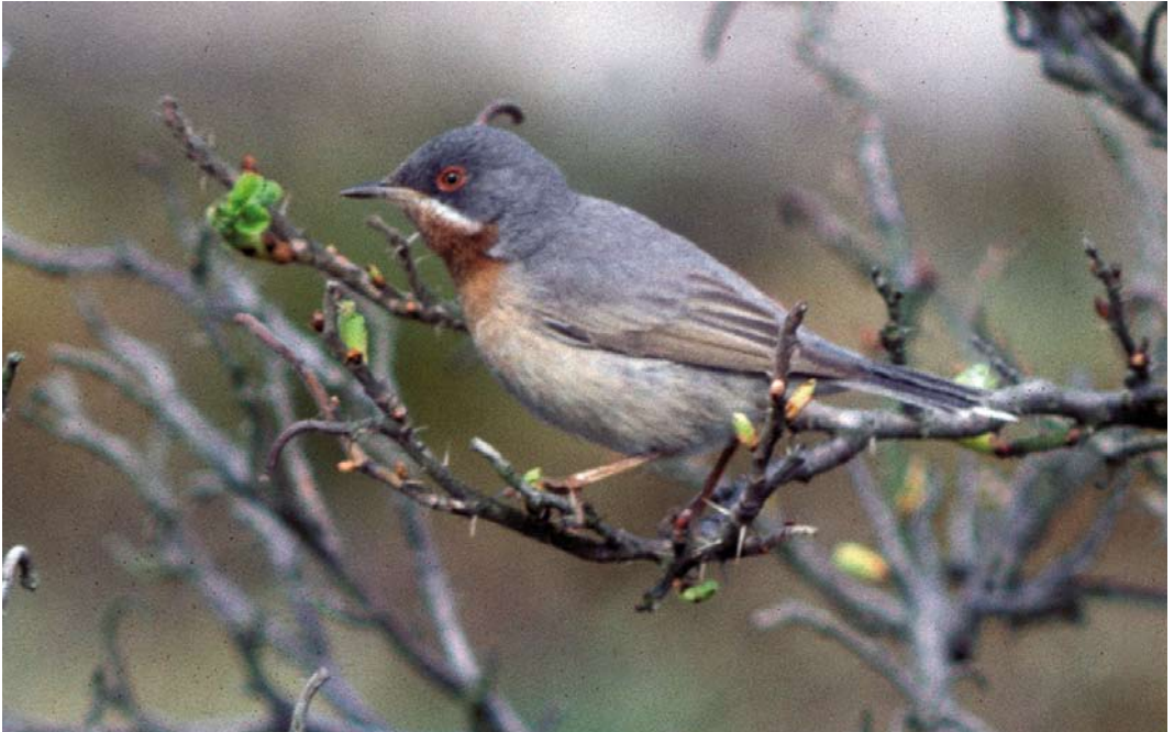
523 Balkanbaardgrasmus / Eastern Subalpine Warbler Sylvia cantillans , tweede-kalenderjaar mannetje, Groet, Noord-Holland, 7 mei 1986 ( Arnoud B van den Berg )