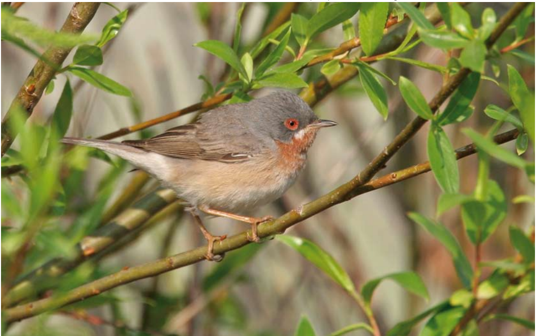
524 Balkanbaardgrasmus / Eastern Subalpine Warbler Sylvia cantillans , tweede-kalenderjaar mannetje, Maasvlakte, Zuid-Holland, 11 mei 2006