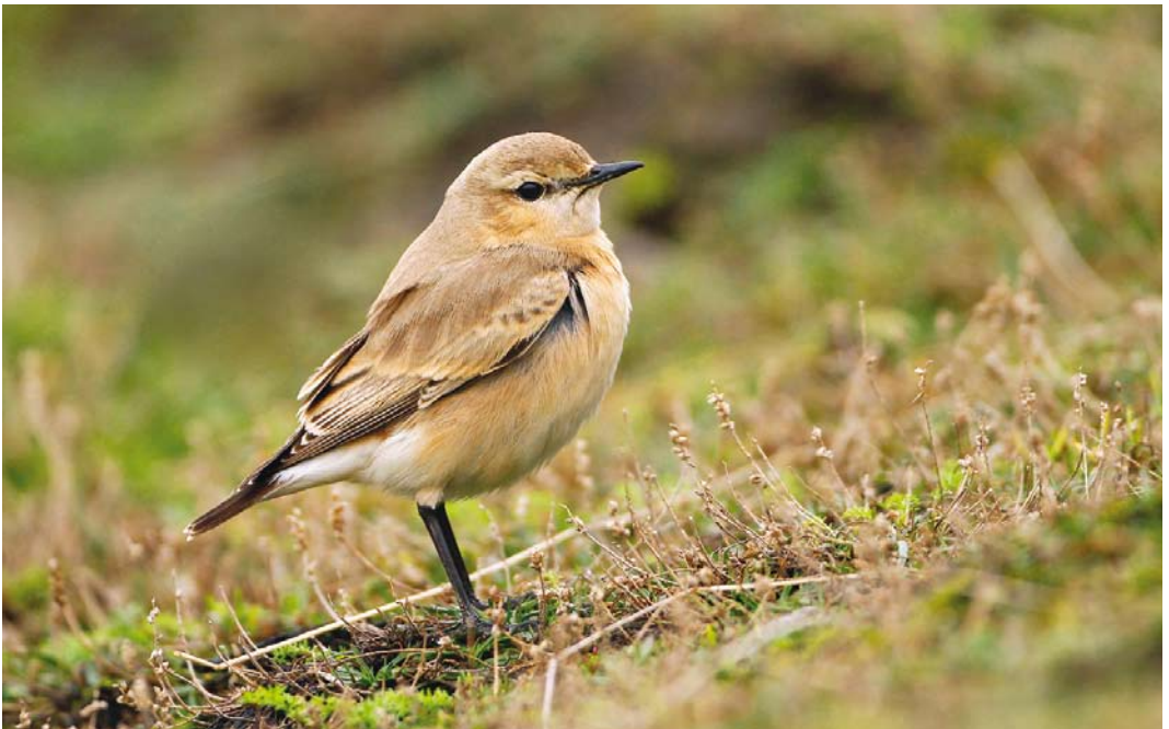
520 Isabelline Wheatear / Izabeltapuit Oenanthe isabellina , first-winter, Maasvlakte, Zuid-Holland, 1 November 2013 (Martin van der Schalk)