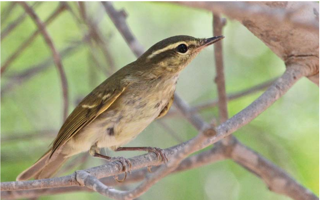
546 Presumed Large-billed Leaf Warbler / vermoedelijke Diksnavelfitis Phylloscopus magnirostris , Al Mamzar Park, Dubai, United Arab Emirates, 11 October 2014 ( Simon Lloyd )