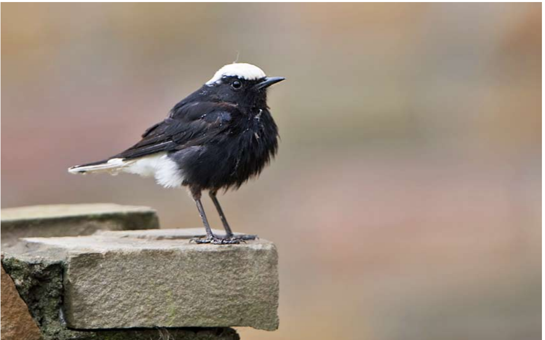
574 Witkruintapuit / White-crowned Wheatear Oenanthe leucopyga , adult, Oegstgeest, Zuid-Holland, 9 oktober 2014