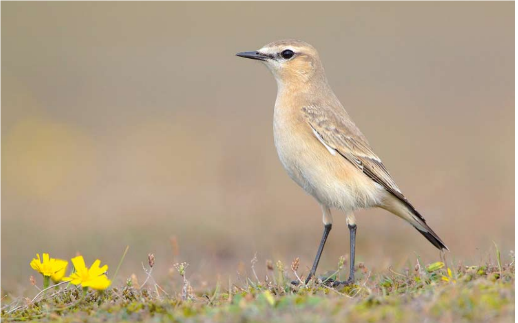
573 Izabeltapuit / Isabelline Wheatear Oenanthe isabellina , eerstejaars, Maasvlakte, Zuid-Holland, 5 oktober 2014