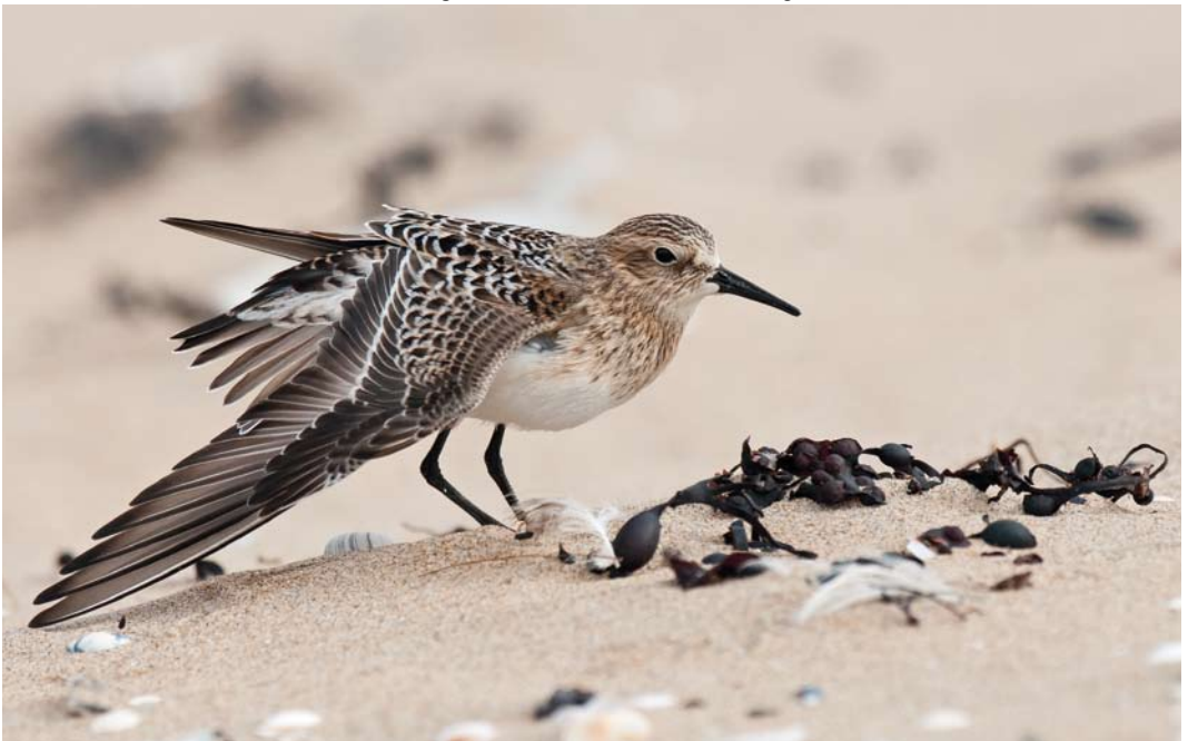
461 Baird's Sandpiper / Bairds Strandloper Calidris bairdii , juvenile, Noordzeestrand, Wassenaar, Zuid-Holland, 29 August 2012