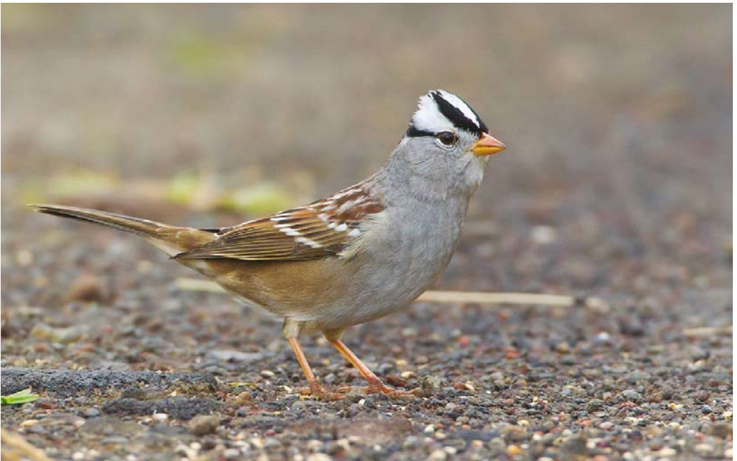
515 Gambel's White-crowned Sparrow / Gambels Witkruingors Zonotrichia leucophrys gambelii , adult, Corvo, Azores, 22 October 2013