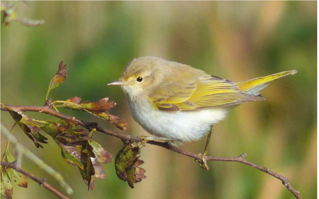
538 Bergfluitier / bonelli's warbler Phylloscopus bonelli/orientalis , eerstejaars, De Cocksdorp, Texel, Noord-Holland, 12 oktober 2013