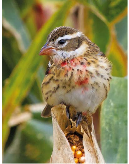
511 Black-and-white Warbler / Bonte Zanger Mniotilta varia , first-year male, Corvo, Azores, 10 October 2013 ( Mika Bruun ) 512 Rose-breasted Grosbeak / Roodborstkardinaal Pheucticus ludovicianus , first-year male, Corvo, Azores, 11 October 2013 ( Kris De Rouck ) 513 Northern Parula / Brilparulazanger Setophaga americana , male, Corvo, Azores, 11 October 2013 ( Kris De Rouck )