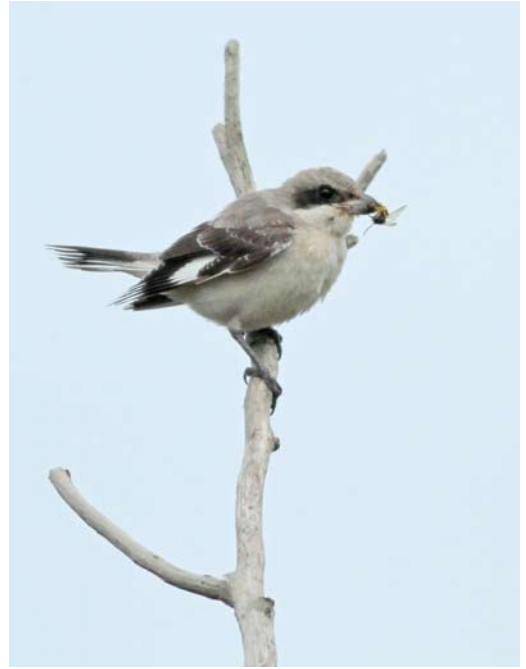
533 Kleine Klapekster / Lesser Grey Shrike Lanius minor , eerstejaars, De Muy, Texel, Noord-Holland, 24 oktober 2013 ( Jos van den Berg ) 534 Kleine Klapekster / Lesser Grey Shrike Lanius minor , eerstejaars, Callantsoog, Noord-Holland, 16 oktober 2013 ( Fred Visscher ) 535 Dwerggors / Little Bunting Emberiza pusilla , Ouderkerk aan de IJssel, Zuid-Holland, 3 oktober 2013 ( Gijsbert Mourik )