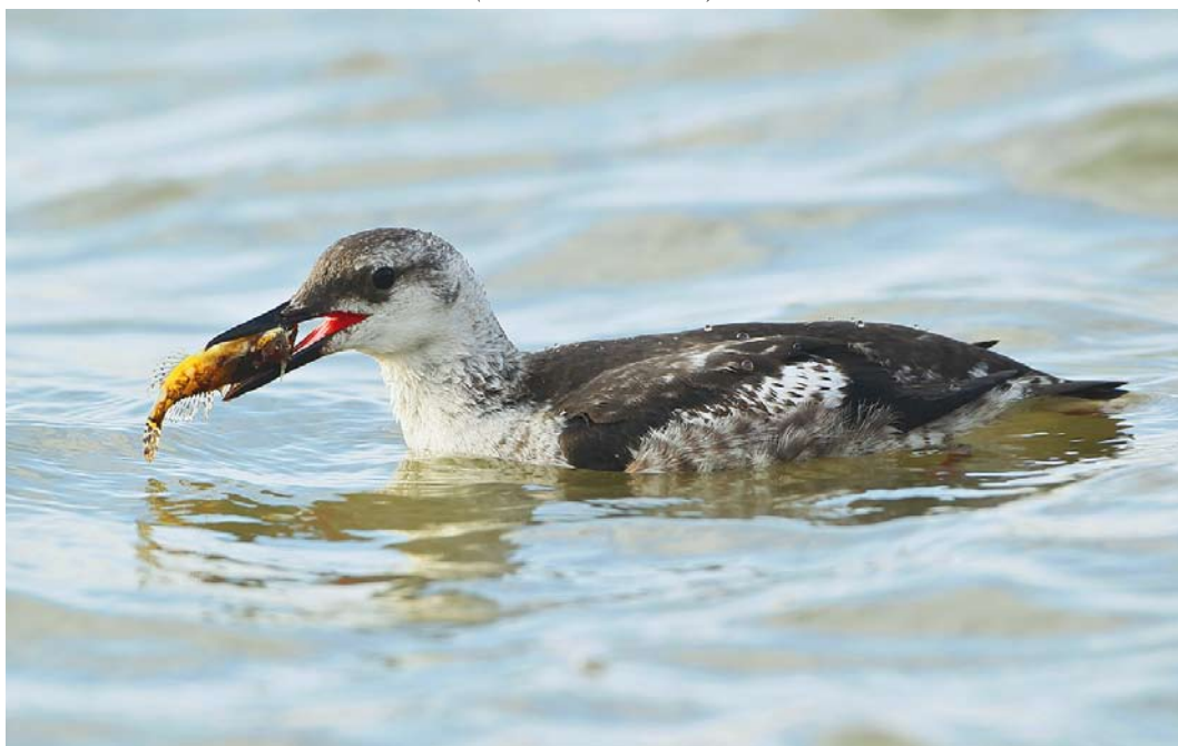
524 Zwarte Zeekoet / Black Guillemot Cephus grylle , eerstejaars, IJmuiden, Noord-Holland, 18 oktober 2013