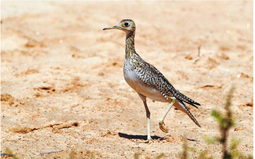
481 Upland Sandpiper / Bartrams Ruyter Bartramia longicauda , first-year, near Dakhla, Oued ed Dahab, Western Sahara, Morocco, 11 October 2013