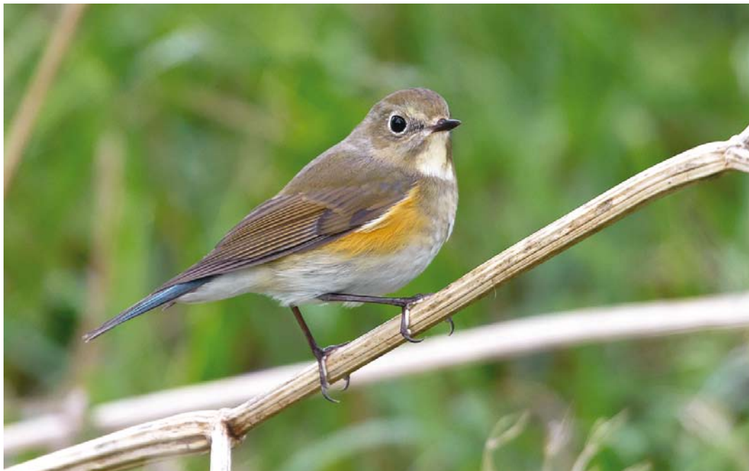
544 Blauwstaart / Red-flanked Bluetail Tarsiger cyanurus , eerstejaars, De Cocksdorp, Texel, Noord-Holland, 15 oktober 2013