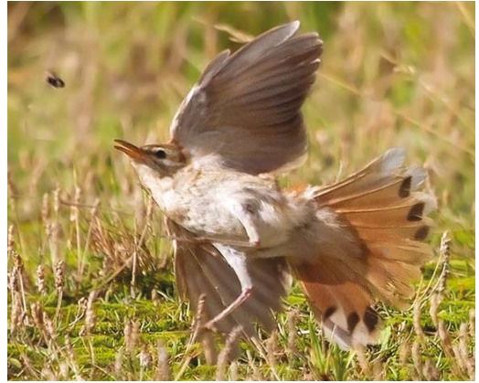
478 Westelijke Rosse Waaiersstaart / Western Rufous-tailed Scrub Robin Cercotrichas galactotes galactotes , Camperduin, Noord-Holland, 27 september 2013 (Mattias Hofstede).

schrijving en de vele foto's blijkt dat het een Westelijke Rosse Waaiersstaart C g galactotes betrof. Het staartpatroon is hierbij doorslaggevend: bij Oostelijke Rosse Waaiersstaart C g familiaris/syriacus is de hoeveelheid zwart tussen het grijsbruin en de witte toppen breder, zit er meestal ook zwart op de buitenste staartpen en zijn de middelste pennen donkerder (Svensson 1992, Svensson et al 2000; plaat 478). Daarnaast heeft Oostelijke (vooral familiaris ) koudere (meer grijsbruine) bovendelen, die meer contrasteren met de staart dan bij Westelijke (die warmer oranjebruine bovenzijde en staart heeft). Verder heeft Oostelijke vaak een meer uitgesproken koppatroon met onder meer een duidelijkere snorstreek en is de bovenzijde bij Oostelijke contrastrijker dan bij Westelijke, onder meer door opvallend donkere centra van grote dekveren (Svensson et al 2000).