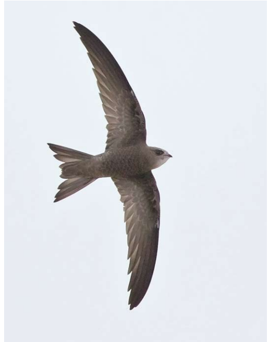
551 Vale Gierzwaluw / Pallid Swift Apus pallidus , Vlieland, Friesland, 25 oktober 2013 ( Jaap Denee ) 552 Vale Gierzwaluw / Pallid Swift Apus pallidus , Vlieland, Friesland, 25 oktober 2013 ( Toy Janssen ) 553 Vale Gierzwaluw / Pallid Swift Apus pallidus , Enkhuizen, Noord-Holland, 26 oktober 2013 ( Michel Veldt ) 554 Vale Gierzwaluw / Pallid Swift Apus pallidus , Neeltje Jans, Zeeland, 2 november 2013 ( Toy Janssen )