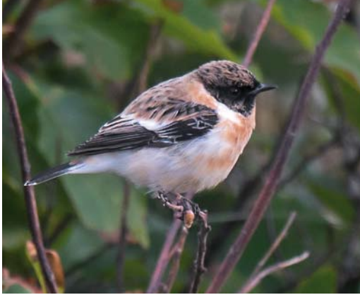
471 Caspian Stonechat / Kaspische Roodborstapuit Saxicola maurus hemprichii , adult male, Kooisplek, Vlieland, Friesland, 6 October 2012