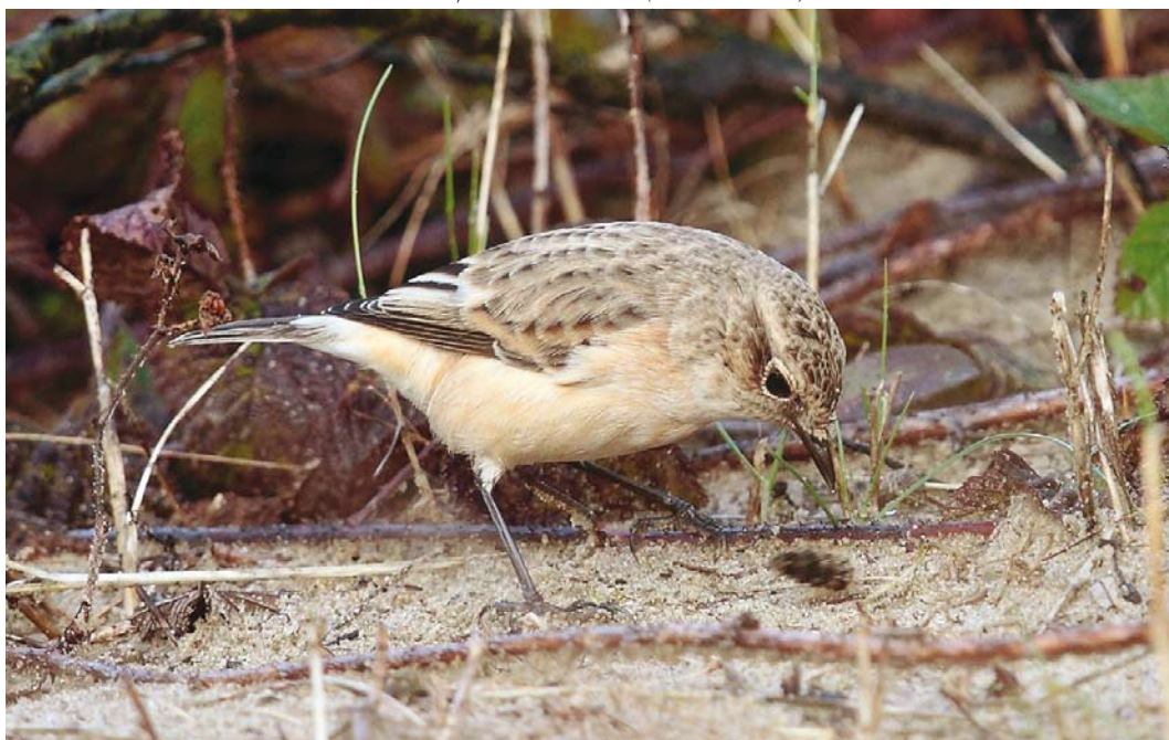
532 Aziatische Roodborstapuit / Siberian Stonechat Saxicola maurus , eerstejaars, Robbenjager, Texel, Noord-Holland, 10 oktober 2013 (Eric Menkveld)