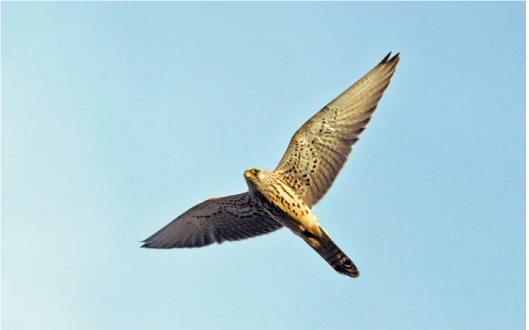
483 Lesser Kestrel / Kleine Torenvalk Falco naumanni , Oostduinkerke, West-Vlaanderen, Belgium, 26 October 2013 484 Rüppell's Vulture / Rüppells Gier Gyps rueppellii , adult, Los Barrios, Cádiz, Spain, 28 October 2013 485 Sandhill Crane / Canadese Kraanvogel Grus canadensis , adult, Hermannshof, Bartelshagen, Mecklenburg-Vorpommern, Germany, 27 September 2013