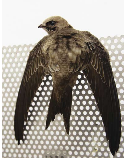
556 Vale Gierzwaluw / Pallid Swift Apus pallidus (verzwakt gevonden te Groot-IJsselmonde, Rotterdam, Zuid-Holland, op 3 november 2013), Vogelklas Karel Schot, Rotterdam, Zuid-Holland, 4 november 2013