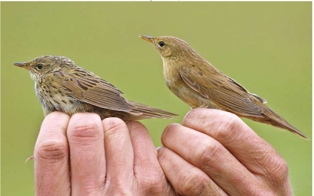
539 Kleine Sprinkhaanzanger / Lanceolated Warbler Locustella lanceolata , eerstejaars (links), met Sprinkhaanzanger / Common Grasshopper Warbler L naevia , eerstejaars, Ooijse Graaf, Ooijpolder, Gelderland, 5 oktober 2013