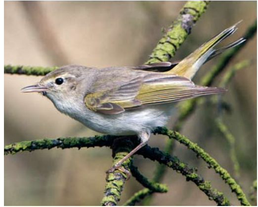
467 Western Bonelli's Warbler / Bergfluitier Phylloscopus bonelli , male, Veluwezoom, Gelderland, 12 June 2012 ( Phil Koken )

2009 31 October, Nollledijk, Vlissingen , Zeeland (T Lui-