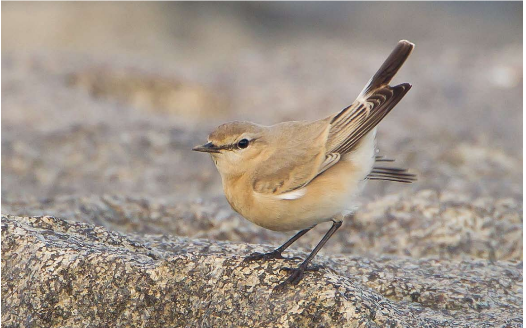
546 Izabeltapuit / Isabelline Wheatear Oenanthe isabellina , eerstejaars, Maasvlakte, Zuid-Holland, 26 oktober 2013 ( Hans Brinks )