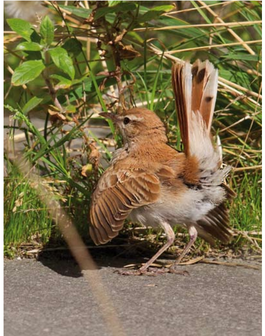
474 Westelijke Rosse Waaierstaart / Western Rufous-tailed Scrub Robin Cercotrichas galactotes galactotes , Camperduin, Noord-Holland, 27 september 2013 475 Westelijke Rosse Waaierstaart / Western Rufous-tailed Scrub Robin Cercotrichas galactotes galactotes , Camperduin, Noord-Holland, 27 september 2013 476 Westelijke Rosse Waaierstaart / Western Rufous-tailed Scrub Robin Cercotrichas galactotes galactotes , Camperduin, Noord-Holland, 27 september 2013