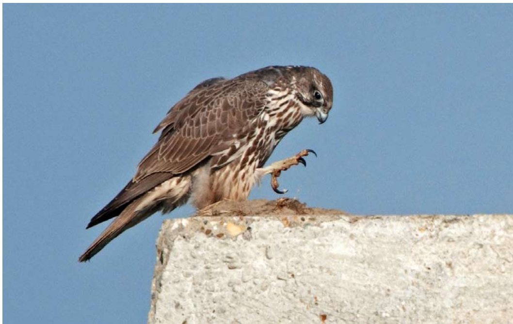
458 Gyr Falcon / Giervalk Falco rusticolus , second calendar-year, Westdorpe, Zeeland, 11 February 2012