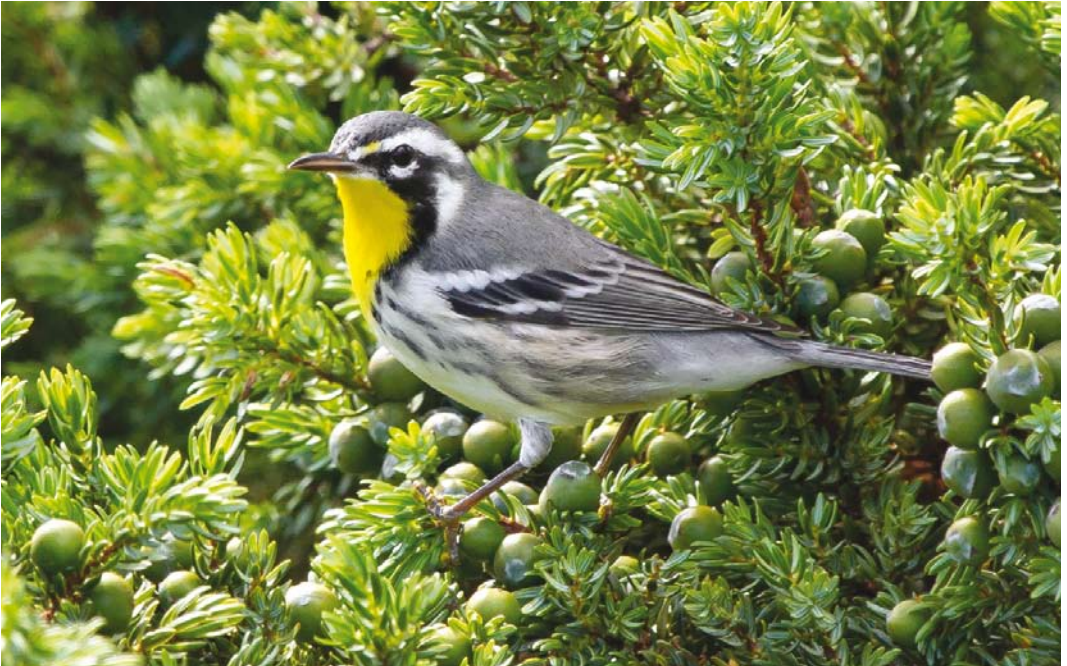
509 Yellow-throated Warbler / Geelkeelzanger Setophaga dominica , Corvo, Azores, 17 October 2013