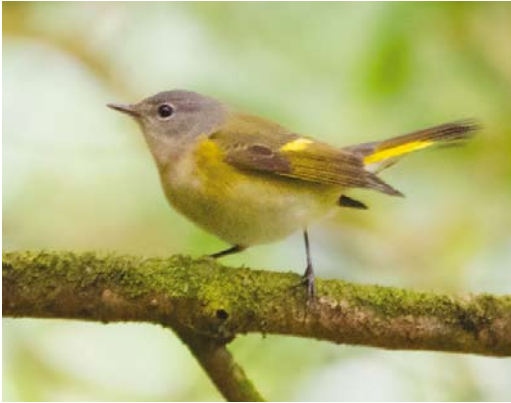
520 American Redstart / Amerikaanse Roodstaart Setophaga ruticilla , first-year male, Corvo, Azores, 8 October 2013

Grebe stayed at Lagoa Azul, São Miguel, through early November; a Mourning Dove occurred on Flores on 16-19 October; a Yellow-billed Cuckoo C. americanus was found on Santa Maria on 18 November; a Sora was found on Santa Maria on 19 October; a first-winter American Coot Fulica americana was present (again) at Lagoa Azul, São Miguel, from 6 November; a juvenile Yellow-crowned Night Heron Nyctanassa violacea turned up on Santa Maria on 6 November; a Great Blue Heron Ardea herodias and an American Great Egret Casmerodius albus egretta were on Pico in late October;