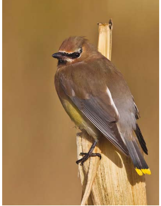
506 American Cliff Swallow / Amerikaanse Klifzwaluw Petrochelidon pyrrhonota , first-year, Corvo, Azores, 6 October 2013 507 Cedar Waxwing / Cederpestvogel Bombycilla cedrorum , first-year, Corvo, Azores, 12 October 2013 508 Mourning Dove / Treurduif Zenaida macroura , first-year, Corvo, Azores, 16 October 2013