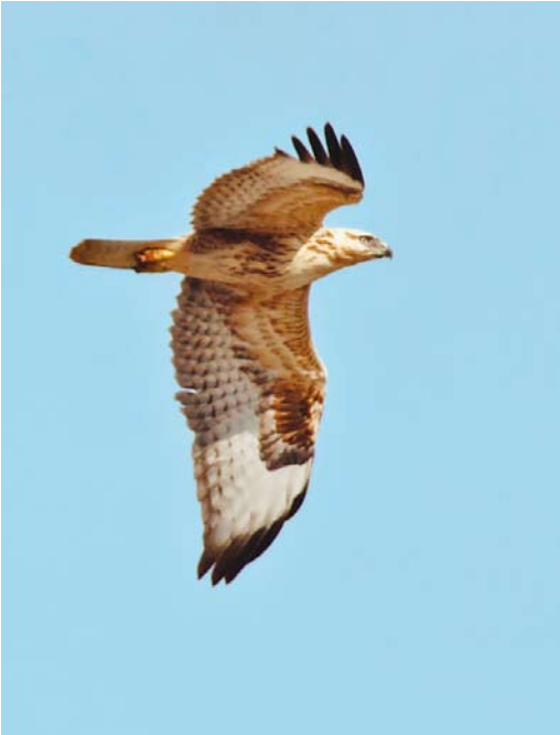
521 Arendbuizerd / Long-legged Buzzard Buteo rufinus , juveniel, Tweede Maasvlakte, Zuid-Holland, 2 oktober 2013 (Garry Bakker)