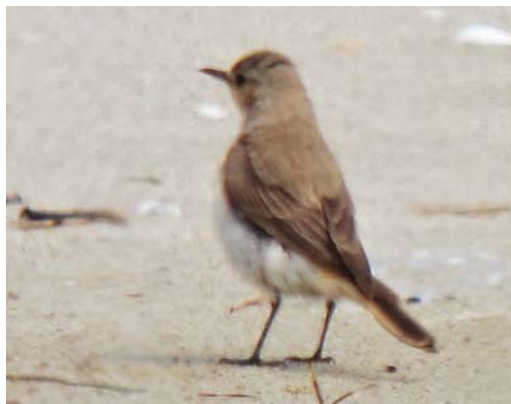
479-480 Hooded Wheatear / Monnikstapuit Oenanthe monacha , female, Keramoti, Nestos delta, Greece, 20 May 2012

Kobialka to take better photographs of the bird. Although they had just one hour left before departure to the airport, HBK and HK drove to the place beside the military camp and crawled to the site under full coverage of a dune. They were lucky to relocate the bird at c 15:00 and HK was able to take a series of digiscoped photographs, unnoticed by the military.