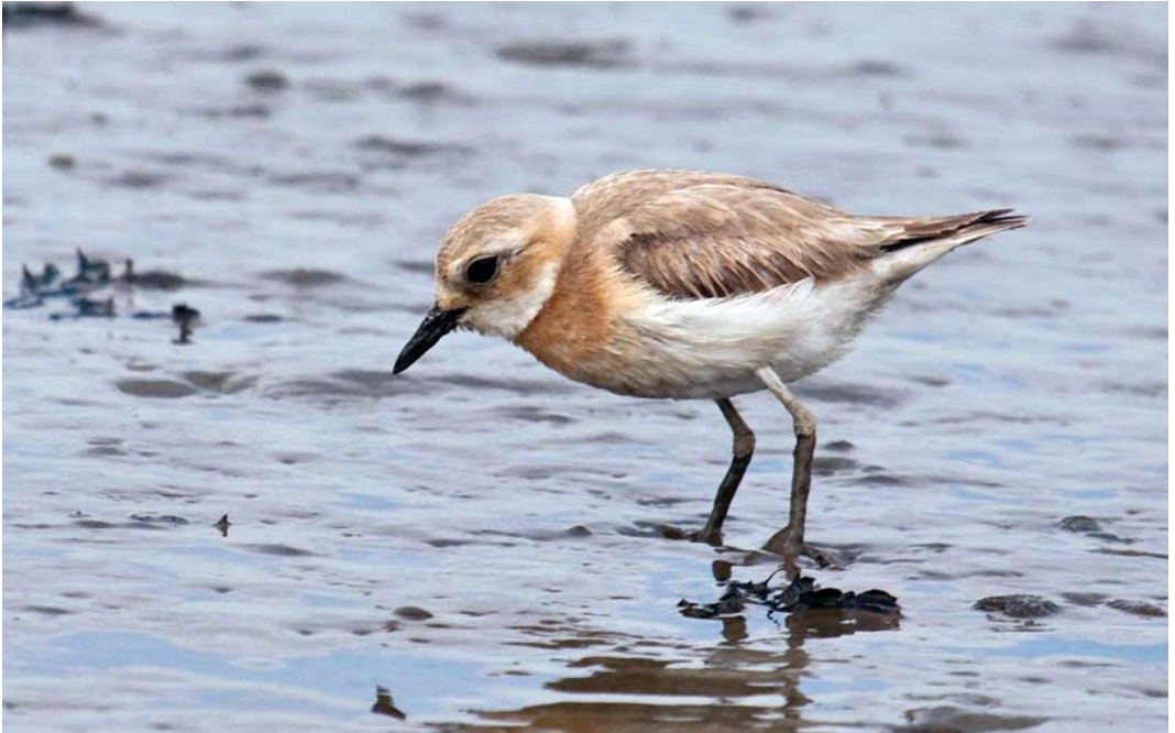
460 Greater Sand Plover / Woestijnplevier Charadrius leschenaultii , second calendar-year, Punt van Reide, Groningen, 14 May 2012