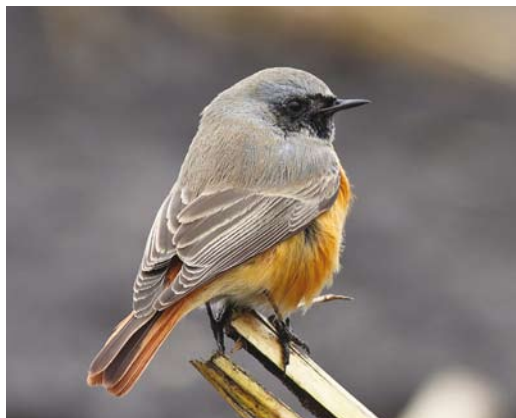
469 Eastern Black Redstart / Oosterse Zwarte Roodstaart Phoenicurus ochruros phoenicuroides , first calendar-year male, Rolde, Drenthe, 12 November 2012 (Cock Reijnders)