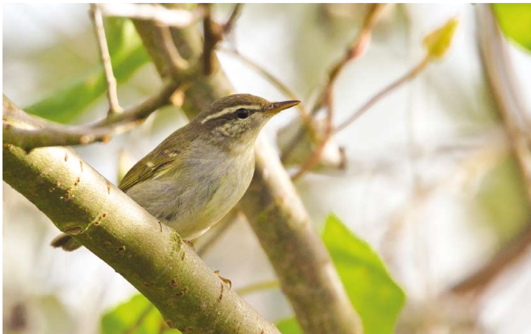
536 Noordse Boszanger / Arctic Warbler Phylloscopus borealis , Westplaat, Maasvlakte, Zuid-Holland, 26 september 2013