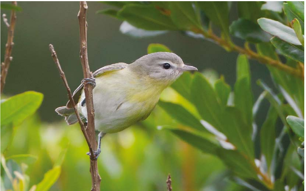
510 Philadelphia Vireo / Philadelphiavireo Vireo philadelphicus , Corvo, Azores, 14 October 2013