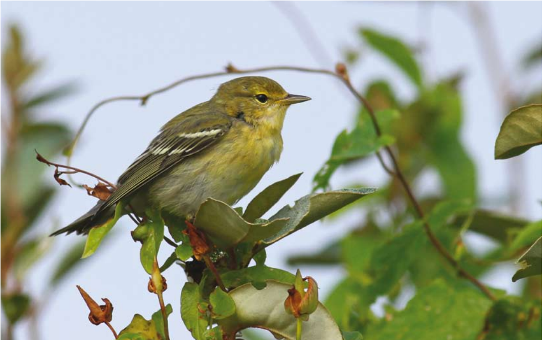
501 Blackpoll Warbler / Zwartkopzanger Setophaga striata , Inishbofin, Galway, Ireland, 25 September 2013 (Richard Bonser) 502 Eastern Kingbird / Koningstiran Tyrannus tyrannus , Inishbofin, Galway, Ireland, 24 September 2013 (Anthony McGeehan) 503 Ruby-crowned Kinglet / Roodkroonhaan Regulus calendula , first-year female, Cape Clear, Cork, Ireland, 27 October 2013 (Kerry Gorentz)