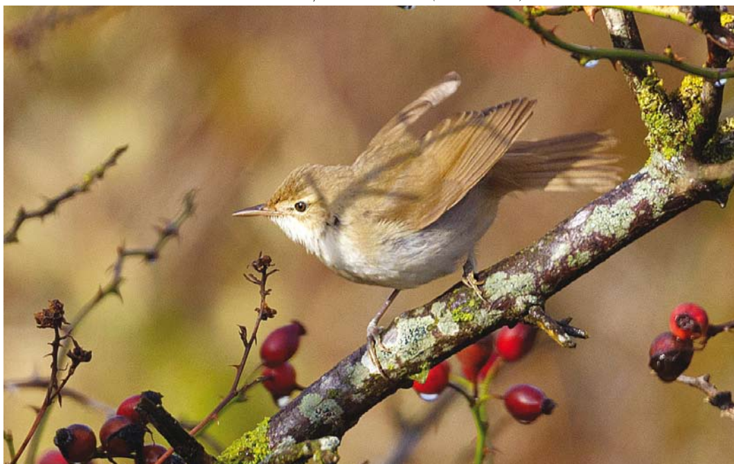
537 Struikrietzanger / Blyth's Reed Warbler Acrocephalus dumetorum , eerstejaars, Polder Wassenaar, Texel, Noord-Holland, 15 oktober 2013