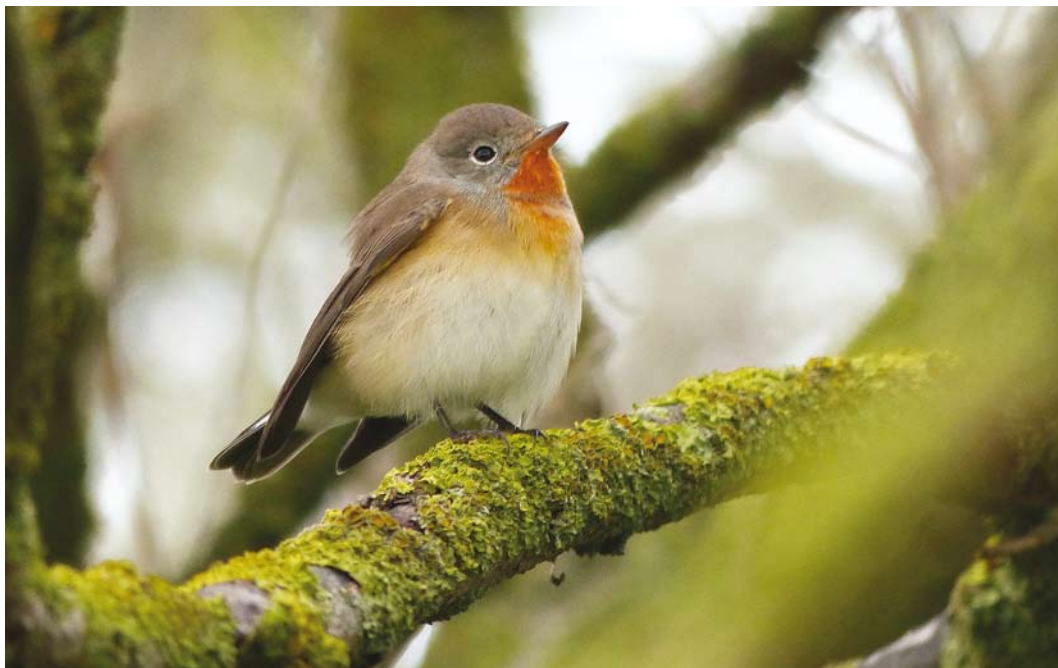
531 Kleine Vliegenvanger / Red-breasted Flycatcher Ficedula parva , adult mannetje, Rottumerplaat, Groningen, 21 september 2013 (Richard Houtman)