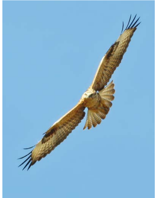
522 Arendbuizerd / Long-legged Buzzard Buteo rufinus , juveniel, Tweede Maasvlakte, Zuid-Holland, 26 september 2013