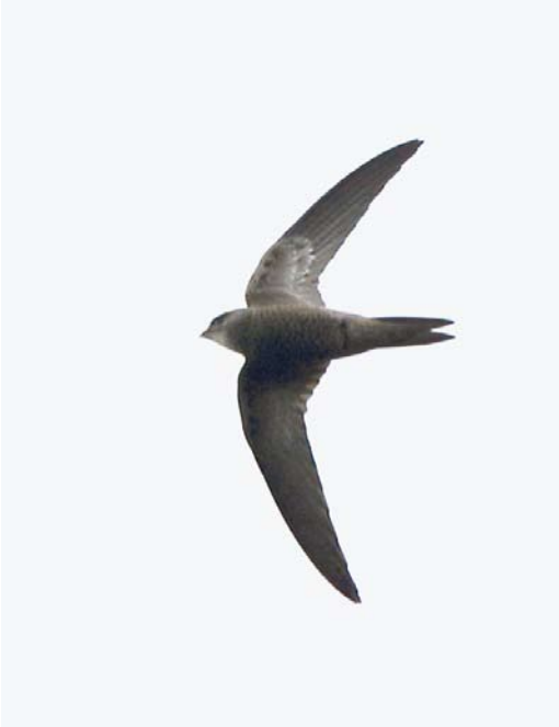
555 Vale Gierzwaluw / Pallid Swift Apus pallidus , Groot-IJsselmonde, Rotterdam, Zuid-Holland, 2 november 2013