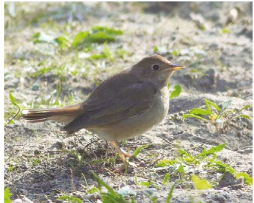
540 Siberische Boompieper / Olive-backed Pipit Anthus hodgsoni , Reddingsweg, Schiermonnikoog, Friesland, 10 oktober 2013 541 Blauwstaart / Red-flanked Bluetail Tarsiger cyanurus , eerstejaars, Lange Paal, Vlieland, Friesland, 23 oktober 2013 542 Raddes Boszanger / Radde's Warbler Phylloscopus schwarzi , Tweede Maasvlakte, Zuid-Holland, 30 september 2013 543 Noordse Nachtegaal / Thrush Nightingale Luscinia luscinia , eerstejaars, Maasvlakte, Zuid-Holland, 3 oktober 2013

op 27 september bij Castricum; en op 4 oktober in de Amsterdamse Waterleidingduinen bij Zandvoort. Maar ook veldwaarnemers konden hun hart ophalen met twitchbare vogels op Texel op 28 september, van 10 tot 15 oktober en op 20 en 21 oktober. Legio vogelaars konden daarmee een nieuwe soort bij schrijven. Ten slotte was er nog een melding bij Katwijk op 8 oktober. Waterrietzangers A. paludicola werden geringd op 7 september bij Zandvoort (adult) en op 7 en 9 september bij Castricum. Een late eerstejaars Grote Karekiet A. arundinaceus werd op 6 en 8 oktober gevangen bij Ooij. De enige Graszangers Cisticola juncidis van deze periode verbleven op 6 september bij Cadzand, Zeeland, en op 19 oktober bij Kloosterzande, Zeeland.