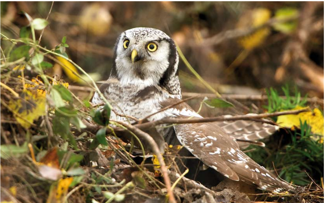
490 Northern Hawk-Owl / Sperweruil Surnia ulula , Zwolle, Overijssel, Netherlands, 27 November 2013