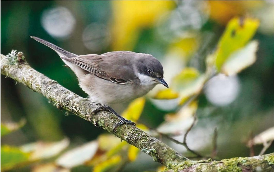
499 Western Orphean Warbler / Westelijke Orpheusgrasmus Sylvia hortensis , Orlandon Kilns, Pembrokeshire, Wales, 17 November 2013