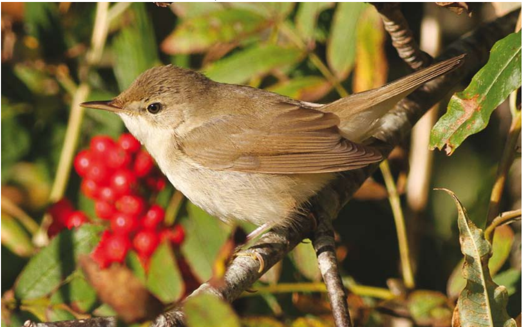
500 Blyth's Reed Warbler / Struikrietzanger Acrocephalus dumetorum , first-year, Øygarden, Hordaland, Norway, 27 September 2013 ( Julian Bell )