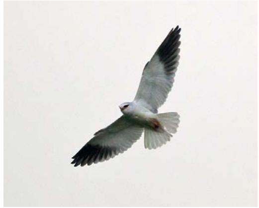
457 Black-winged Kite / Grijze Wouw Elanus caeruleus , second calendar-year, Keent, Noord-Brabant, 12 April 2012