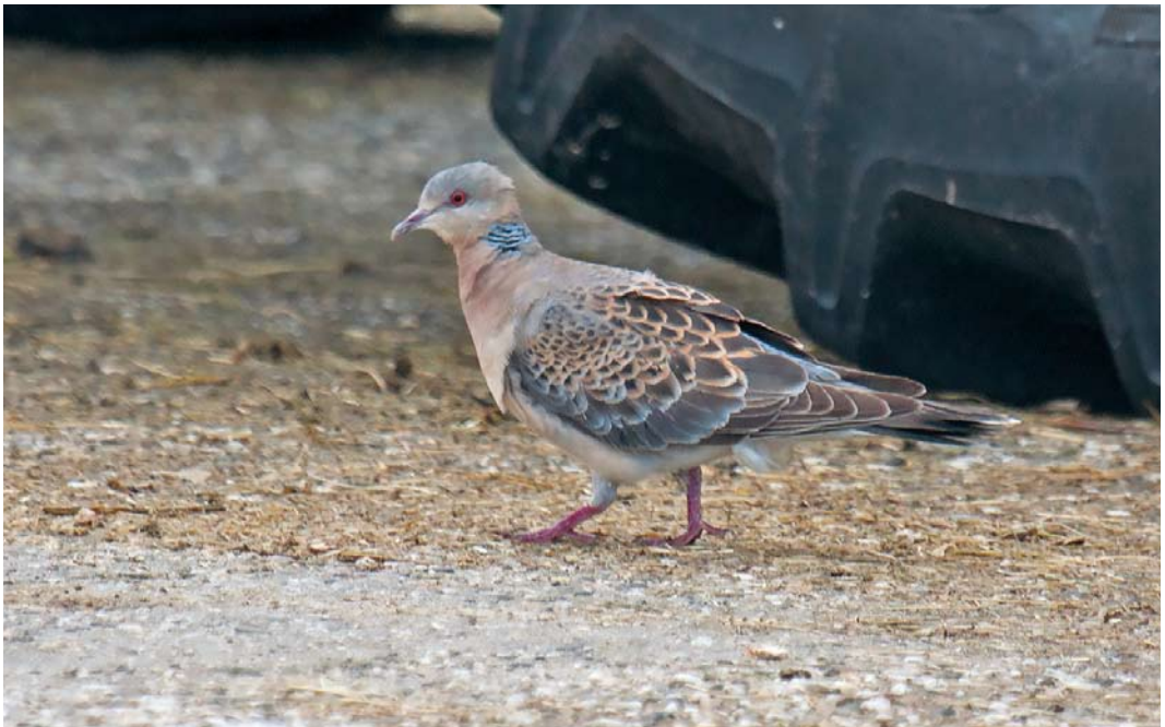
550 Meenatortel / Rufous Turtle Dove Streptopelia orientalis meena , Kooiweg, Schiermonnikoog, Friesland, 11 oktober 2013 (Martijn Bunskoek)

Indien aanvaard betreft het de tweede Oosterse Tortel en tweede Meenatortel voor Nederland; de eerste bevond zich van 23 december 2009 tot 3 april 2010 in Wergea (Dutch Birding 32: 116-125, 2010, 33: 357-376, 2011). Een recent ingediende melding van een eerstejaars die werd gefotografeerd aan boord van een vrachtschip op de Noordzee c 50 zeemijl ten noordwesten van Texel, Continentaal Plat, op 16 november 2010 ( http://waarneming.nl/waarneming/view/78266442 ) kan daar