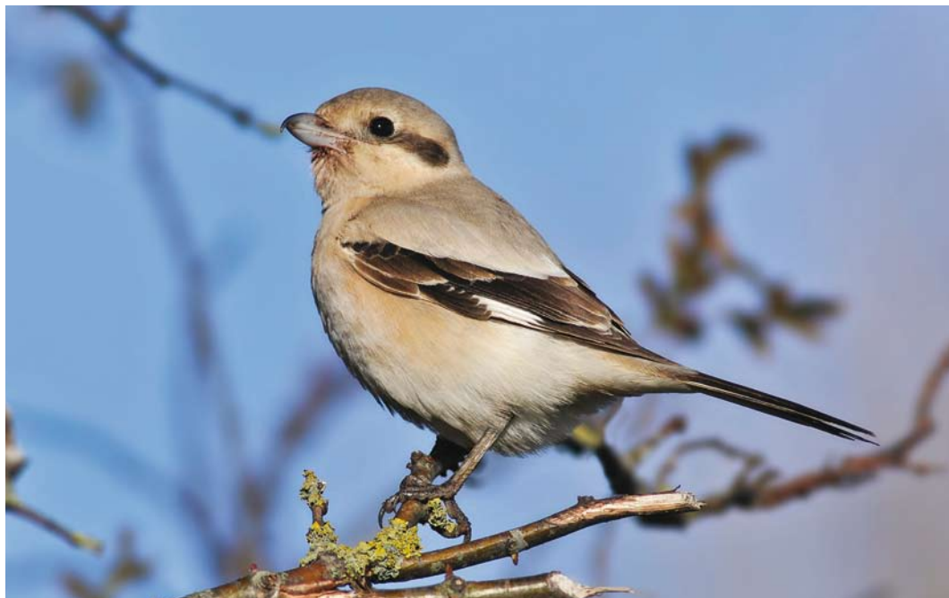
465 Steppe Grey Shrike / Steppeklapekster Lanius lahtora pallidirostris , first-year, Buitendijk, Texel, Noord-Holland, 5 November 2012 (René Pop)

it flew off, it could not be relocated. It concerns the seventh record and the sixth for the north of the country.