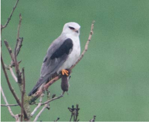
456 Black-winged Kite / Grijze Wouw Elanus caeruleus , second calendar-year, Keent, Noord-Brabant, 13 April 2012 (Jaap Denee)