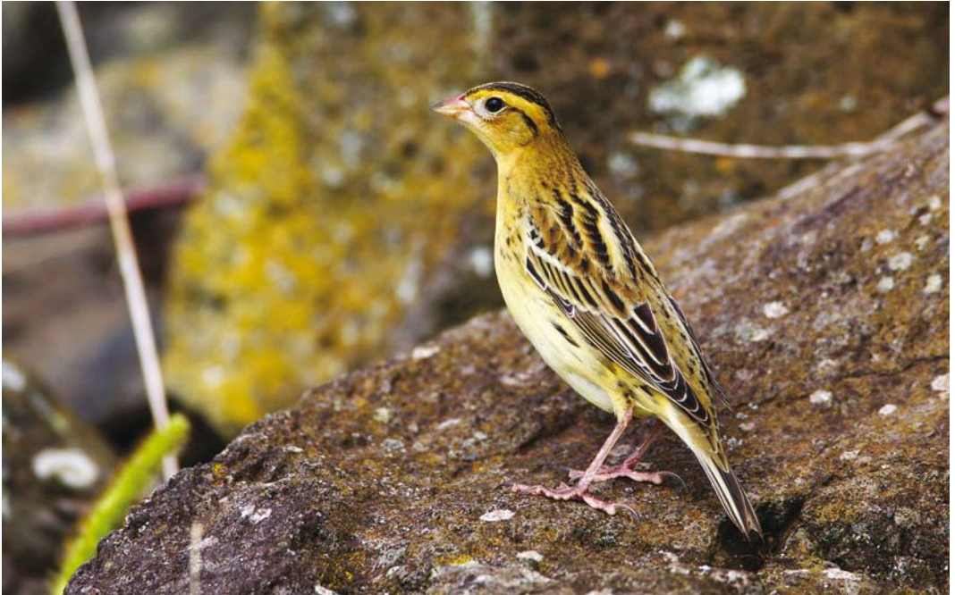
516 Bobolink / Bobolink Dolichonyx oryzivorus , Corvo, Azores, 12 October 2013 (Mika Bruun)