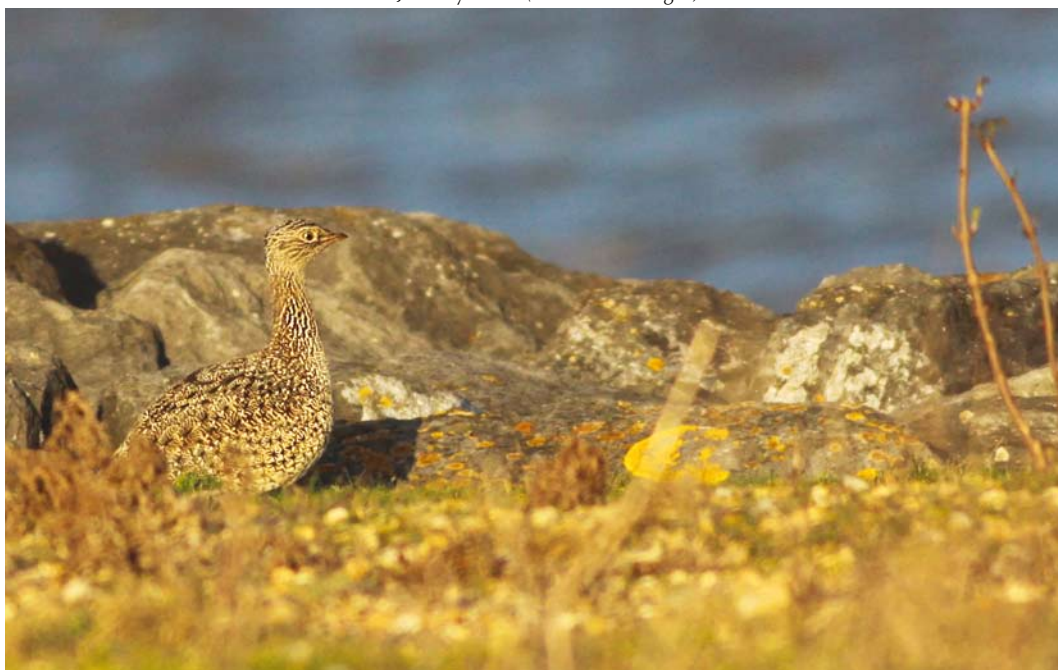
459 Little Bustard / Kleine Trap Tetrax tetrax , Verdronken Land van Saeftinge, Zeeland, 15 January 2012