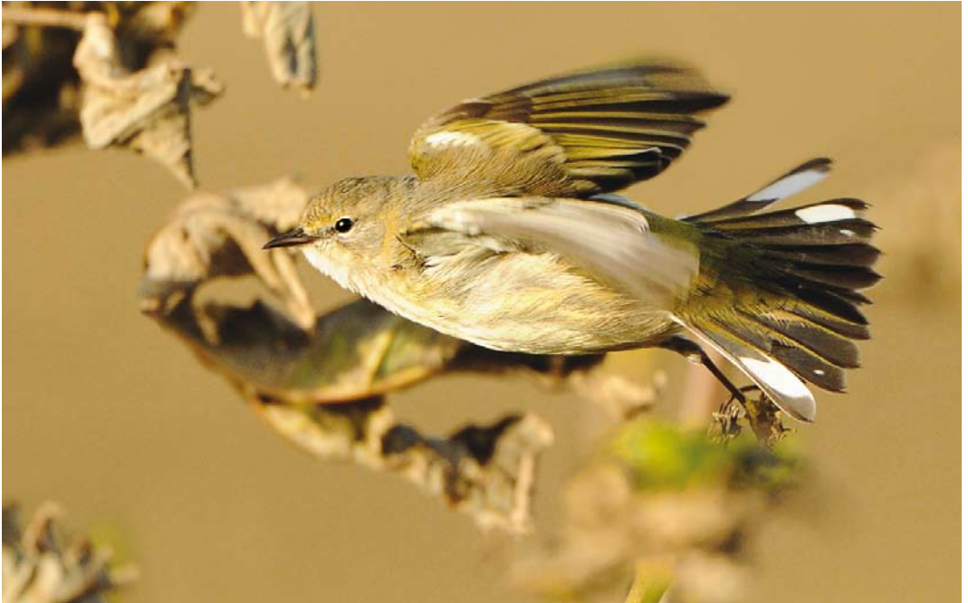
504 Cape May Warbler / Tijgerzanger Setophaga tigrina , first-year female, Baltasound, Unst, Shetland, Scotland, 2 November 2013