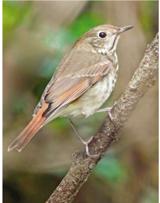
496 Isabelline Wheatear / Izabeltapuit Oenanthe isabellina , Heist, West-Vlaanderen, Belgium, 2 October 2013 497 Hermit Thrush / Heremietlijster Catharus guttatus , first-year, Porthgwarra, Cornwall, England, 30 October 2013 498 Siberian Rubythroat / Roodkeelnachtegaal Calliope calliope , first-year male, Ormož, Slovenia, 24 October 2013