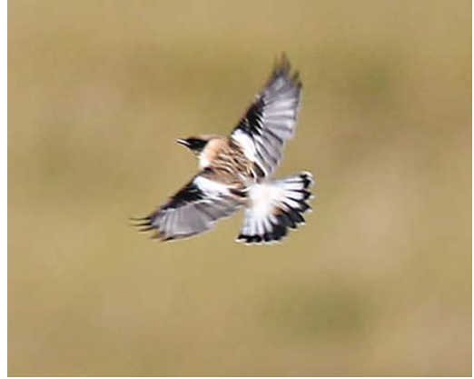
472 Caspian Stonechat / Kaspische Roodborstapuit Saxicola maurus hemprichii , adult male, Kooisplek, Vlieland, Friesland, 6 October 2012 (Rob Halff)

photographed, videoed (H Zevenhuizen, E Nieuwstraten et al; Bot et al 2012; Birding World 25: 421, 2012, Dutch Birding 34: 379, plate 521-524, 381, plate 525-526, 384, plate 527, 2012).