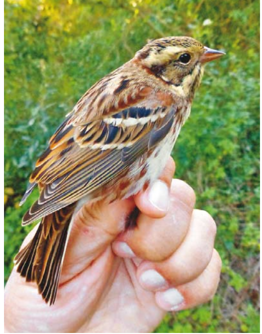
549 Bosgors / Rustic Bunting Emberiza rustica , eerstejaars mannetje, Groene Glop, Schiermonnikoog, Friesland, 29 september 2013

Nachtegaal Luscinia luscinia werd op 7 september gevangen bij Bloemendaal. Daarnaast liet een exemplaar zich op 3 oktober aardig bekijken op de Maasvlakte; twitchbare najaarsvogels zijn zeer zeldzaam (eerste oktober-waarneming). Na een jaar zonder Blauwstaarten Tarsiger cyanurus werd vogelend Nederland weer verwend met waarnemingen van deze prachtige soort, namelijk van 12 tot 16 oktober bij de Kwade Hoek, op 15 oktober op de noordpunt van Texel en van 17 tot 23 oktober bij Lange Paal op Vlieland. Aziatische Roodborsttapuiten Saxicola maurus werden vastgesteld op 21 en 22 september en op 10 oktober op de noordpunt van Texel en op 14 en 15 oktober bij Den Helder, Noord-Holland; op 16 oktober volgde opnieuw een melding van de noordpunt van Texel. Alweer de zevende Izabeltapuit Oenanthe isabellina bevond zich van 25 oktober tot 8 november op de Maasvlakte; de eerste verbleef eveneens op de Maasvlakte van 21 oktober tot 8 november 1996. Een mannetje Woestijntapuit O. deserti verbleef van 31 oktober tot 2 november bij Westkapelle. Tussen 12 september en 25 oktober werden 16 Kleine Vliegenvangers Ficedula parva gemeld. Vooral de Waddeneilanden waren goed vertegenwoordigd, met zes waarnemingen op Vlieland, drie op Texel, één op Terschelling en één op Schiermonnikoog (vangst op 12 september). Een fraai adult mannetje was aanwezig op Rottumerplaat op 20 en 21 september. Alleen trektellers registreerden al 126 Grote Piepers Anthus richardi , het