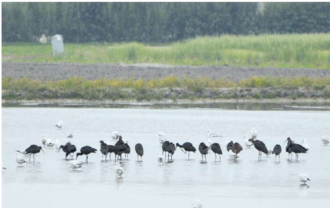
523 Zwarte Ibissen / Glossy Ibis Plegadis falcinellus , St Maartensbrug, Noord-Holland, 25 september 2013 (Ruud E Brouwer)