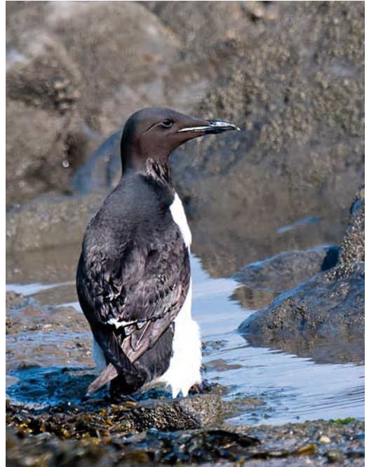
462 Eurasian Pygmy Owl / Dwerguil Glaucidium passerinum , Holwerd, Friesland, 2 August 2012 463 Thick-billed Murre / Kortbekzeekoet Uria aalge , adult, Kustweg, Lauwersmeer, Groningen, 29 July 2012 464 Thick-billed Murre / Kortbekzeekoet Uria aalge , adult, Den Helder, Noord-Holland, 12 August 2012