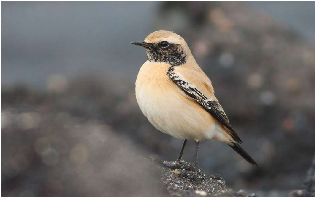
547 Woestijntapuit / Desert Wheatear Oenanthe deserti , eerstejaars mannetje, Westkapelle, Zeeland, 31 oktober 2013 ( Pim A Wolf )