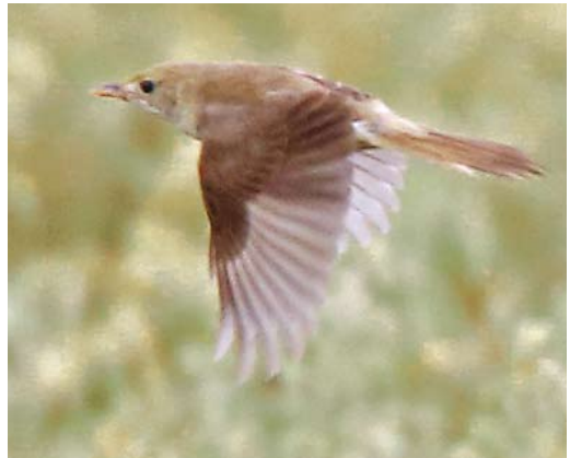
492 Siberian Rubythroat / Roodkeelnachtegaal Calliope calliope , first-year male, Ormož, Slovenia, 24 October 2013 ( Dare Šere ) 493 White-rumped Swift / Kaffergierzwaluw Apus caffer , Stenshuvud, Södra Mellby, Skåne, Sweden, 27 October 2013 ( Magnus Ullman ) 494 Daurian Shrike / Daurische Klauwier Lanius isabellinus , Leefdaal, Vlaams-Brabant, Belgium, 27 September 2013 ( Vincent Legrand ) 495 Thick-billed Warbler / Diksnavelrietzanger Iduna aedon , Geosetter, Mainland, Shetland, Scotland, 5 October 2013 ( Jim Lawrence )

this autumn were in Cork on 26 September and in Kerry on 1-2 October. Others were seen on Fair Isle on 6 October and at Prussia Cove, Cornwall, on 23 October. In late September, four first-winter Brown Shrikes Lanius cristatus were present in Scotland: on North Ronaldsay, Orkney, on 24-29 September; on Mainland, Shetland, on 27-30 September; in Fife on 28 September; and in Aberdeenshire on 28-29 September. On 20 September, a first-winter was seen in Hampshire, England. Five White-headed Long-tailed Tits Aegithalos caudatus caudatus at Halligarth, Shetland, on 3 November constituted the taxon's first record for Scotland. The first Eurasian Crag Martin Ptyonoprogne rupestris for Estonia turned up at Saarenmaa on 11 November.