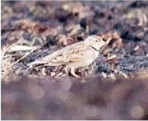
466 Calandra Lark / Kalendarleeuwerik Melanocorypha calandra , Sallandse Heuvelrug, Overijssel, 29 April 2011

The second record, also for Texel, where the first was seen on 4-23 September 1994 (Wassink 1997). Given the multiple records in north-western Europe, it was long overdue. Not surprisingly, it was admired by 100s of birders during its stay. Ebels (2013) published a survey and analysis of all European records up to 2012 (73).