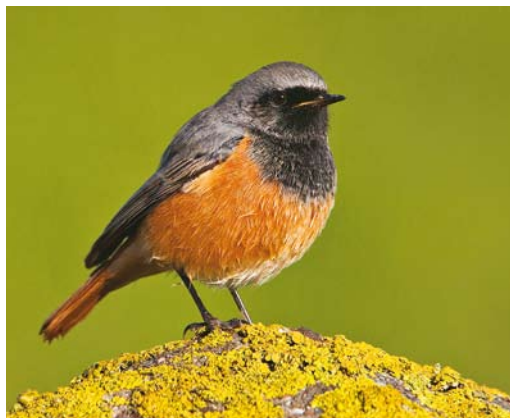
470 Eastern Black Redstart / Oosterse Zwarte Roodstaart Phoenicurus ochruros phoenicuroides , first calendar-year male, Paesens, Friesland, 12 November 2012 (Rob Olivier)