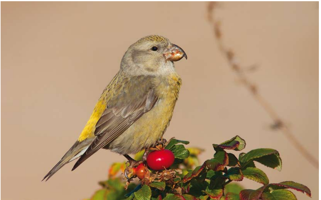
505 Parrot Crossbill / Grote Kruisbek Loxia pytyopsittacus , female, Helgoland, Schleswig-Holstein, Germany, 14 October 2013