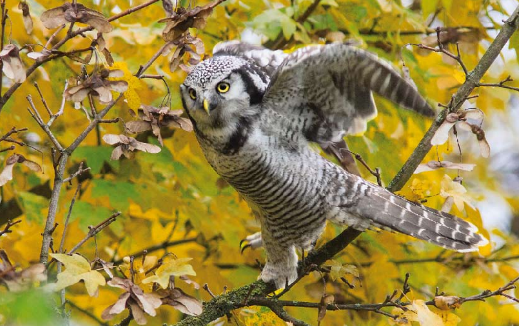
489 Northern Hawk-Owl / Sperweruil Surnia ulula , Zwolle, Overijssel, Netherlands, 27 November 2013 (Claudia Burger)