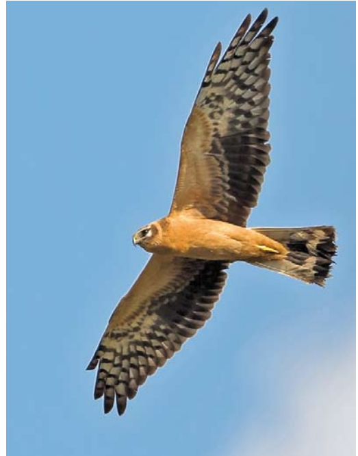
525 Dwergooruil / Eurasian Scops Owl Otus scops, eerstejaars mannetje, Rhoon, Zuid-Holland, 7 oktober 2013. Vogel na vrijlating (verzwakt gevonden op Maasvlakte, Zuid-Holland, op 18 september 2013) 526 Steppekiekendief / Pallid Harrier Circus macrourus, juveniel, Brabantsche Biesbosch, Noord-Brabant, 8 september 2013 527 Hop / Eurasian Hoopoe Upupa epops, adult, Katwijk, Zuid-Holland, 28 september 2013