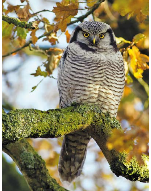
486 Black-billed Cuckoo / Zwartsnavelkoekoek Coccyzus erythrophthalmus , first-year, Brélès, Finistère, France, 15 November 2013 487 Northern Hawk-Owl / Sperweruil Surnia ulula , Gristede, Niedersachsen, Germany, 13 November 2013 488 Pintail Snipe / Stekelstaartsnip Gallinago stenura , Maagan Michael, Israel, 12 October 2013