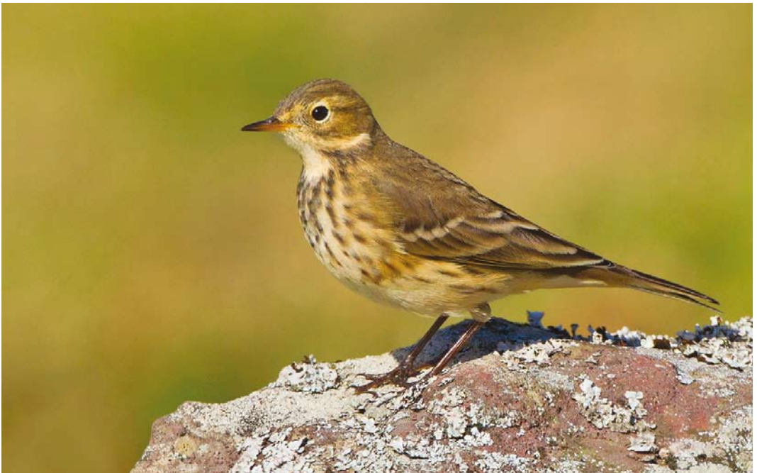
517 Buff-bellied Pipit / Pacifische Waterpieper Anthus rubescens , Corvo, Azores, 3 October 2013 (David Monticelli)