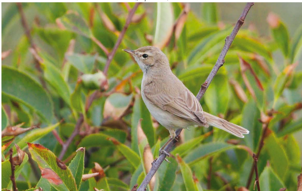
545 Kleine Spotvogel / Booted Warbler Iduna caligata , Duinkersoord, Vlieland, Friesland, 4 oktober 2013 ( Jaap Denee )