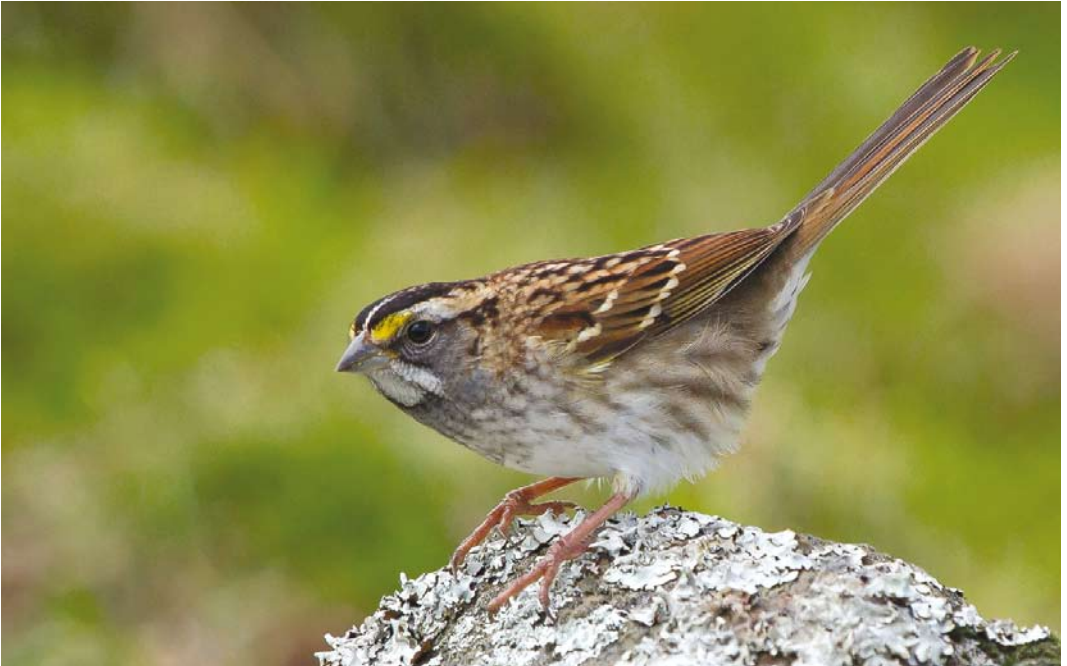
514 White-throated Sparrow / Witkeelgors Zonotrichia albicollis , Corvo, Azores, 16 October 2013 (Kris De Rouck)