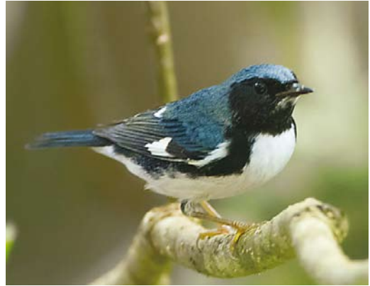
519 Black-throated Blue Warbler / Blauwe Zwartkeelzanger Setophaga caerulescens , adult male, Corvo, Azores, 4 October 2013

and at Toab on 10-12 October. In Norway, one was trapped (and seen the next day) on Træna, Nordland, on 23 September and another was seen on Ona, Møre og Romsdal, on 26 September. In Iceland, up to four American Buff-bellied Pipits A. rubescens rubescens were present at Miðnes on 28-29 September. On 5-8 October, singles were found on Inishmore; on Foula (until 27 October); on Yell; and at Rumps Point, Cornwall.