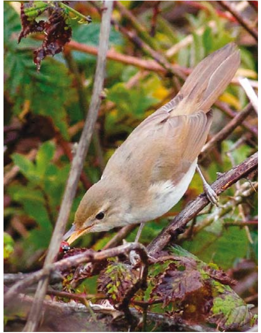
528 Westelijke Rosse Waaiertaar / Western Rufous-tailed Scrub Robin Cercotrichas galactotes galactotes , eerstejaars, Camperduin, Noord-Holland, 27 september 2013 ( René van Rossum ) 529 Struikrietzanger / Blyth's Reed Warbler Acrocephalus dumetorum , eerstejaars, Polder Wassenaar, Texel, Noord-Holland, 12 oktober 2013 ( Garry Bakker ) 530 Vermoedelijke Siberische Braamsluiper / probable Blyth's Lesser Whitethroat Sylvia curruca blythi , Bloemendaal, Noord-Holland, 18 oktober 2013 ( Arnoud B van den Berg/The Sound Approach )