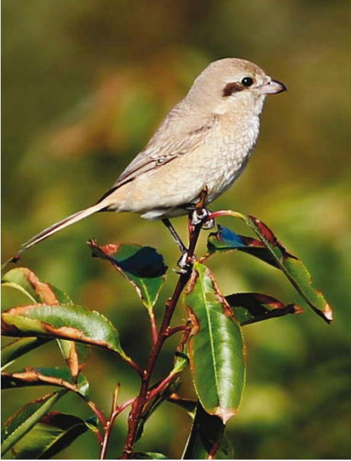
548 Daurische Klauwier / Daurian Shrike Lanius isabellinus , eerstejaars, Oude Huizenlid, Vlieland, Friesland, 7 oktober 2013 (Gijsbert Mourik)