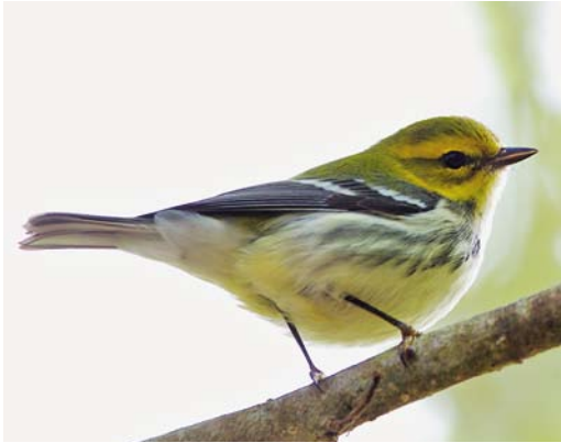
518 Black-throated Green Warbler / Gele Zwartkeelzanger Setophaga virens , first-year male, Corvo, Azores, 24 October 2013