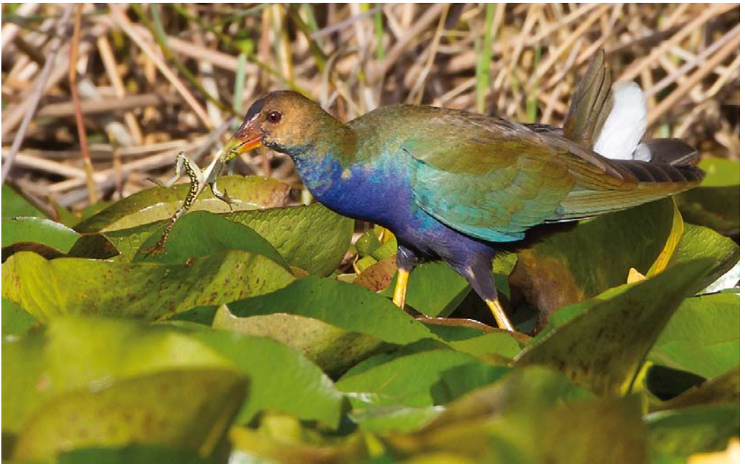
482 Purple Gallinule / Amerikaans Purperhoen Porphyrio martinicus , first-year, Monsanto, Lisboa, Portugal, 8 November 2013