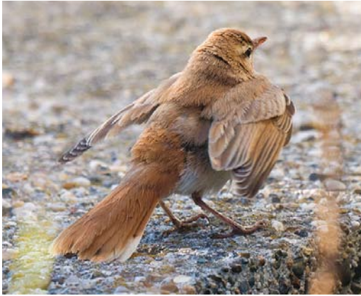
477 Westelijke Rosse Waaiersstaart / Western Rufous-tailed Scrub Robin Cercotrichas galactotes galactotes , Camperduin, Noord-Holland, 27 september 2013