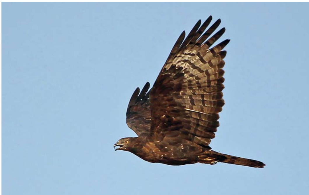
226 Crested Honey Buzzard / Aziatische Wespensdief Pernis ptilorhyncus , Eilat, Israel, 8 April 2012 (Kris De Rouck)