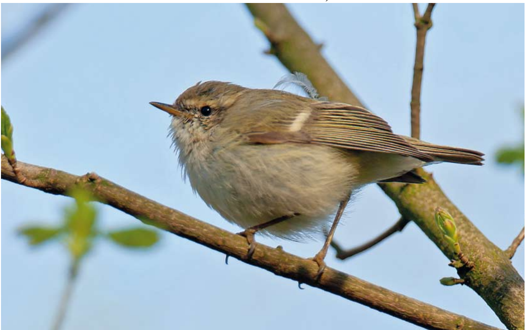
277 Humes Bladkoning / Hume's Leaf Warbler Phylloscopus humei , Katwijk aan den Rijn, Zuid-Holland, 28 maart 2012 (Arnold W J Meijer)