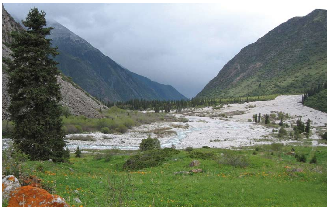
15 Mountain view at Ala Archa, Kyrgyzstan, 21 May 2007 ( Vincent van der Spek )