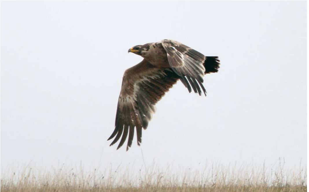
64 Steppe Eagle / Stepparend Aquila nipalensis , Skabersjö, Skåne, Sweden, 14 November 2009