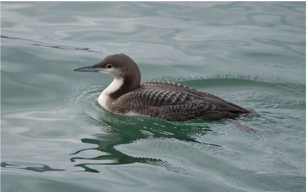
65 Pacific Loon / Pacifische Parelduiker Gavia pacifica , first-year, Santoña, Cantabria, Spain, 7 December 2009 (David Alvarez)