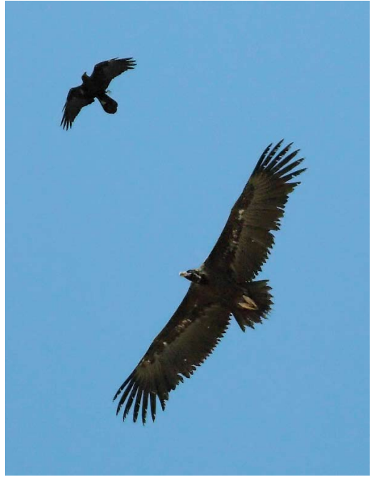
564 Upland Sandpiper / Bartrams Rooter Bartramia longicauda , Santa Luzia, Tavira, Portugal, 3 October 2010 ( Menno van Duijn ) 565 Cinereous Vulture / Monniksgier Aegypius monachus , with Brown-necked Raven / Bruinnekraaf Corvus ruficollis , Bir Shalatein, Egypt, 15 October 2010 ( Benjamin Steffen ) 566 Namaqua Doves / Maskerduiven Oena capensis , El Gouna, Egypt, 2 October 2010 ( Edwin Winkel )