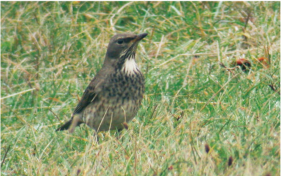
532 Black-throated Thrush / Zwartkeellijster Turdus atrogularis , adult female, 't Horntje, Texel, Noord-Holland, 1 November 2009