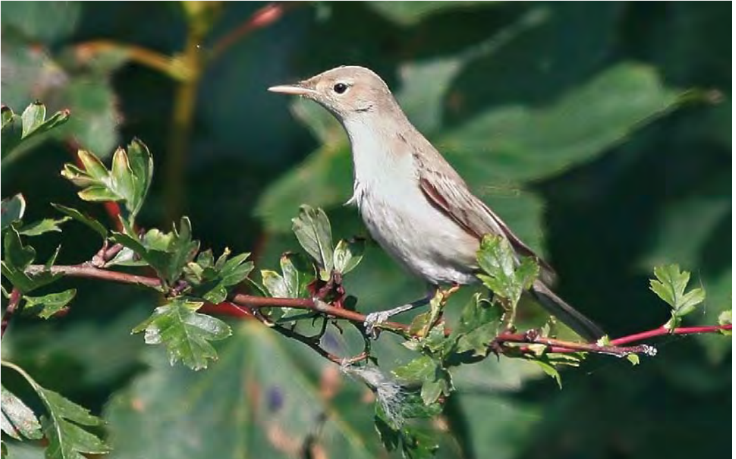
471 Eastern Olivaceous Warbler / Oostelijke Vale Spotvogel Iduna pallida , Flamborough Head, East Yorkshire, England, 1 September 2010 (John Harwood)