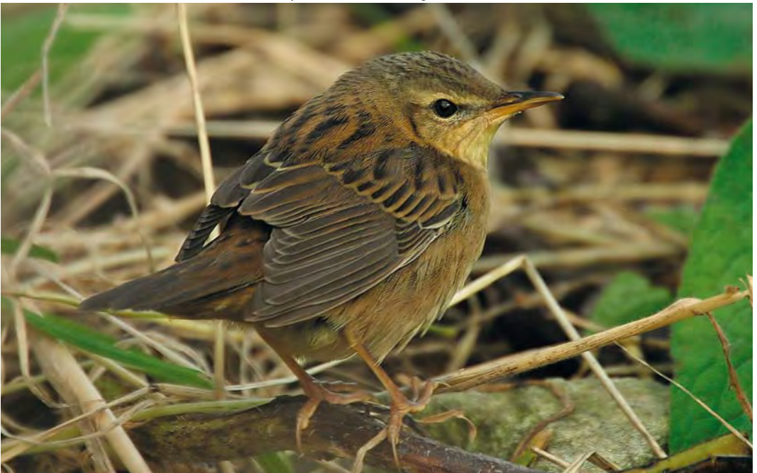
472 Pallas's Grasshopper Warbler / Siberische Sprinkhaanzanger Locustella certhiola , Fair Isle, Shetland, Scotland, 23 September 2010 (Dougie Preston)