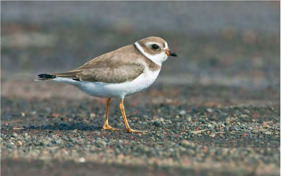
411 Semipalmated Plover / Amerikaanse Bontbekplevier Charadrius semipalmatus , first-winter, airport area, Corvo, Azores, 24 October 2007 ( Rafael Armada )