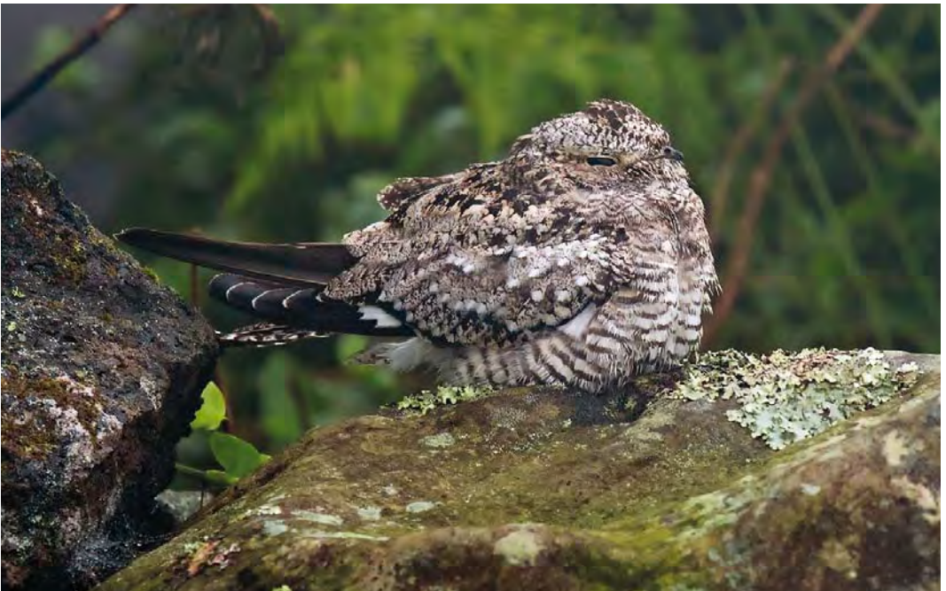
412 Common Nighthawk / Amerikaanse Nachtzwaluw Chordeiles minor , juvenile, main road to lighthouse, Corvo, Azores, 25 October 2007 (Vincent Legrand)