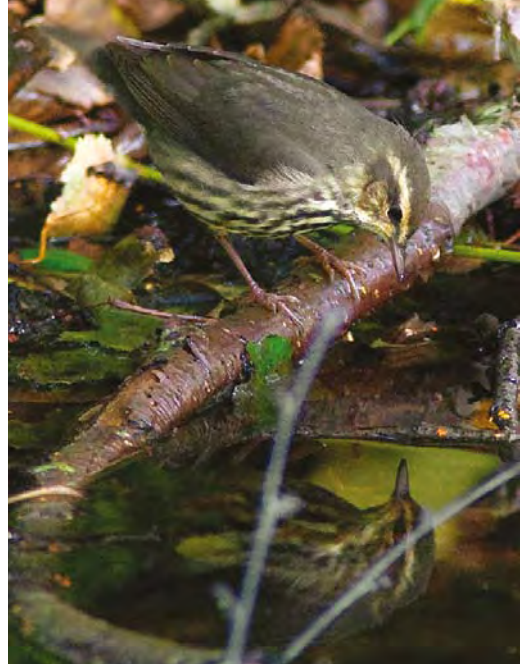
500 Noordse Waterlijster / Northern Waterthrush Seiurus noveboracensis , Oude Eendenkooi, Vlieland, Friesland, 18 september 2010 501-502 Noordse Waterlijster / Northern Waterthrush Seiurus noveboracensis , Oude Eendenkooi, Vlieland, Friesland, 18 september 2010