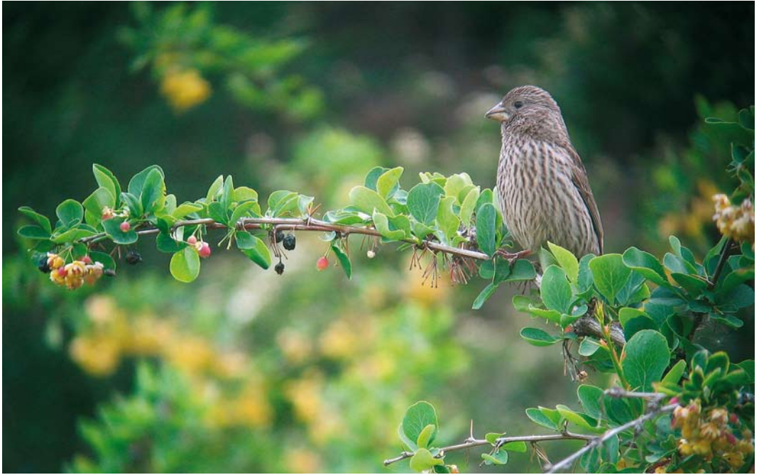
20 Red-mantled Rosefinch / Roze Roodmus Carpodacus rhodochlamys , female, Grigorievka, Kyrgyzstan, 25 May 2007 (Vincent van der Spek) 21 Red-tailed Shrike / Turkestaanse Klauwier Lanius phoenicuroides , female, Chon Kemin, Kyrgyzstan, 23 May 2007 (Vincent van der Spek) 22 Isabelline Wheatear / Izabeltapuit Oenanthe isabellina , Ak Soy, Kyrgyzstan, 25 May 2009 (Vincent van der Spek)