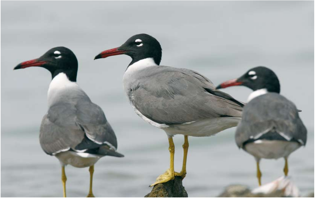
32 White-eyed Gulls / Witoogmeeuwen Larus leucophthalmus , adult summer, El Gouna, Egypt, 9 May 2007 ( Edwin Winkel ). Note striking appearance, with charcoal black hood, deep red bill with black tip, flashing white neck-band and fresh yellow legs. 33 Sooty Gull / Hemprichs Meeuw Larus hemprichii , adult (centre), and White-eyed Gulls / Witoogmeeuwen L. leucophthalmus , adult, El Gouna, Egypt, 10 May 2007 ( Edwin Winkel )