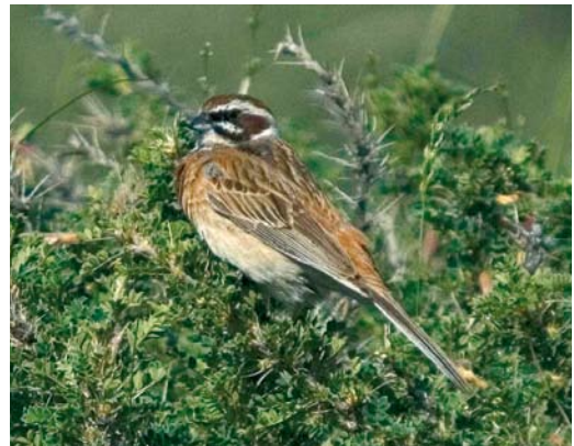
16 Masked Wagtail / Maskerkwikstaart Motacilla personata , Temir Kanat, Kyrgyzstan, 29 May 2007 (Vincent van der Spek) 17 Red-fronted Serins / Roodvoorhoofdkanaries Serinus pusillus , Grigorievka, Kyrgyzstan, 25 May 2007 (Vincent van der Spek) 18 White-bellied Dipper / Witbuikwaterspreeuw Cinclus cinclus leucogaster , May Saz, Kyrgyzstan, 14 July 2009 (Machiel Valkenburg) 19 Meadow Bunting / Weidegors Emberiza cioides , Jeti Ögüz, Kyrgyzstan, 27 May 2007 (Peter Hoppenbrouwers)

attract waders like Terek Sandpiper and with some luck one may stumble upon a Lesser Sand Plover Charadrius mongolus . South of Issyk Kul there are more mountainous areas with alpine species. The river valley west of the village of Tuura-Suu, south of the western shores of the big lake, might be the nearest spot from Bishkek to see one of the most remarkable waders of the world: Ibisbill. The species is more common further east but this area can be reached within half a day from the capital. To reach this site you pass the beautiful Tuura-Suu gorge, with its typical lower mountainous species. Cinereous Vultures Aegypius monachus are not uncommon here.