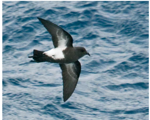
51-52 White-bellied Storm Petrel / Witbuikstormvogeltje Fregetta grallaria , between South Georgia and Gough Island (45°S, 21°W), 6 April 2009 (Steve N G Howell). Note narrow black leading edge to underwing, relatively small black hood and clean-cut, almost parallel-sided borders to large white belly patch on these two individuals. Distinct toe projections (score 2.5-3) suggest they are a smaller form of South Atlantic White-bellied Storm Petrel (cf plate 55). 53 Black-bellied Storm Petrel / Zwartbuikstormvogeltje Fregetta tropica , northeast of South Georgia (51°S, 30°W), 4 April 2009 (Steve N G Howell). Classically marked individual (belly score 4.5), but with no toe projection. 54 Black-bellied Storm Petrel / Zwartbuikstormvogeltje Fregetta tropica , at sea east-northeast of Campbell Island, New Zealand, 19 November 2008 (Steve N G Howell). Although this heavily marked individual (belly score 5, toe projection 3) agrees with classic field guide illustrations, such well-marked birds are probably in a minority in many areas of this species' range.

wings of Atlantic White-bellied have a narrower black leading edge than on Black-bellied (plate 50-55). Given that Haase did not specifically describe the extent of black on the chest and underwing, or any toe projection, these features cannot be evaluated, and the last is not relevant to Atlantic birds, anyway.