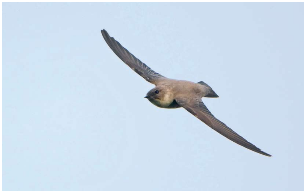
72 Eurasian Crag Martin / Rotszwaluw Ptyonoprogne rupestris , first-year, Maastricht, Limburg, Netherlands, 7 December 2009