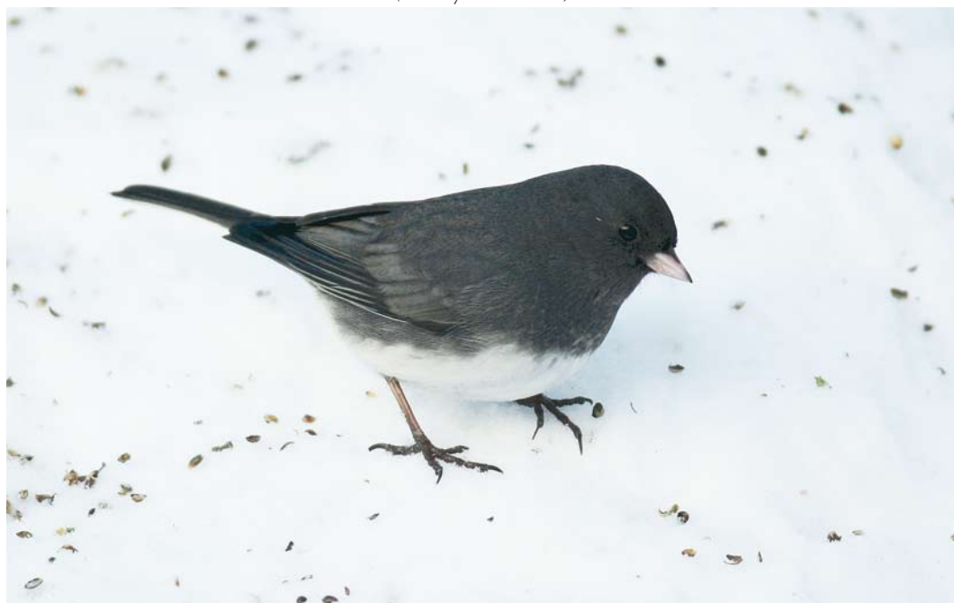
73 Dark-eyed Junco / Grijze Junco Junco hyemalis , adult male, Grimstad, Aust-Agder, Norway, 3 January 2010