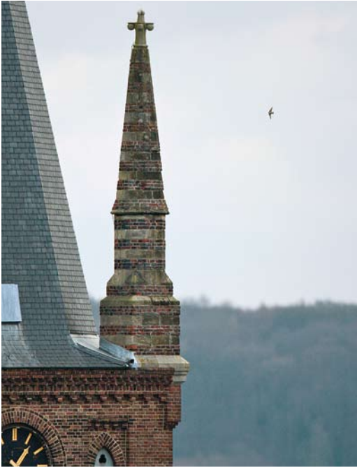
92 Rotszwaluw / Eurasian Crag Martin Ptyonoprogne rupestris , eerstejaars, Maastricht, Limburg, 10 december 2009 (Ran Schols)