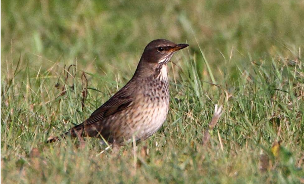
89 Zwartkeellijster / Black-throated Thrush Turdus atrogularis , adult vrouwtje, 't Horntje, Texel, Noord-Holland, 31 oktober 2009