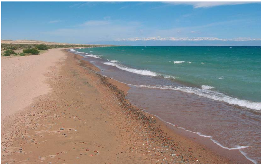
14 Issyk Kul lake at Ak Sai, Kyrgyzstan, 28 May 2007 ( Vincent van der Spek )