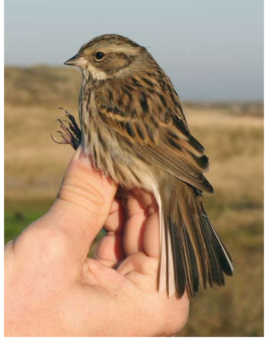
2-3 Maskergors / Black-faced Bunting Emberiza spodocephala oligoxantha , eerstejaars vrouwtje, Noordhollands Duinreservaat, Castricum, Noord-Holland, 18 november 2007 (Arnold Wijker)

dicht duingras begroeid valleetje, waar hij ondanks zorgvuldig zoeken niet meer werd teruggevonden. De waarneming is door de Commissie Dwaalgasten Nederlandse Avifauna (CDNA) aangevaard als derde geval en het betreft het 16e geval voor Europa.