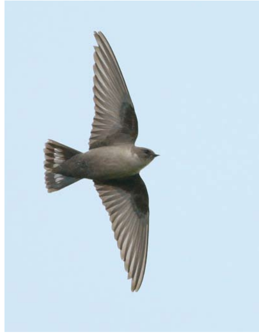
93 Rotszwaluw / Eurasian Crag Martin Ptyonoprogne rupestris , eerstejaars, Maastricht, Limburg, 7 december 2009