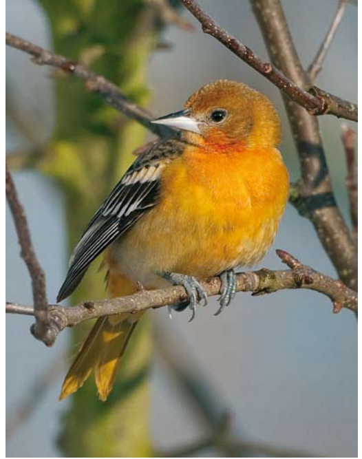
94 Baltimoretroepiaal / Baltimore Oriole Icterus galbula , eerste-winter, Oudorp, Alkmaar, Noord-Holland, 8 januari 2010 (Wilma van Holten) 95-96 Baltimoretroepiaal / Baltimore Oriole Icterus galbula , eerste-winter, Oudorp, Alkmaar, Noord-Holland, 7 januari 2010 (Hans Brinks)