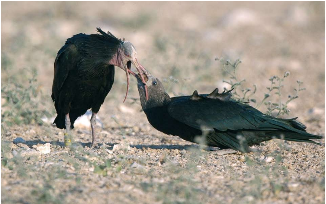
58 Northern Bald Ibises / Kaalkopibissen Geronticus eremita , adult feeding young, Palmyra, Syria, 13 July 2006

Could there still be undiscovered colonies in the