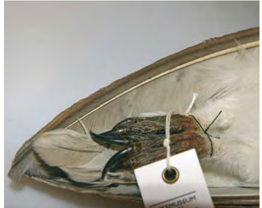
474 Witte Kerkuil / Pale Barn Owl Tyto alba alba (verzameld tussen / collected between Axel en / and Zuid-dorp, Zeeland, 14 maart 1983). Let op lichte ondervleugel zonder tekening en lichte onderzijde van staart / Note pale underwing without markings and pale underside of tail. Nationaal Natuurhistorisch Museum Naturalis, Leiden, 14 september 2007

De voorzichtige conclusie hiervan is dat in Nederland alleen de meest lichte alba 's met zekerheid op naam zijn te brengen en lichte guttata 's uitsluiten. Een aanvaardbare alba moet voldoen