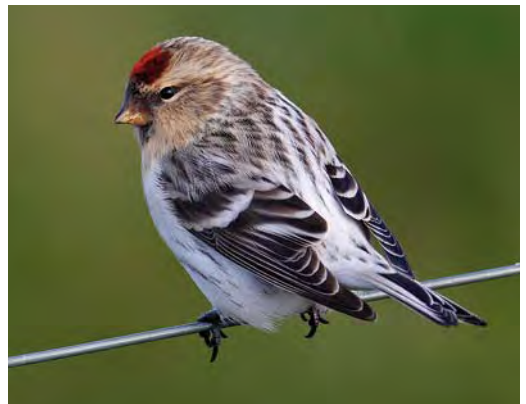
533-534 Eastern Crowned Warbler / Kroonboszanger Phylloscopus coronatus , South Shields, Durham, England, 23 October 2009 535 White-eyed Vireo / Witoogvireo Vireo griseus , Corvo, Azores, 18 October 2009 536 Philadelphia Vireo / Philadelphiavireo Vireo philadelphicus , Corvo, Azores, 6 October 2009 537 Cedar Waxwing / Cederpestvogel Bombycilla cedrorum , first-year, Inishbofin, Galway, Ireland, 14 October 2009 538 Hornemann's Redpoll / Groenlandse Witstuitbarmsijs Carduelis hornemanni hornemanni , Aith, Shetland, Scotland, 5 October 2009