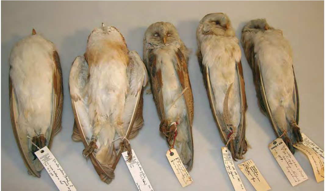
470-471 Witte Kerkuil / Pale Barn Owl Tyto alba alba (links / left; verzameld tussen / collected between Axel en / and Zuyddorp, Zeeland, 14 maart 1983). Tweede van links: Kerkuil T a guttata of vogel van intermediaire/hybride populatie vanwege roodbruine kleur op bovenzijde en donkere borst / second left: Dark Barn Owl T a guttata or 'intergrade/hybrid' because of red-brown coloration on upperparts and dark breast (geringd / ringed in Ackerdijkse Polder, Zuid-Holland). Drie vogels rechts / three birds on right: Witte Kerkuilen / Pale Barn Owls (verzameld in Engeland / collected in England). Tweede vogel van rechts is vrouwtje, overige zijn mannetjes / second bird from right is female, others are males. Nationaal Natuurhistorisch Museum Naturalis, Leiden, 14 september 2007