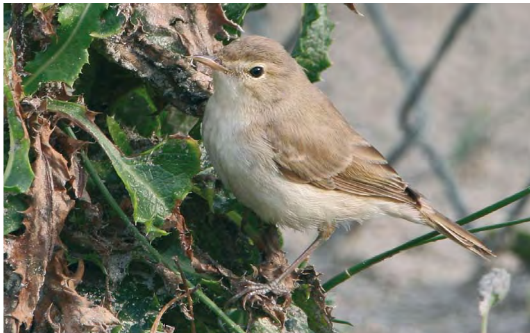
465 Booted Warbler / Kleine Spotvogel Acrocephalus caligatus , Maasvlakte, Zuid-Holland, Netherlands, 13 September 2008