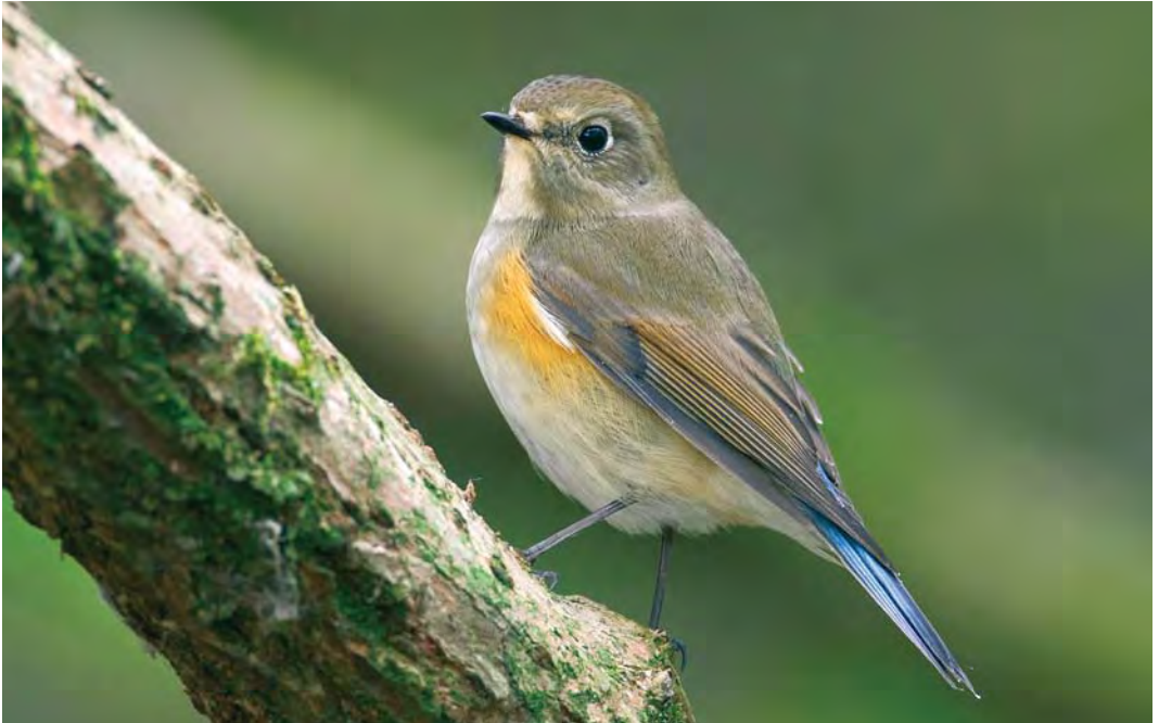
511 Red-flanked Bluetail / Blauwstaart Tarsiger cyanurus , first-year, Heist, West-Vlaanderen, Belgium, 18 October 2009 (Dirk Ottenburghs)