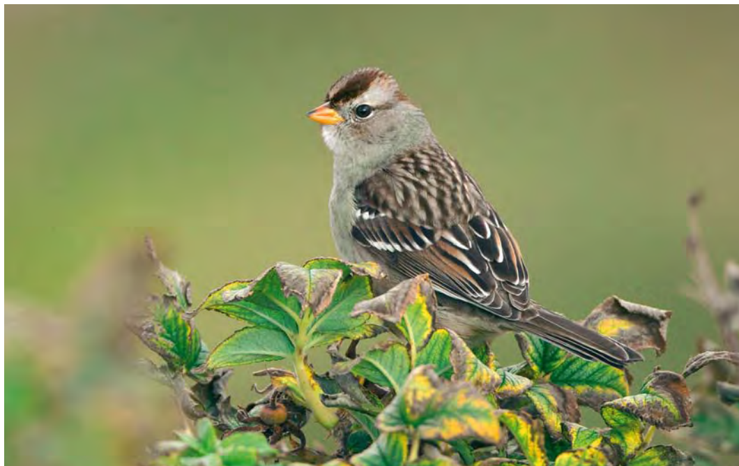
527 White-crowned Sparrow / Witkruingors Zonotrichia leucophrys , first-year, Ona, Sandøy, Møre og Romsdal, Norway, 9 October 2009