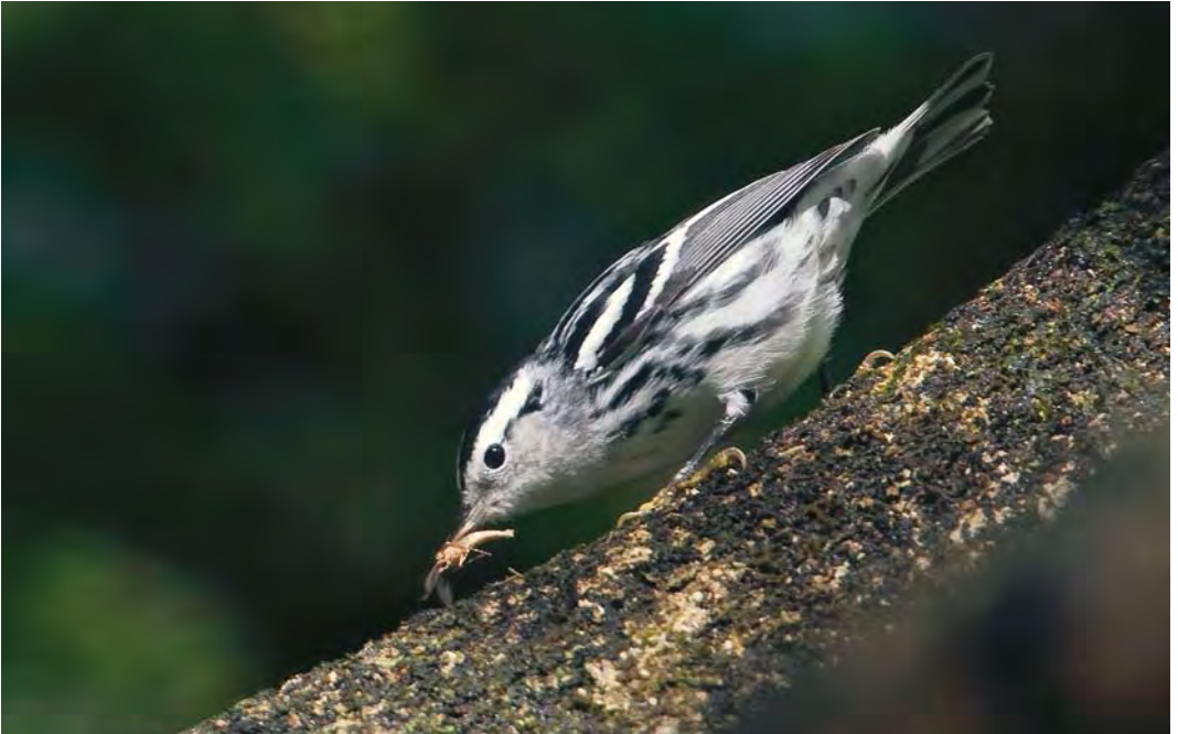
531 Black-and-white Warbler / Bonte Zanger Mniotilta varia , Ribeira do Ponte, Corvo, Azores, 7 October 2009 (Rafael Armada)