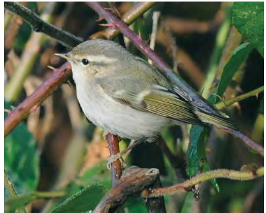
457 Red-flanked Bluetail / Blauwstaart Tarsiger cyanurus , Kroonspolders, Vlieland, Friesland, 6 October 2008 458 Red-flanked Bluetail / Blauwstaart Tarsiger cyanurus , Groene Glop, Schiermonnikoog, Friesland, 29 October 2008 459 Paddyfield Warbler / Veldriezanger Acrocephalus agricola , Zwanenwater, Noord-Holland, 4 June 2008 460 Hume's Leaf Warbler / Humes Bladkoning Phylloscopus humei , Offingawier, Friesland, 6 December 2008

photographed, videoed (T Fijen, T van Kessel, C Brinkman et al; Dutch Birding 30: 443, plate 531, 2008)