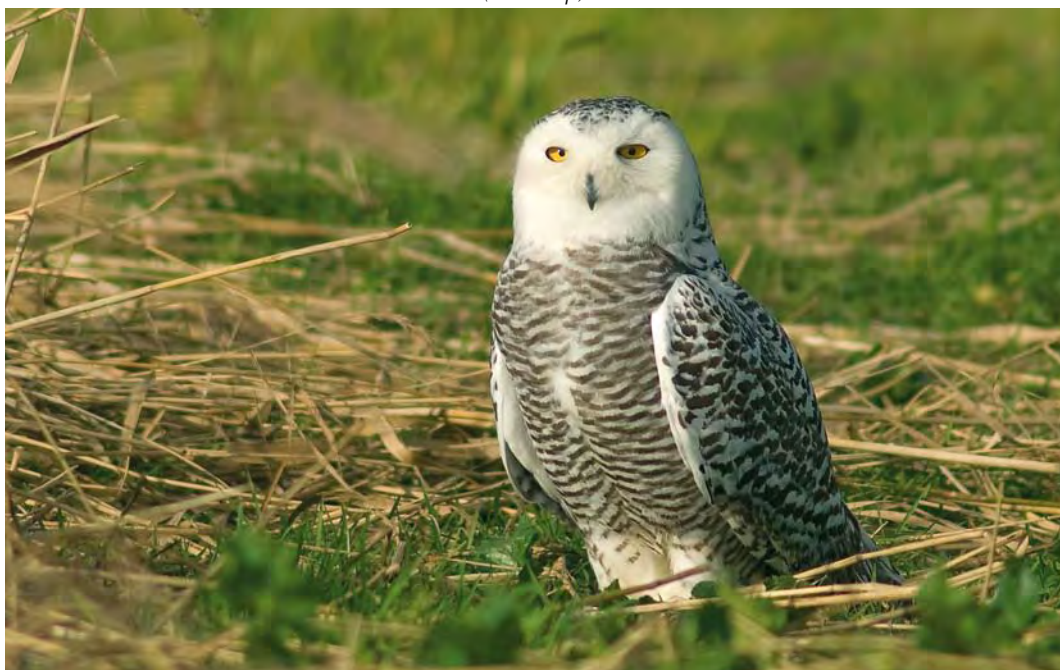
450 Snowy Owl / Sneeuwuil Bubo scandiacus , first-winter female, Texel, Noord-Holland, 17 November 2008