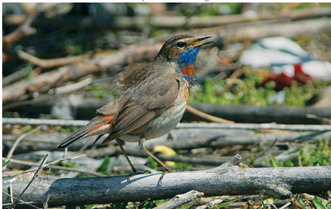
454 Red-spotted Bluethroat / Roodsterblauwborst Luscinia svecica svecica , male, Maasvlakte, Zuid-Holland, 18 May 2008 (Ellen Sandberg)