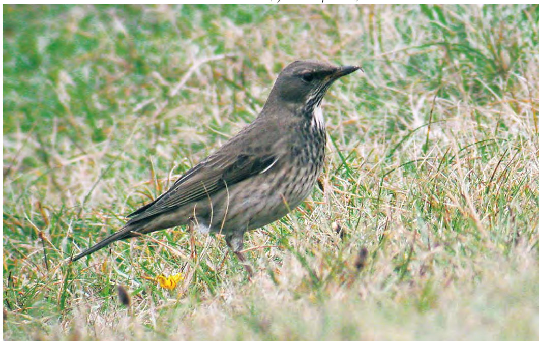
554 Zwartkeellijster / Black-throated Thrush Turdus atrogularis , adult vrouwtje, 't Horntje, Texel, Noord-Holland, 1 november 2009