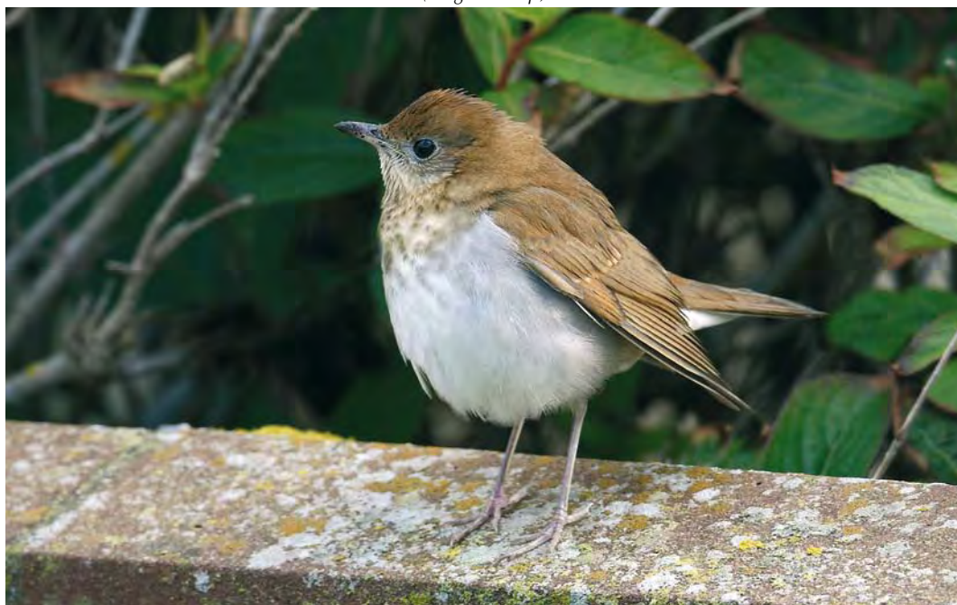
528 Veery / Veery Catharus fuscescens , first-year, Whalsay, Shetland, Scotland, 4 October 2009 (Hugh Harrop)