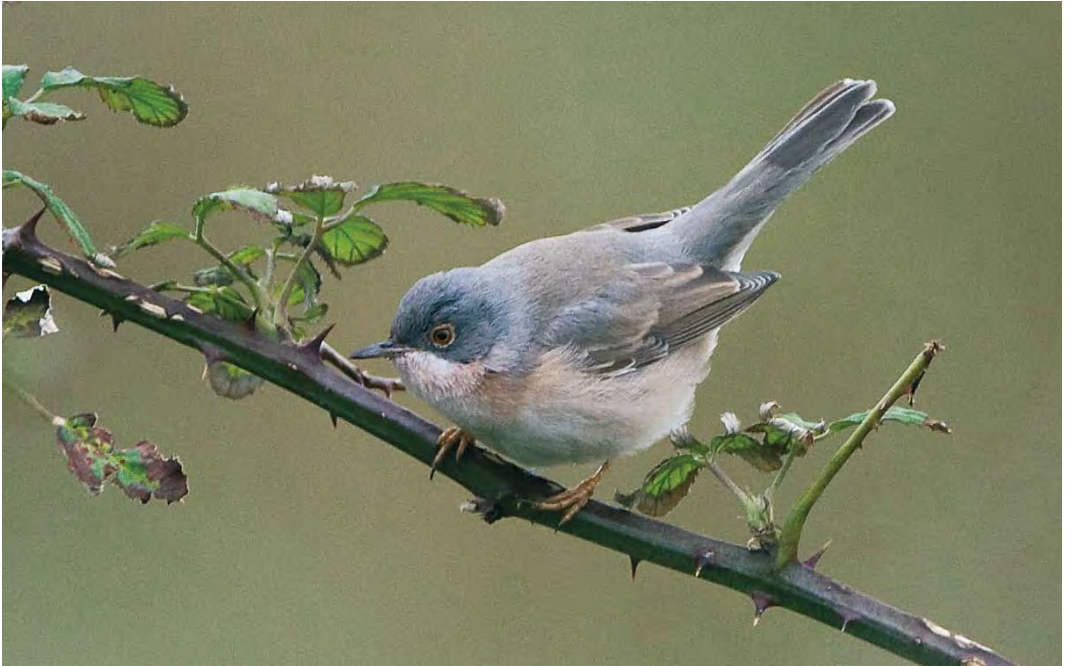
515 Moltoni's Warbler / Moltoni's Beardgrasmus Sylvia subalpina , Helgoland, Schleswig-Holstein, Germany, 11 October 2009