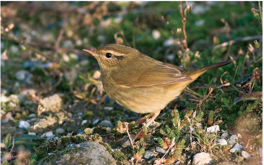
512 Radde's Warbler / Raddes Boszanger Phylloscopus schwarzi , Zeebrugge, West-Vlaanderen, Belgium, 22 October 2009 (Raphaël Lebrun)