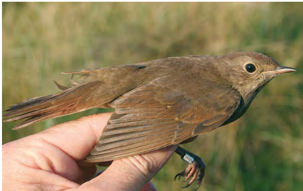
453 Thrush Nightingale / Noordse Nachtegaal Luscinia luscinia , Noordhollands Duinreservaat, Castricum, Noord-Holland, 31 August 2009