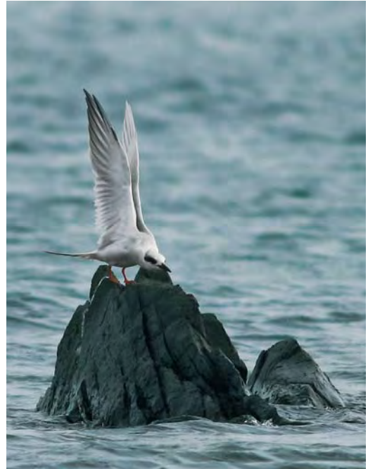
501 Forster's Tern / Forsters Stern Sterna forsteri , Cruisetown Strand, Louth, Ireland, 19 October 2009