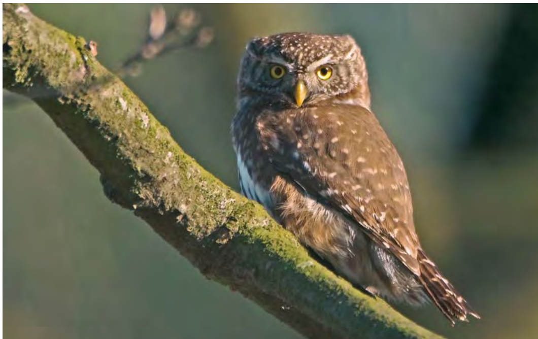
449 Eurasian Pygmy Owl / Dwerguil Glaucidium passerinum , Leenderbos, Noord-Brabant, 11 February 2008 (Jan-Kees Schwiebbe)