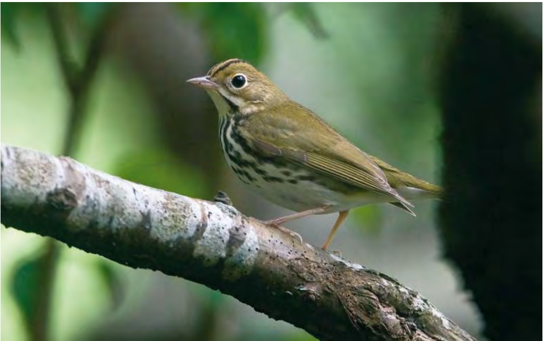
532 Ovenbird / Ovenvogel Seiurus aurocapilla , Corvo, Azores, 10 October 2009 (Rafael Armada)