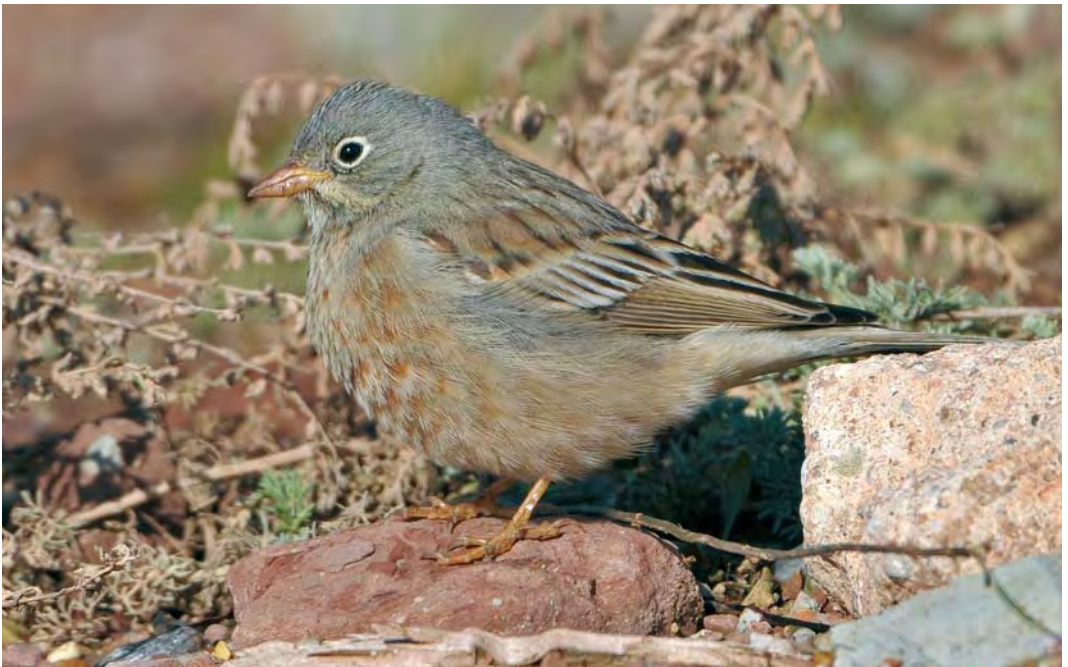
516 Grey-necked Bunting / Steenortolaan Emberiza buchanani , Helgoland, Schleswig-Holstein, Germany, 13 October 2009 (Gabriël Schuler)