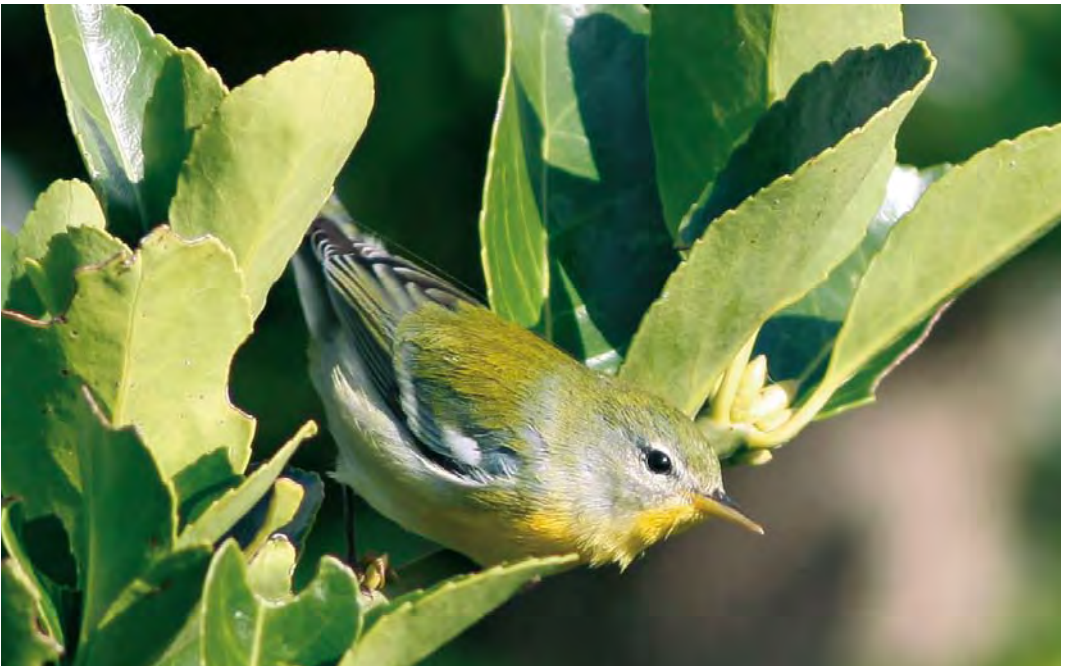
530 Northern Parula / Brilparulazanger Parula americana , Île de Sein, Finistère, France, 23 October 2009 (Julien Renoult)