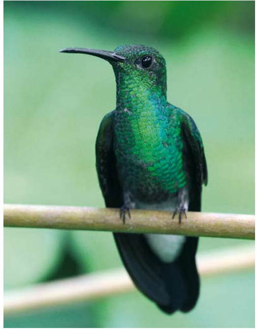
354 Green-crowned Brilliant / Groenkruinbriljantkolibrie Heliodoxa jacula , Los Quetzales, Chiriquí, Panama, 11 March 2009 (Roef Mulder) 355 White-vented Plumbeater / Buffons Pluimkolibrie Chalybura buffoni , Forest Discovery Center, Panama, 13 June 2009 (Roef Mulder) 356 Violet-crowned Woodnymph / Paarskroonbosnif Thalurania colombica , female, Forest Discovery Center, Panama, 13 June 2009 (Roef Mulder)