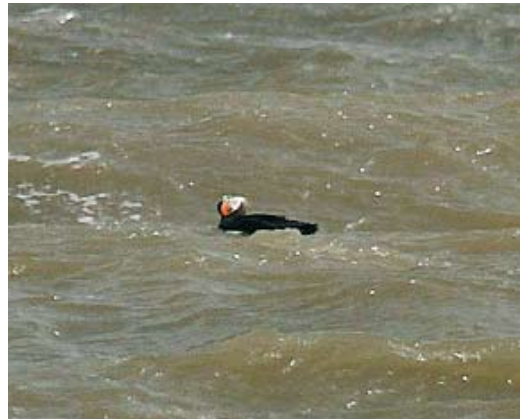
411-412 American Black Tern / Amerikaanse Zwarte Stern Chlidonias niger surinamensis , first-year, Farmoor Reservoir, Oxfordshire, England, 1 September 2009 (Mike Lawrence) 413-414 Tufted Puffin / Kuifpapegaaiduiker Fratercula cirrhata , Swale Estuary, Kent, England, 16 September 2009 (Murray Wright)

In England, a juvenile American Black Tern Chlidonias niger surinamensis remained at Farmoor Reservoir, Oxfordshire, from 28 August to 3 September, together with a juvenile Black Tern C. n. niger and a juvenile White-winged Tern C. leucopterus . Previous records include singles in Dublin, Ireland, and Somerset, England, in October 1999 and in Outer Hebrides in November 2008. In the Azores, a first-year American Black stayed at Cabrito reservoir, Terceira, from 11 September. On 24 August and 7 September, respectively, 575 and 550 Roseate Terns Sterna dougallii were counted at the roost of Sandymount Strand, Dublin. The fourth Black Guillemot Cephus grylle for Spain was a first-winter at Ría de la Villa from 31 August to at least 5 September. An adult Tufted Puffin Fratercula cirrhata swimming for 15 min less than 80 m from the shore of Oare Marshes along the Swale Estuary, Kent, on 16 September was the first for Britain and the second for the WP (the first was in Sweden in June 1994); it flew off and landed to swim for another 5 min within view before it flew off west not to be seen again.