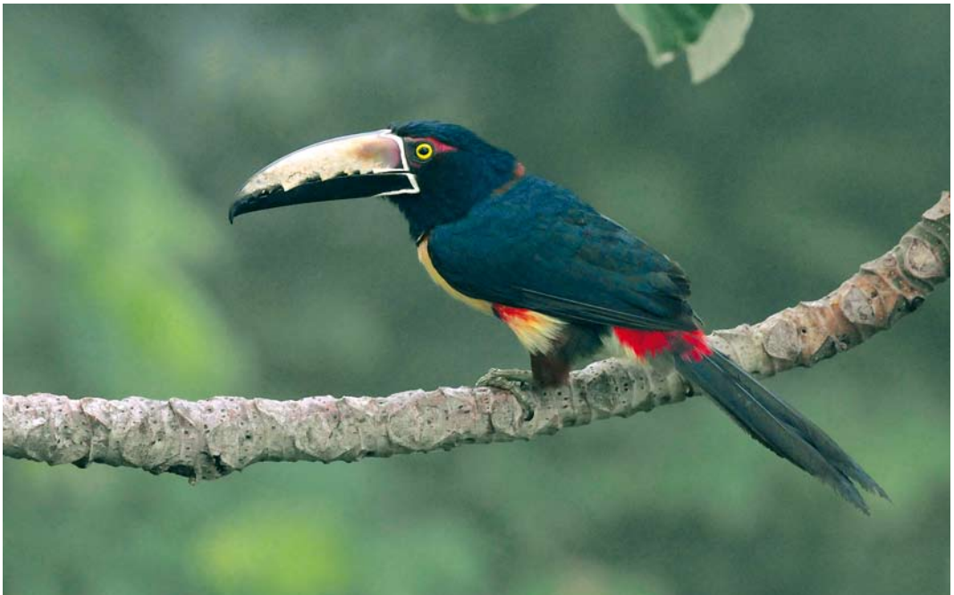
370 Collared Aracari / Halsbandarassari Pteroglossus torquatus , Canopy Tower, Soberanía National Park, Panama, 11 June 2009 (Roef Mulder)