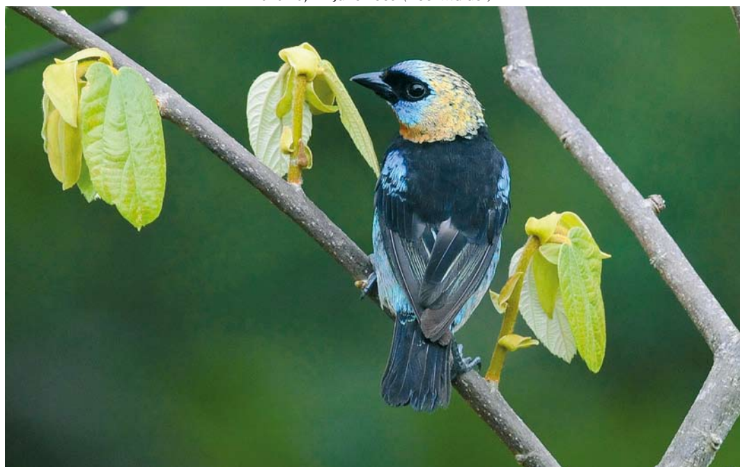
364 Golden-hooded Tanager / Purpermaskertangare Tangara larvata , Canopy Tower, Soberanía National Park, Panama, 11 June 2009 (Roef Mulder)