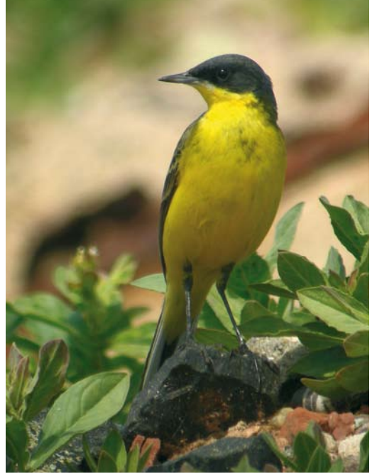
246 Noordse Kwikstaart / Grey-headed Wagtail Motacilla thunbergi , mannetje / male, Helgoland, Duitsland, 30 mei 2008 (Roy Slaterus). Typisch exemplaar zonder sporen van witte wenkbrauwstreep en met donkere vlekken op borst / Typical male, without trace of white supercilium and with obvious breast markings.

KOP & HALS Voorhoofd, kruin, achterhoofd en achterhals grijs, donkerder dan bij mannetje Gele Kwikstaart en blauwe tint minder opvallend. Middenkruinveren met groenachtige top. Zijkruin grijsgroen zoals bovendelen. Zijkruin boven oog donkergrijs tot zwart, net als teugel en voorste deel van oorstreek. Achterste deel van oorstreek iets lichter grijs. Smalle witachtige wenkbrauwstreep uitsluitend achter oog. Lichtgrijs vlekje boven teugel (op rechterkant van kop nagenoeg afwezig); na enkele weken nagenoeg verdwenen door sleet. Oogring grijs en onopvallend, midden onder oog iets lichter. Kin wit. Keel heldergeel.