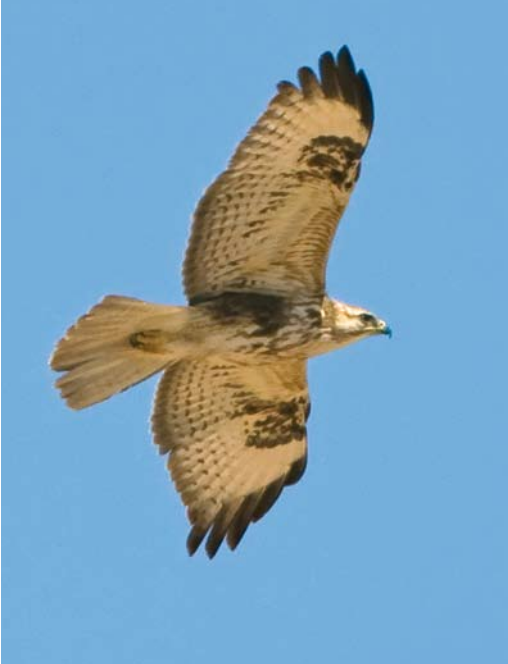
265 Atlas Long-legged Buzzard / Atlasarendbuizerd Buteo rufinus cirtensis , juvenile, between Goulmime and Atlantic coast, Morocco, 20 March 2008 (Pieter Verheij). Note strong similarities with Pantelleria hybrid but also more marked and obvious dark carpal patch, warmer tone of flank, paler and less barred tail, and less patterned underwing-coverts.

was paired and seen copulating regularly with a different second calendar-year cirtensis . Moreover, an adult male cirtensis paired with an adult female nominate buteo was seen copulating regularly and starting to breed. The increase of mixed pairs will probably lead to an increasing number