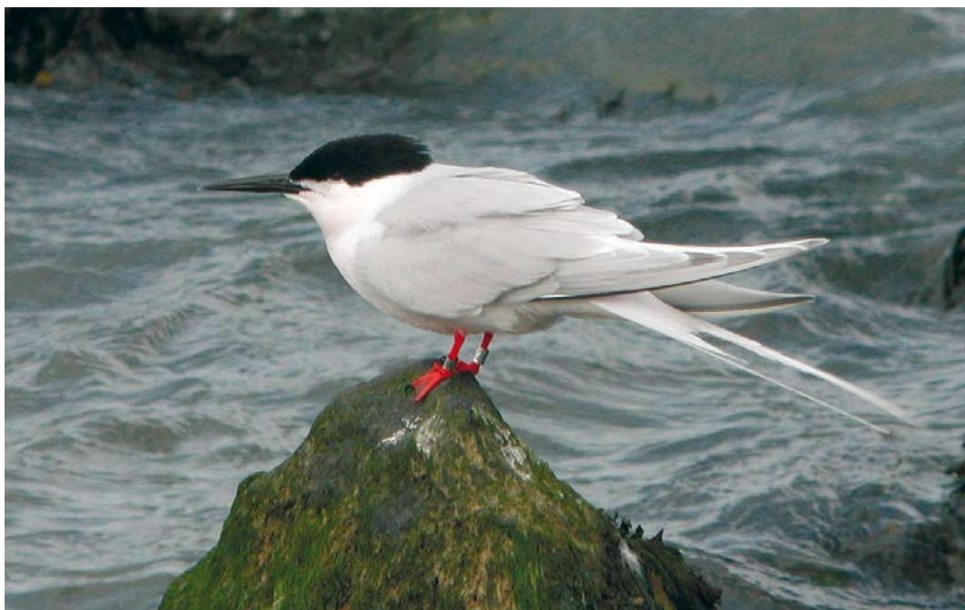
320 Groene Reiger / Green Heron Butorides virescens , adult, Zaandam, Noord-Holland, 4 juli 2009 321 Dougalls Stern / Roseate Tern Sterna dougallii , adult, Stellendam, Zuid-Holland, 7 mei 2009