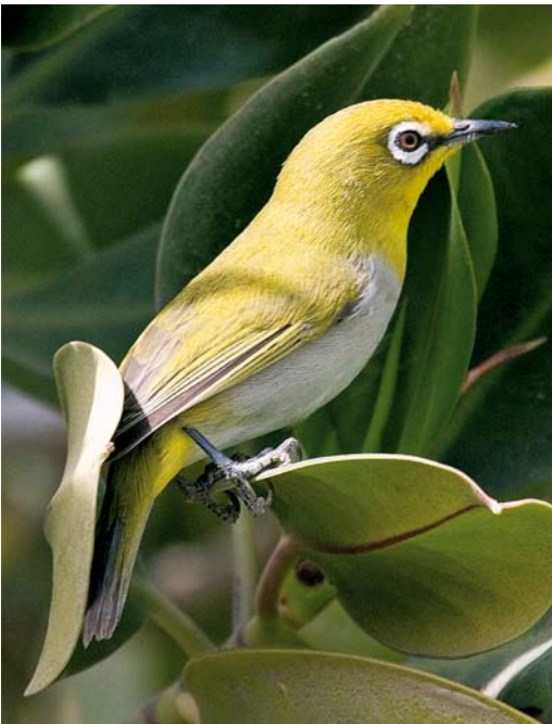
269 Oriental White-eye / Indische Brilvogel Zosterops palpebrosus , Koor-e Azini, Hormozgan, Iran, 3 March 2009 (Maysam Ghasemi)