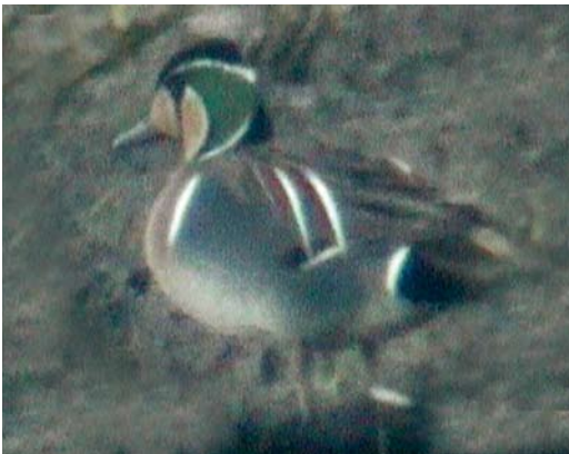
266 Siberische Taling / Baikal Teal Anas formosa , adult mannetje, Ouderkerk aan de Amstel, Noord-Holland, 18 mei 2006 (Leon Edelaar)