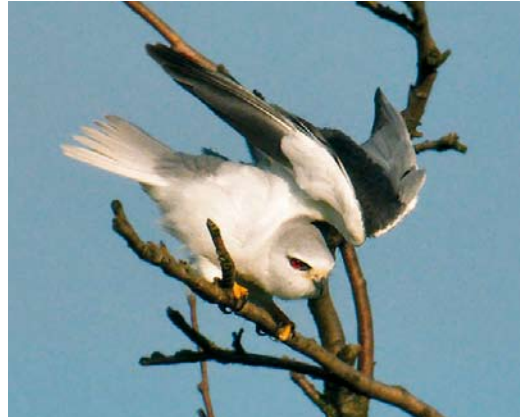
334-335 Grijze Wouw / Black-winged Kite Elanus caeruleus , Bleskensgraaf, Zuid-Holland, 22 mei 2009

the Netherlands. When found it was hunting but soon it perched in a bare tree. It was seen by almost 30 birders. Eventually, it was disturbed by a Carrion Crow Corvus corone and it flew away in a south-westerly direction. There are three previous records for the Netherlands: on 31 May 1971, on 29-31 March 1998 and from 4 June to 23 August 2000.