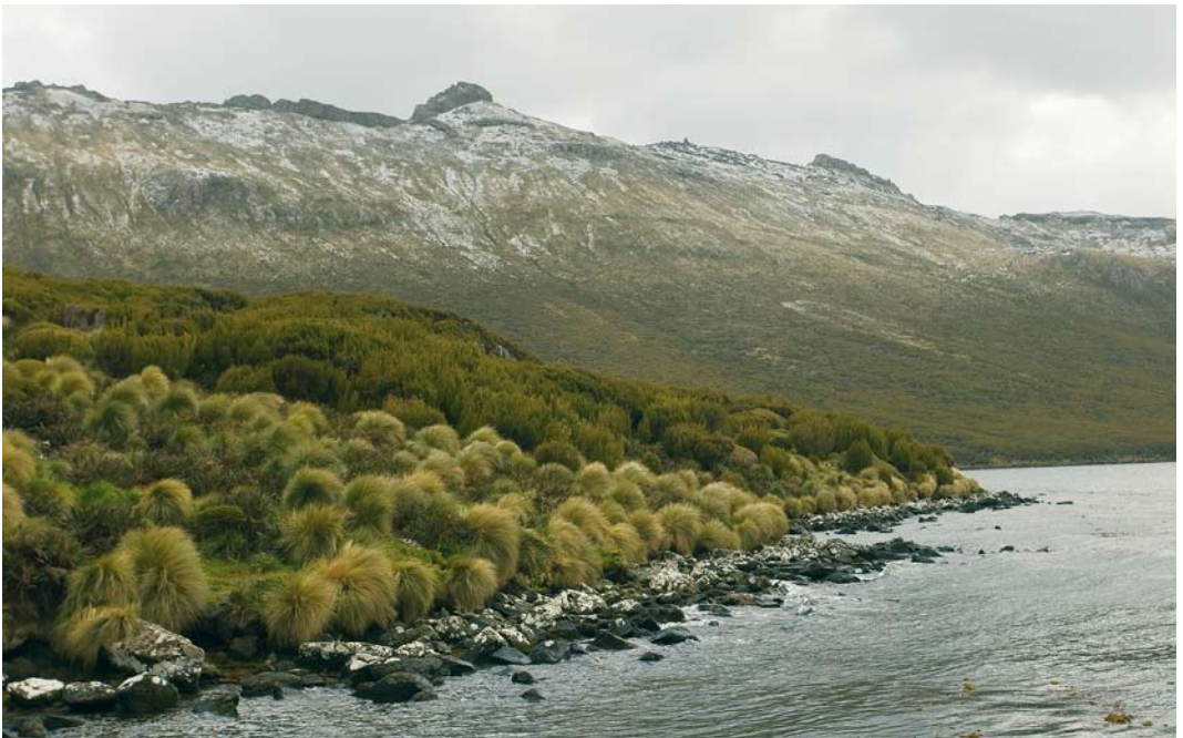
272 Tussock on Campbell Island, New Zealand, 18 November 2008