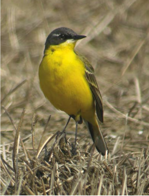
245 Noordse Kwikstaart / Grey-headed Wagtail Motacilla thunbergi of hybride / or hybrid, mannetje / male, Spaarndam, Noord-Holland, 3 mei 2008 (Roy Slaterus). Relatief brede wenkbrauwstreep (voor Noordse), gedeeltelijk witachtige oogring en beperkte mate van borsttekening duiden mogelijk op hybride / Rather broad supercilium (for Grey-headed), pale lower part of eye-ring and relatively few dark spots on breast may indicate hybrid origin.