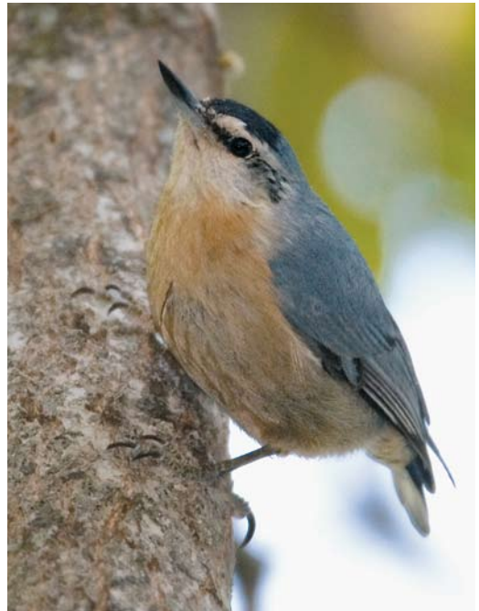
300 Algerian Nuthatch / Algerijnse Boomklever Sitta ledanti , male, Tamentout forest, Petit Kabylie, Algeria, 4 June 2009 (David Monticelli) 301 Algerian Nuthatch / Algerijnse Boomklever Sitta ledanti , male, Tamentout forest, Petit Kabylie, Algeria, 5 June 2009 (Vincent Legrand) 302 Algerian Nuthatch / Algerijnse Boomklever Sitta ledanti , male, Djebel Babor, Petit Kabylie, Algeria, 2 June 2009 (Vincent Legrand) 303 Algerian Nuthatch Sitta ledanti , male, Djebel Babor, Petit Kabylie, Algeria, 2 June 2009 (Vincent Legrand). Note that plate 300-303 depict four different males.

Algiers had been scheduled for Sunday 31 May 2009. Upon arrival at Algiers, where we had to connect with our domestic flight to Constantine, our luggage was scanned by customs and stopped. DM's bag contained two pairs of binoculars, which are still not allowed for foreigners entering the country. We were aware of this problem before