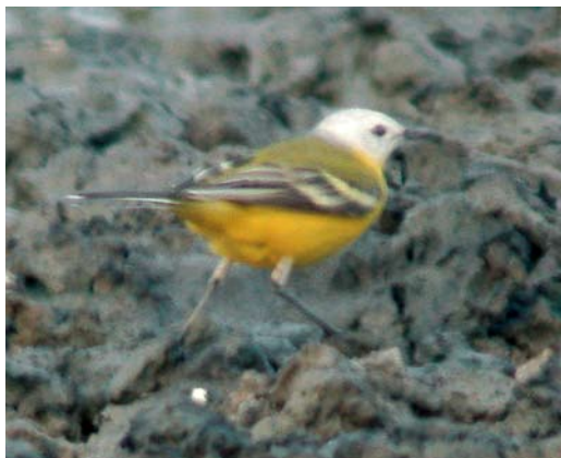
115 White-headed Wagtail / Witkopkwikstaart Motacilla leucocephala , male, Kolshengel, Taukum desert, Almaty province, Kazakhstan, 10 May 2007 (Rob Bouwman)