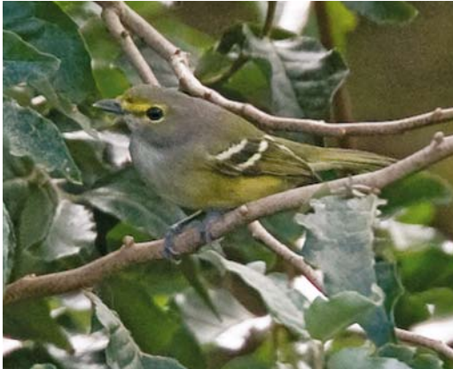
523 White-eyed Vireo / Witoogvireo Vireo griseus , Corvo, Azores, 24 October 2008