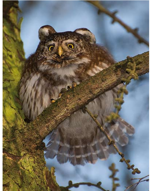
476 Dwerguil / Eurasian Pygmy Owl Glaucidium passerinum , Valkenswaard, Noord-Brabant, 11 februari 2008 (Arnoud B van den Berg)

De periode 2004-08 was lijsttechnisch interessant omdat er diverse soorten niet of beperkt werden gezien door de toplijsters. Absolute blockers als Grijsze Gors, Steenortolaan en Huisgierzwaluw werden alleen door vogelaars gezien die hun lijst niet bijhouden op de