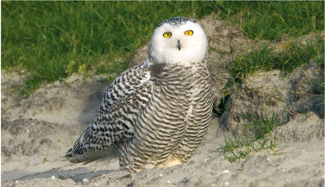
544 Sneeuwuil / Snowy Owl Bubo scandiacus , eerstejaars, Texel, Noord-Holland, 17 november 2008

gens lastig om de aanwezigheid van ringen met zekerheid uit te sluiten.