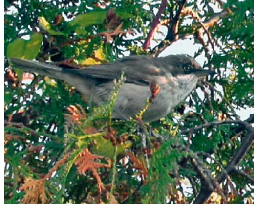
30 Westelijke Orpheusgrasmus / Western Orphean Warbler Sylvia hortensis , Middelburg, Zeeland, oktober 2003

slapen waardoor hij de volgende dag vrij snel werd teruggevonden. Met uitzondering van zondag 2 november, toen het slechte weer en de slechte toegankelijkheid van de bedrijvenavels de waarnemers parten speelden, werd hij tot en met 5 november dagelijks en door vele waarnemers gezien (Wolf 2003).