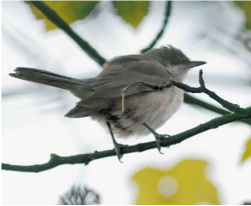
29 Westelijke Orpheusgrasmus / Western Orphean Warbler Sylvia hortensis , Middelburg, Zeeland, 30 oktober 2003 (Patrick Palmen)