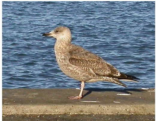
14-15 Probable Herring Gull / waarschijnlijke Zilvermeeuw Larus argentatus , first-year, Hirtshals Havn, Nordjylland, Denmark, 25 February 2004. Bird with largely dark tail and densely barred upper- and undertail-coverts. Note surprisingly dark longest two undertail-coverts in plate 15. See also plate 16-17, depicting same bird. Feathers of this bird have been taken for DNA sampling. 16-17 Probable Herring Gull / waarschijnlijke Zilvermeeuw Larus argentatus , first-year, Hirtshals Havn, Nordjylland, Denmark, 17 February 2004. Same bird as in plate 14-15. Underparts paler and more clearly streaked than in typical Smithsonian Gull L. smithsonianus . In addition, new greyish scapulars looking slightly darker than usual in that species, while upper flank-feathers look rather too pale.

undertail-coverts seen in some smithsonianus are usually not present in argentatus (but see plate 15). Also, in first-year smithsonianus , the vent is often as boldly and densely marked as the undertail-coverts, especially along the sides, the pattern connecting clearly with the brown belly. In argentatus , strong, continuous barring on the vent occurs but is only rarely seen (and is often separated from the dark markings on the underparts by a pale central belly and rear flank).