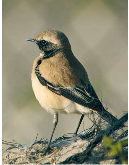
74 Grote Kruisbek / Parrot Crossbill Loxia pytyopsittacus , mannetje, Schoorl, Noord-Holland, 26 december 2007 75 Woestijntapuit / Desert Wheatear Oenanthe deserti , eerstejaars mannetje, Maasvlakte, Zuid-Holland, 12 november 2007 76 Grote Kruisbek / Parrot Crossbill Loxia pytyopsittacus , mannetje, Oud-Leusden, Utrecht, 30 december 2007