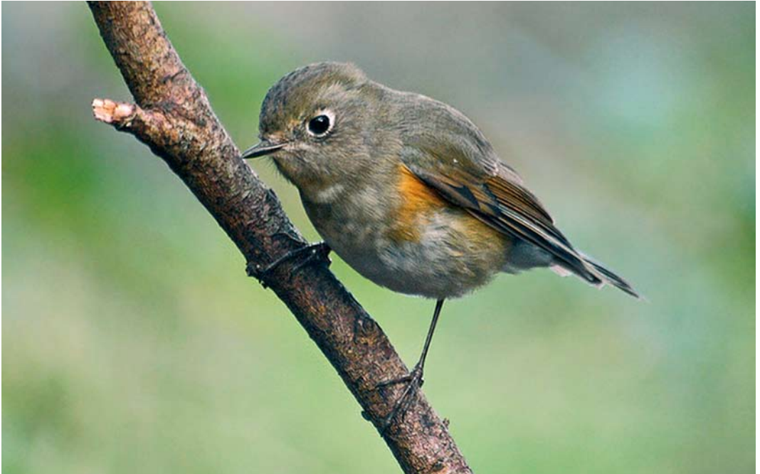
56 Red-flanked Bluetail / Blauwstaart Tarsiger cyanurus , Ouessant, Finistère, France, 17 November 2007 (Corentin Kermarrec)