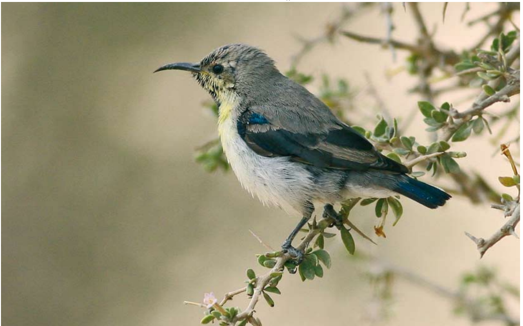
57 Purple Sunbird / Purperhoningzuiger Cinnyris asiaticus , Subiya, Kuwait, 10 January 2008 (Rashed Al-Hajji)