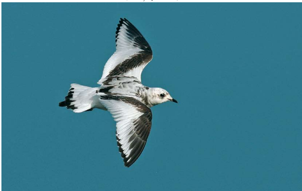
49 Ross's Gull / Ross' Meeuw Rhodostethia rosea , first-year, Douarnenez, Finistère, France, 1 January 2008 ( Thierry Queennec )