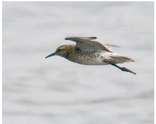
419 Black-winged Pratincole / Steppeworkstaartplevier Glaucola nordmanni , Segerstads fyr, Öland, Sweden, 25 August 2008 ( Christian Cederroth ) 420 Purple Sandpiper Calidris maritima , Longyearbyen, Svalbard, 25 May 2008 ( Edwin Winkel ) 421 Red-necked Stint / Roodkeelstrandloper Calidris ruficollis , Treguéllier, Finistère, France, 3 August 2008 ( Xavier Rozec ) 422 Western Sandpiper / Alaskastrandloper Calidris mauri , Olmex, Galway, Ireland, 13 September 2008 ( Michael Davis ) 423-424 Sharp-tailed Sandpiper / Siberische Strandloper Calidris acuminata , Segerstads fyr, Öland, Sweden, 7 August 2008 ( Christian Cederroth )