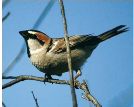
385-386 Saxaul Sparrow / Saxaulmus Passer ammodendri, male, near Sarakhs, Khorassan, Iran, 27 April 2004