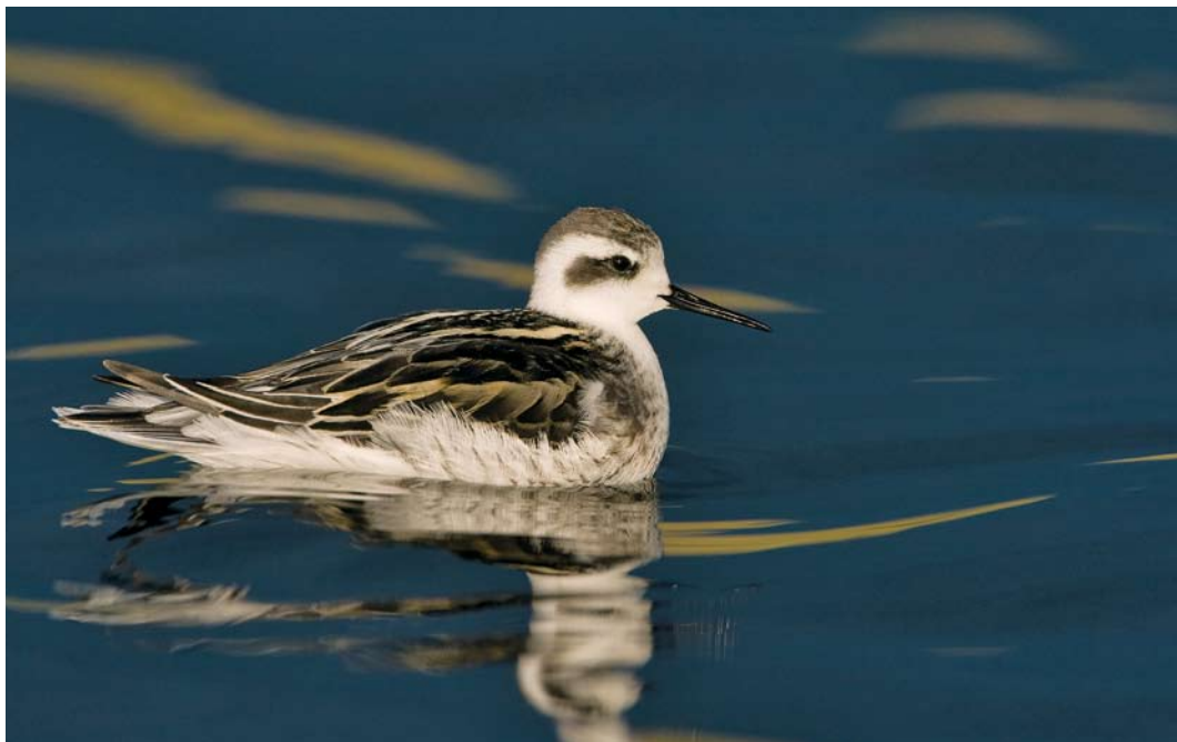
434 Grauwe Franjepoot / Red-necked Phalarope Phalaropus lobatus , juveniel, Terschelling, Friesland, 11 september 2008