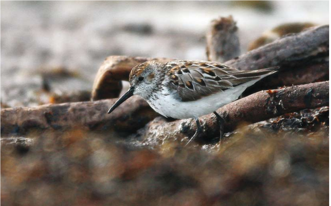
411 Western Sandpiper / Alaskastrandloper Calidris mauri , adult, Klepp, Rogaland, Norway, 13 July 2008 (Christian Tiller) cf Dutch Birding 30: 263, 2008