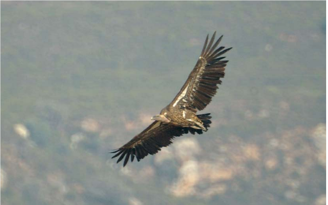
408 Rüppell's Vulture / Ruppells Gier Gyps rueppellii , Tarifa, Spain, 28 August 2008