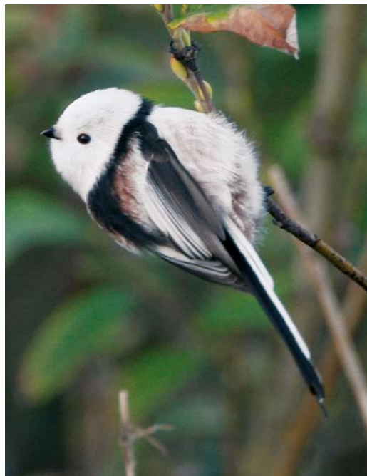
364 White-headed Long-tailed Bushtit / Witkopstaartmees Aegithalos caudatus caudatus , Helgoland, Schleswig-Holstein, Germany, 12 October 2007. Classic nominate caudatus .

europaeus groups, like aremoricus , macedonicus , rosaceus and italiae , a breast-band is usually present. As many intermediate birds also lack a breast-band, it is not a reliable feature to separate caudatus .