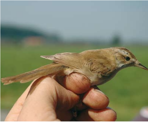
447 Velddrietzanger / Paddyfield Warbler Acrocephalus agricola , Kommer, Oost-Vlaanderen, 31 augustus 2008 (Miguel Demeulemeester)