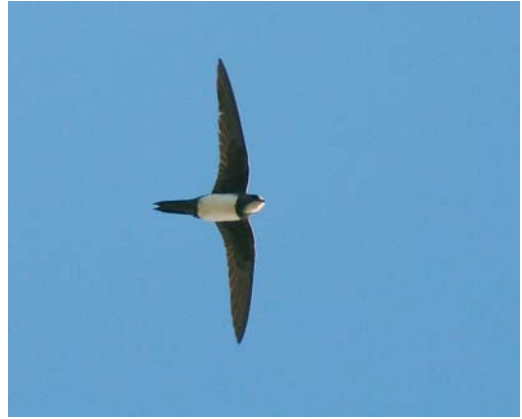
448 Alpengierzwaluw / Alpine Swift Apus melba , Zeebrugge, West-Vlaanderen, 9 mei 2008 (Johan Buckens) cf Dutch Birding 30: 288, 2008

Vorkstaartmeeuwen Xema sabini langs Oostende en één langs De Panne. Reuzensterms Hydroprogne caspia werden waargenomen te Lier-Anderstad op 24 en 30 juli; op de Kraenepoel in Aalter, Oost-Vlaanderen, op 25 juli (vier); in de Bourgoyen bij Gent (twee op 29 en één op 31 juli); op De Kuifeend in Oorderen, Antwerpen, op 5 augustus; bij Mol, Antwerpen, op 9 augustus; en in de IJzermonding in Nieuwpoort op 29 augustus. Een adulte Witwangstern Chlidonias hybrida in zomerkleed verbleef op 5 en 6 juli bij Harchies. Op 28 juli en op 31 augustus pleisterde telkens één adulte Witvleugelstern C leucopterus in de Uiterwaarden bij Kessenich.