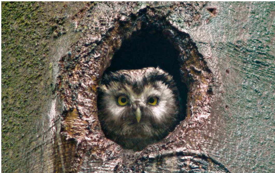
380 Ruigpootuil / Boreal Owl Aegolius funereus , adult, Schoonloo, Drenthe, 22 juni 2008. Dit exemplaar was sterk aan het nesthol (nest 2) gebonden.