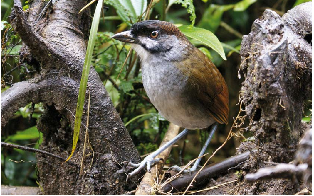
388-389 Jocotoco Antpitta / Jocotocomierpitta Grallaria ridgelyi , Reserva Tapichalaca, Ecuador, 8 December 2007