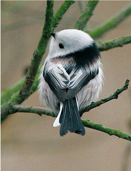
365 White-headed Long-tailed Bushtit / Witkopstaartmees Aegithalos caudatus caudatus , Makkum, Friesland, Netherlands, 29 November 2003

variably coloured. According to Cramp & Perrins (1993), ' sibiricus ' has whiter tertials than caudatus . However, many caudatus from Fennoscandia also show much white on the tertials. It can be concluded that the amount of white on the tertials is not a reliable feature in itself but can be used as a supportive character.