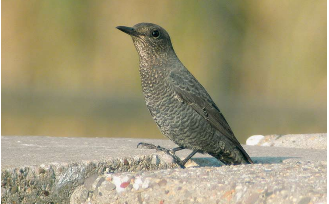
398 Blauwe Rotslijster / Blue Rock Thrush Monticola solitarius , mannetje, Westkapelle, Zeeland, 20 september 2003