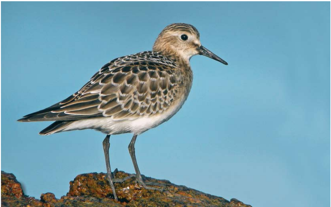
410 Baird's Sandpiper / Bairds Strandloper Calidris bairdii , juvenile, Ouessant, Finistère, France, 13 September 2008