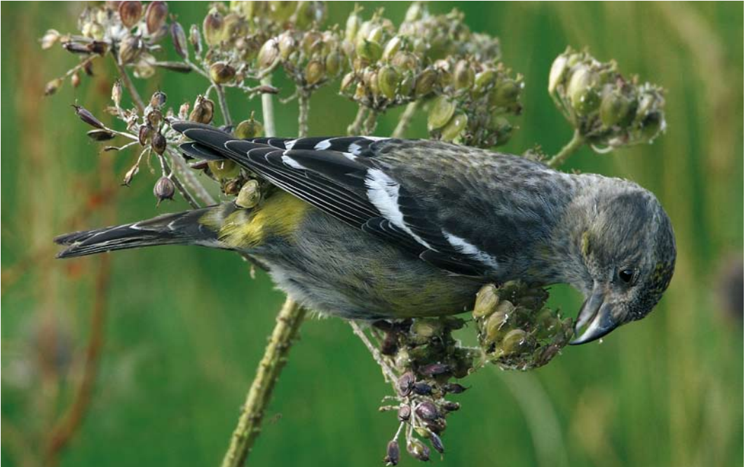
432 Two-barred Crossbill / Witbandkruisbek Loxia leucoptera , female, Sandgarth, Mainland, Shetland, Scotland, 28 July 2008