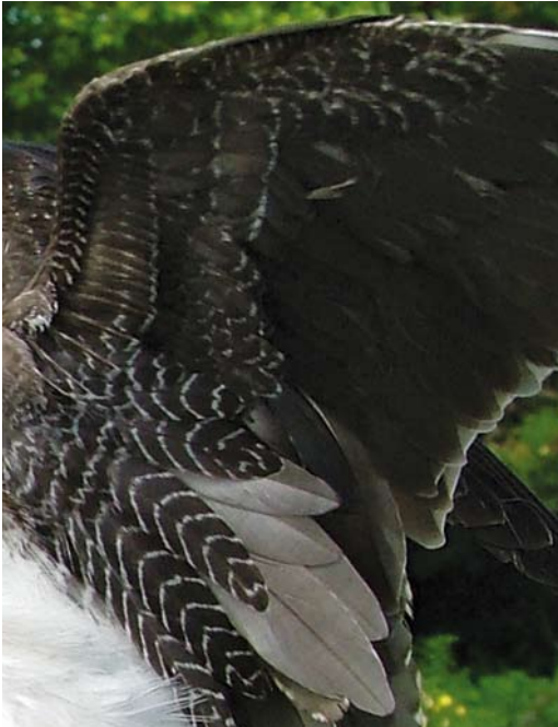
403 Mystery photograph IX (August)