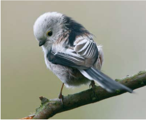
374 Central European Long-tailed Bushtit / Staartmees Aegithalos caudatus europaeus , Leiden, Zuid-Holland, Netherlands, 8 March 2007 ( Herman Berkhoudt ). Same bird as plate 372. Note whitish tertials more typical of caudatus .