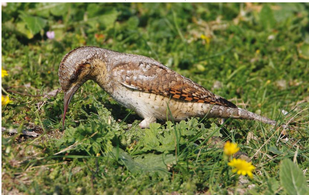
435 Draaihals / Eurasian Wryneck Jynx torquilla , Maasvlakte, Zuid-Holland, 30 augustus 2008