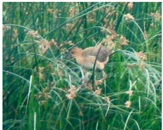
413-414 Lesser Frigatebird / Kleine Fregatvogel Fregata ariel , Zour port, Kuwait, 10 April 2008 ( Lee Gregory ) cf Dutch Birding 30: 188, 2008 415 Balearic Shearwater / Vale Pijlstormvogel Puffinus mauretanicus , North Sea off Schleswig-Holstein, Germany, 16 August 2008 ( Martin Gottschling ) 416 Bridled Tern / Brilstern Onychoprion anaethetus , adult, Nachlieli islet, western Galilee, Israel, 20 August 2008 ( Mia Elasar ) 417 Allen's Gallinule / Afrikaans Purperhoen Porphyrio alleni , Aiguamolls de l'Empordà, Catalunya, Spain, 13 August 2008 ( Ponç Feliu ) 418 Allen's Gallinule / Afrikaans Purperhoen Porphyrio alleni , Aiguamolls de l'Empordà, Catalunya, Spain, August 2008 ( Jordi Martí-Aledo )