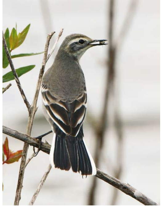
428 Northern Waterthrush / Noordse Waterlijster Seiurus noveboracensis , Cape Clear, Cork, Ireland, 27 August 2008 (Lee Gregory) 429 Citrine Wagtail / Citroenkwikstaart Motacilla citreola , first-year, Ooijpolder, Gelderland, Netherlands, 25 August 2008 (Michel Veldt) 430 Yellow Warbler / Gele Zanger Dendroica petechia , Cape Clear, Cork, Ireland, 28 August 2008 (Lee Gregory)