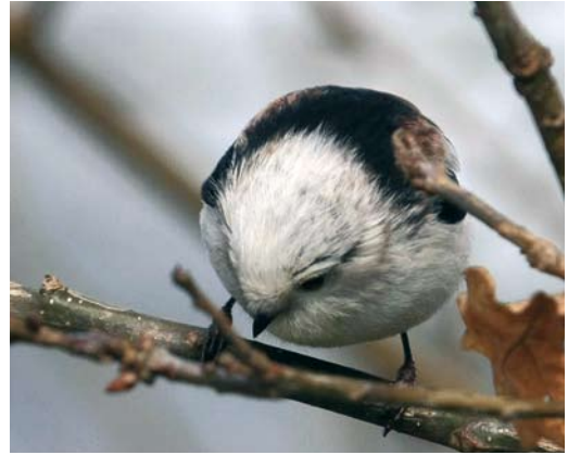
375 Central European Long-tailed Bushtit / Staartmees Aegithalos caudatus europaeus , Stuw Hankate Hellendoorn, Overijssel, Netherlands, 28 March 2008 ( Gerrit Schepers ). Intermediate bird. Note brownish spot on neck-side and scattered darker spots on crown and nape.

Tynemouth, Northumberland, in November 1852, now at Hancock Museum (Witherby et al 1938, Galloway & Meek 1978); 2 up to six birds at Westleton Heath and Minsmere RSPB Reserve, Suffolk, from 25 January to 25 February 2004 (Small 2004); and 3 up to three birds at Lewes, Sussex, from 26 January to 17 February 2004 (Cooper et al 2004, Evans 2004). Photographs support the latter two records.