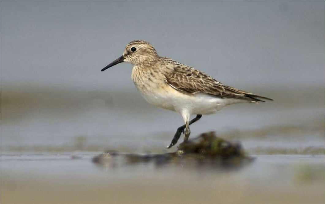
397 Bairds Strandloper / Baird's Sandpiper Calidris bairdii , adult, De Cocksdorp, Texel, Noord-Holland, 8 augustus 2003 (René Pop)