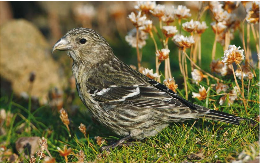
433 Two-barred Crossbill / Witbandkruisbek Loxia leucoptera , juvenile, Eshaness, Mainland, Shetland, Scotland, 31 July 2008 (Hugh Harrop)