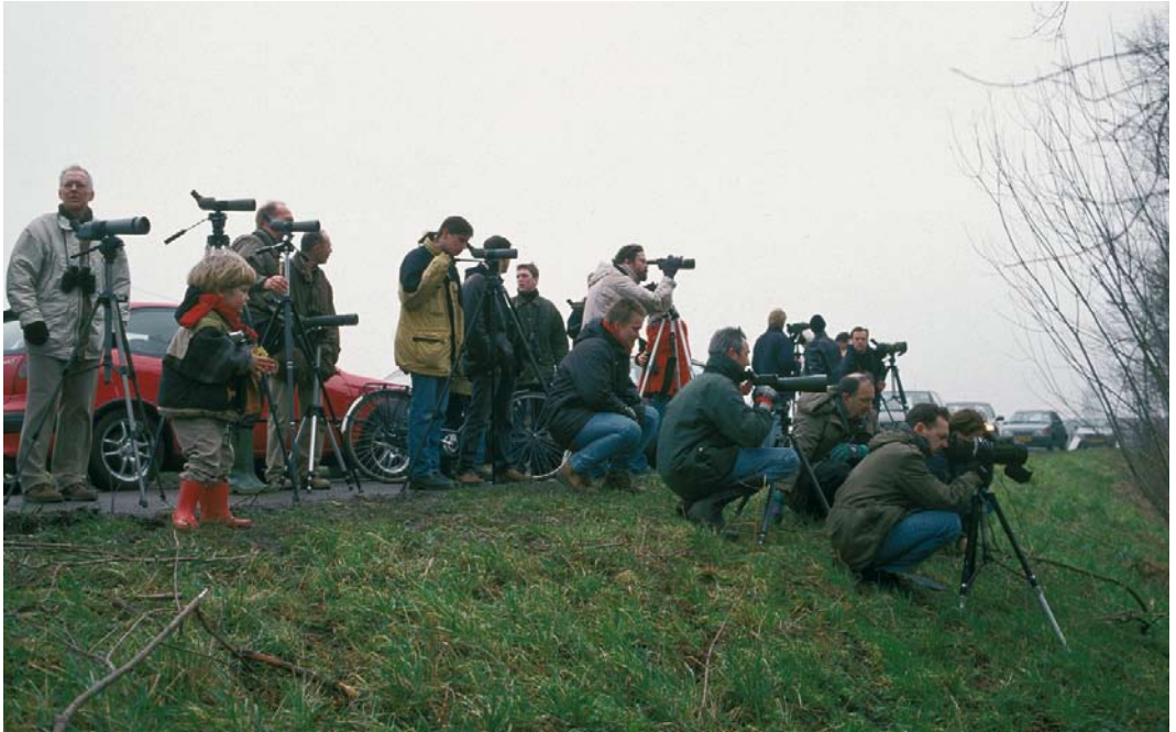
392 Vogelaars bij Dwergaalscholver / birders at Pygmy Cormorant Phalacrocorax pygmeus , Montfoort, Utrecht, 24 januari 1999. Herkenbaar (rechts) onder anderen / recognizable (at right) amongst others: André van Loon (staand) en Jan Vanwynsberghe, Klaas Eigenhuis en Gerald Driessens (zittend) 393 Ferry Ossendorp bij plaatselijke snackbar / at local snackbar (with 'French fries Black-winged Kite' sign), Zwartemeer, Drenthe, 2 juli 2000