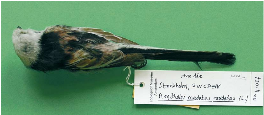
358 White-headed Long-tailed Bushtit / Witkopstaartmees Aegithalos caudatus caudatus , female (collected at Leiden, Zuid-Holland, Netherlands, on 1 November 1859; RMNH 130.852), Nationaal Natuurhistorisch Museum/Naturalis, Leiden, 27 January 2006. Note that this specimen was labelled as europaeus . However, it shows all characters of caudatus , the dark smudges on the head being dirt. 359 White-headed Long-tailed Bushtit / Witkopstaartmees Aegithalos caudatus caudatus (collected at Stockholm, Sweden, without date; ZMA 41027), Zoologisch Museum Amsterdam, Amsterdam, Noord-Holland, Netherlands, 6 March 2003. Note dark tertials with very limited pale fringes, indicating variability of this character in this taxon.

Only adult-type birds were taken into account, ie, adult birds and first-year birds that, from September onwards, had finished their (complete) post-juvenile moult (cf Svensson 1992). Identification in non-adult plumage, if possible at all, is beyond the scope of this paper. Excluded from the research were partially white birds (like, for instance, a bird observed in the autumn of 2003 at Stiffkey, Norfolk, England, with a white head, white tail and other anomalous white patches; Richard Millington in litt).