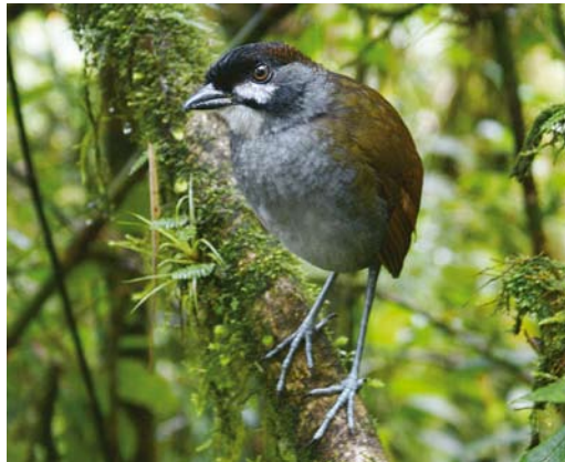
387 Jocotoco Antpitta / Jocotocomierpitta Grallaria ridgelyi , Reserva Tapichalaca, Ecuador, 13 December 2007

Until recently, it was very exceptional to see – not to mention photograph – Jocotoco Antpittas. Twitchers occasionally watched them by using tape playback but the birds' responses seemed to wane by time as in other antpittas. All this changed thanks to Angel Paz, a local farm-