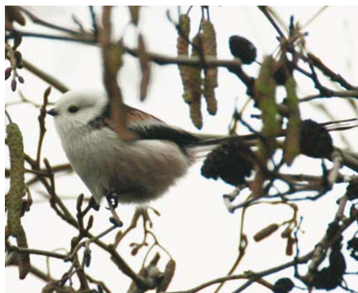
366 White-headed Long-tailed Bushtit / Witkopstaartmees Aegithalos caudatus caudatus (right), with Central European Long-tailed Bushtit / Staartmees A. c. europaeus , Oostvaardersdijk, Lelystad, Flevoland, Netherlands, 7 January 2002 367 White-headed Long-tailed Bushtit / Witkopstaartmees Aegithalos caudatus caudatus , Kop Afsluitdijk, Friesland, Netherlands, 25 October 2003 368 White-headed Long-tailed Bushtit / Witkopstaartmees Aegithalos caudatus caudatus , Arnhem, Gelderland, Netherlands, 27 February 2004 369 White-headed Long-tailed Bushtit / Witkopstaartmees Aegithalos caudatus caudatus , Katwijk aan Zee, Zuid-Holland, Netherlands, 6 February 2004

Schiernonnikoog, Friesland, on 19 November 2005; Henri Bouwmeester in litt; www.ringstationkamperhoek.ampe.nl ) but these also lack detailed documentation (only poor quality photographs) to safely establish the subspecific identity.