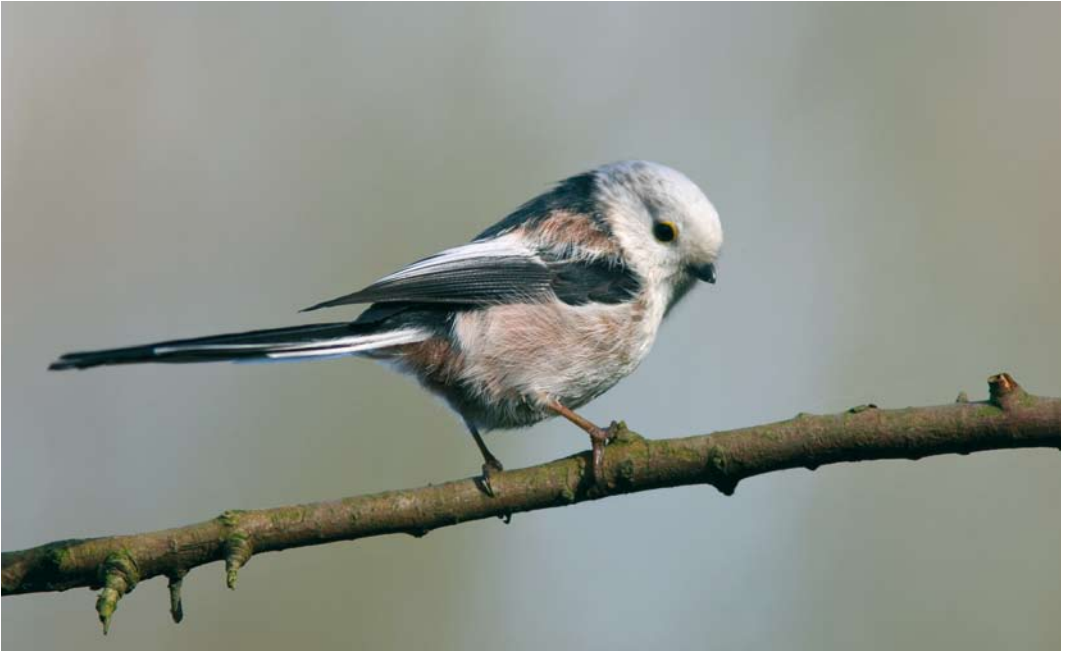
372 Central European Long-tailed Bushtit / Staartmees Aegithalos caudatus europaeus , Leiden, Zuid-Holland, Netherlands, 8 March 2007 ( Herman Berkhoudt ). Intermediate bird. Note limited dark streaking behind eye and indication of breast-band, indicating europaeus . Sharply defined black neck-band more typical for caudatus . 373 Central European Long-tailed Bushtit / Staartmees Aegithalos caudatus europaeus , adult, Melven, Veghel, Noord-Brabant, Netherlands, 14 March 2008 ( Toy Janssen ). Intermediate bird. Head looking almost pure white but still showing some darker spots; black neck-band not sharply defined.