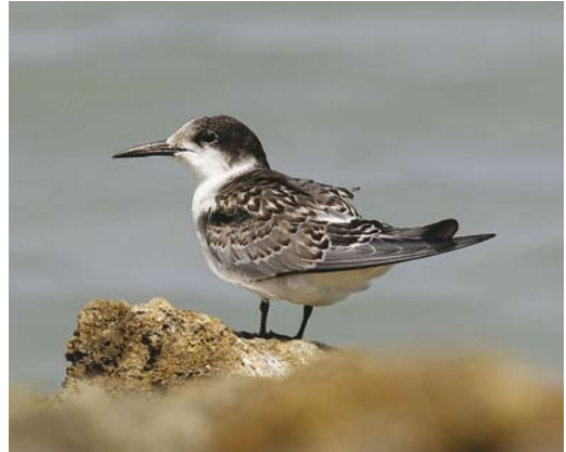
402 White-cheeked Tern / Arabische Stern Sterna repressa , Red Sea, Egypt, 9 October 2007 (Edwin Winkel). Note dark overall impression, boldly marked tertials and absence of white trailing edge across primary inner webs.

The white trailing-edge to the wing easily excludes the marsh terns Chlidonias , of which Whiskered Tern C hybrida was mentioned by 4% of the entrants. Juveniles of several species show tertials and median wing-coverts as heavily and boldly marked as the mystery bird. These include Little Sternula albifrons (not mentioned as solution), Sandwich Sterna sandvicensis (16%), White-cheeked S repressa (24%) and Roseate Tern S dougalli (4%). Although many other tern species show dark tertials, these are generally differently patterned, showing only a dark centre and a pale fringe, unlike the mystery bird. Another striking feature of the mystery bird, the dark central rump, can be found to some extent on quite a number of species, including Aleutian Onychoprion