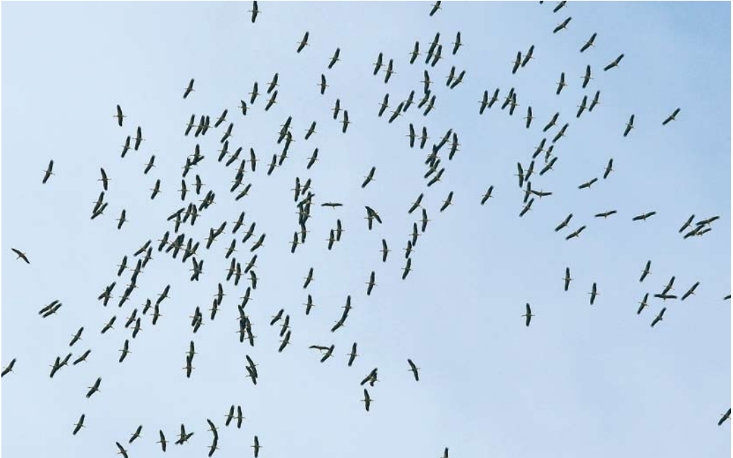
446 Ooievaars / White Storks Ciconia ciconia , Lint, Antwerpen, 16 augustus 2008 (Kris De Rouck)