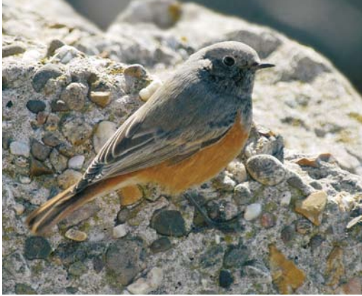
399 Oosterse Zwarte Roodstaart / Eastern Black Redstart Phoenicurus ochruros phoenicuroides , IJmuiden, Noord-Holland, 23 oktober 2003