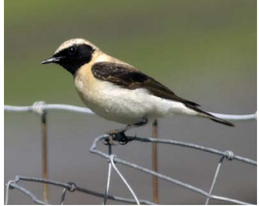
400 Oostelijke Blonde Tapuit / Eastern Black-eared Wheatear Oenanthe melanoleuca , eerste-zomer mannetje, Texel, Noord-Holland, 4 mei 2003 (René Pop)