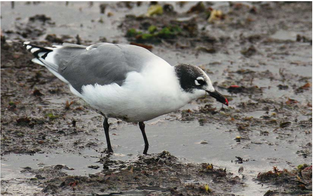
409 Franklin's Gull / Franklins Meeuw Larus pipixcan , Saint-Guénolé, Finistère, France, 31 August 2008