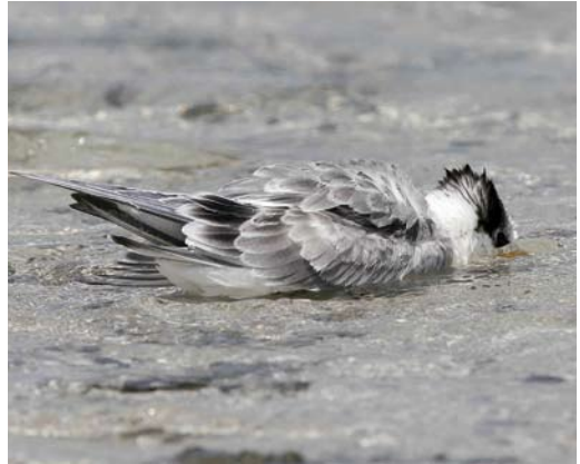
404 Mystery photograph X (October)