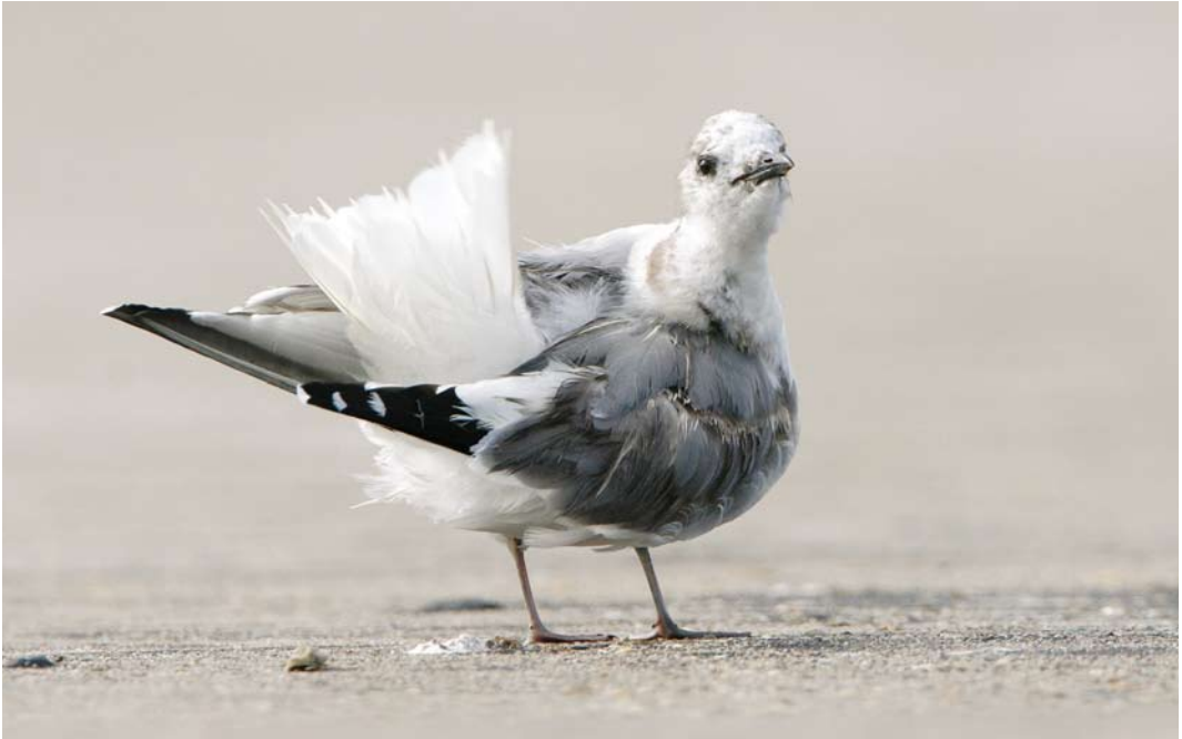
436 Vorkstaartmeeuw / Sabine's Gull Xema sabini , tweede-kalenderjaar, Scheveningen, Zuid-Holland, 23 juli 2008