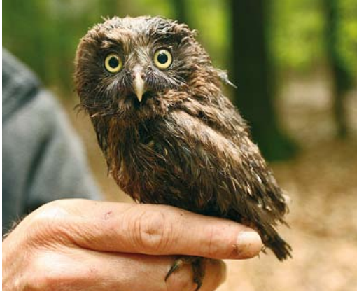
382 Ruigpootuil / Boreal Owl Aegolius funereus , juveniel, Schoonloo, Drenthe, 9 juli 2008. Eén van de jongen van nest 2 tijdens ringen.

een gevolg van areaaluitbreiding en de aanwezigheid van ouder wordende bossen die zich ontwikkelen tot een stabiel en gevarieerd bosecosysteem.