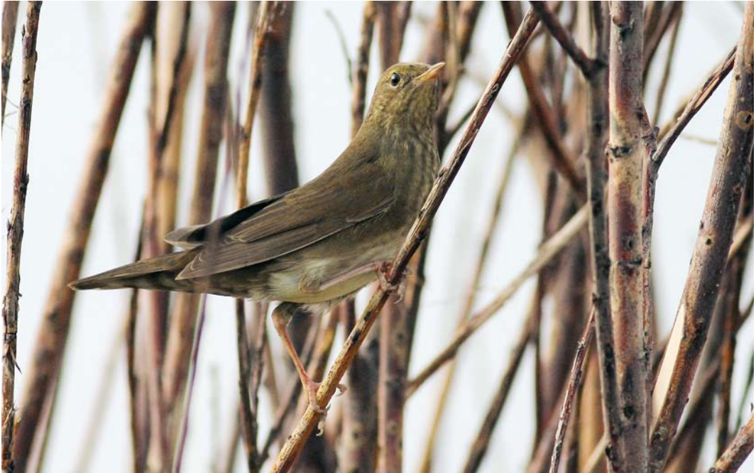
431 River Warbler / Krekelzanger Locustella fluviatilis , Maasvlakte, Zuid-Holland, Netherlands, 13 September 2008

cola were trapped, eg, at Skaw, Whalsay, Shetland, on 17 August; at Indfjorden, Vestjylland, on 21 August; at Trunvel, Finistère, on 30 August; at Kommer, Oost-Vlaanderen, Belgium, on 31 August; on Unst, Shetland, on 9-12 September; on Fair Isle on 13 September; and in the Netherlands at Zandvoort, Noord-Holland, on 10 September and at Castricum on 13 September. A first-year Aquatic Warbler A paludicola trapped in Västergötland on 18 August was the 24th ever for Sweden. In the Netherlands, the species occurred in usual numbers with 20 sightings and at least 19 trapped between 25 July and 30 August alone. An Eastern Olivaceous Warbler A pallidus near Höfn from 15 September, seen together with a Eurasian Wren Jynx torquilla and a Eurasian Reed Warbler A scirpaceus , was the first for Iceland. The idea that individual European warblers not only breed but also winter in the same locality year-upon-year, which was based upon a number of ring recoveries, is confirmed by stable isotope profiles in migratory Great Reed Warblers A arundinaceus recaptured for two or more years in six successive years (J Ornithol 149: 261-265, 2008). Three Barred Warblers Sylvia nisoria were reported from Iceland on 12 September. In Spain, a Lesser Whitethroat S curruca (a rarity in south-western Europe) was trapped at Aiguamolls de l'Empordà on 31 August. A first-year Arctic Warbler Phylloscopus borealis trapped at Blåvands Huk on 11-12 August was (only) the fourth for Denmark.