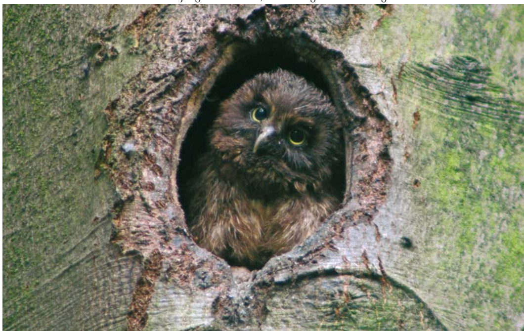
381 Ruigpootuil / Boreal Owl Aegolius funereus , juveniel, Schoonloo, Drenthe, 16 juli 2008 ( Marnix Jonker ). Eén van de jongen van nest 2, enkele dagen voor uitvliegen.