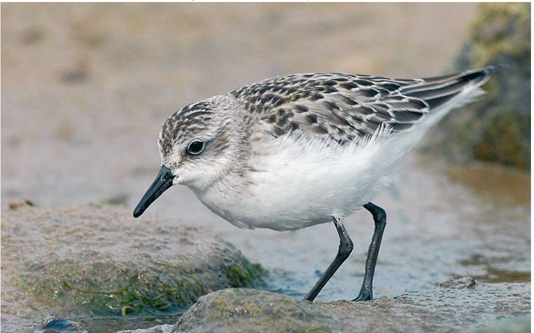
412 Semipalmated Sandpiper / Griize Strandloper Calidris pusilla , juvenile, Playa de la Espasa, Asturias, Spain, 17 September 2008