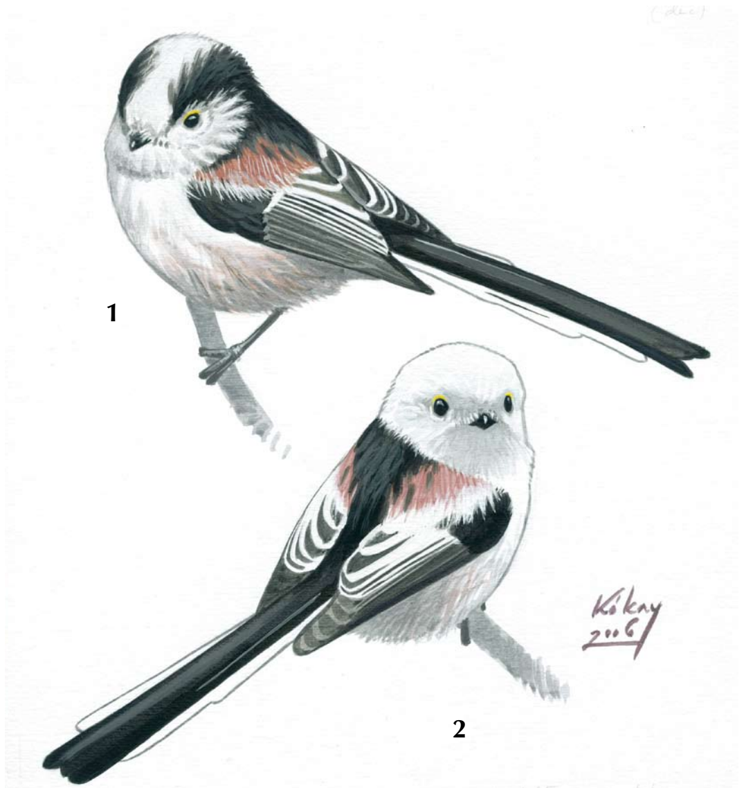
FIGURE 1 Long-tailed Bushtits / Staartmezen Aegithalos caudatus (Szabolcs Kókey). 1 europaeus , 2 caudatus . Both birds closely matching description of type specimens of both subspecies.

FIGURE 2 Central European Long-tailed Bushtits / Staartmezen Aegithalos caudatus europaeus (Szabolcs Kókey). 1 note faint band running from forehead over eye and nape. 2 note scattered darker feathers on head and not sharply defined neck-band. 3 note some dark feathers on nape and clearly visible indication of breast-band. Tertiaries in this bird showing prominent white outer web. 4 typical europaeus but lacking breast-band and showing dark streak on flank. 5 note small darkish spot above eye, otherwise strongly matching caudatus in plumage. 6 bird showing some brownish feathers at edge of neck-band rather than black feathers, rendering neck-band not sharply defined. Tertiaries in this bird showing prominent dark inner web.