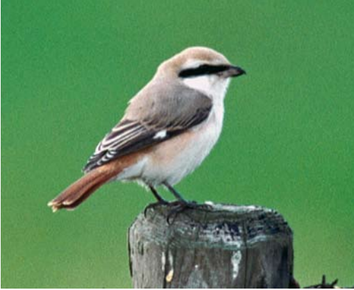
396 Turkestaanse Klauwier / Turkestan Shrike Lanius phoenicuroides , adult mannetje, De Cocksdorp, Texel, Noord-Holland, 2 oktober 2000 (Marten van Dijl)