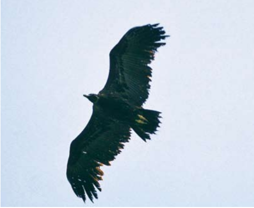
394 Monniksgier / Cinereous Vulture Aegypius monachus , Tzummarum, Friesland, 14 juli 2000 (Arnoud B van den Berg)