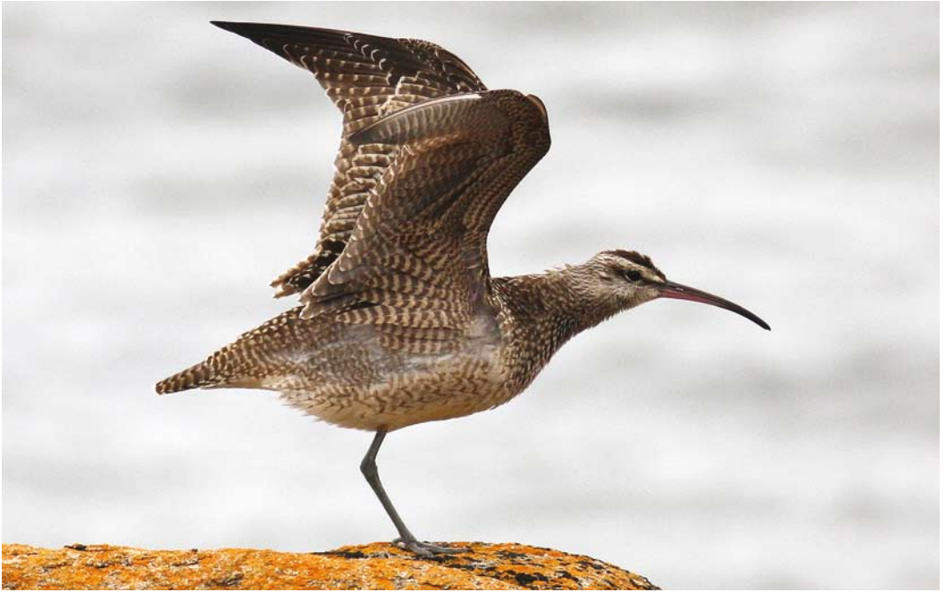
425 Hudsonian Whimbrel / Amerikaanse Regenwulp Numenius hudsonicus , Halangy Point, St Mary's, Scilly, England, 15 September 2008 ( Ashley Fisher ) 426 Audouin's Gull / Audouins Meeuw Larus audouinii , Wolla Bank, Lincolnshire, England, 19 August 2008 ( Steve Young/Birdwatch ) 427 Goliath Heron / Reuzenreiger Ardea goliath , Wadi Lahami, Egypt, 30 July 2008 ( Daniel López Velasco )