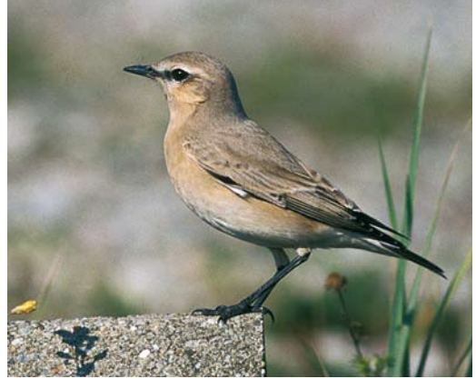
395 Izabeltapuit / Isabelline Wheatear Oenanthe isabellina , IJmuiden, Noord-Holland, 23 september 2000