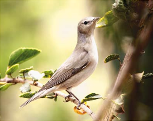
304 Garden Warbler / Tuinfluitier Sylvia borin , Hurghada, Egypt, 10 May 2007 (Edwin Winkel)