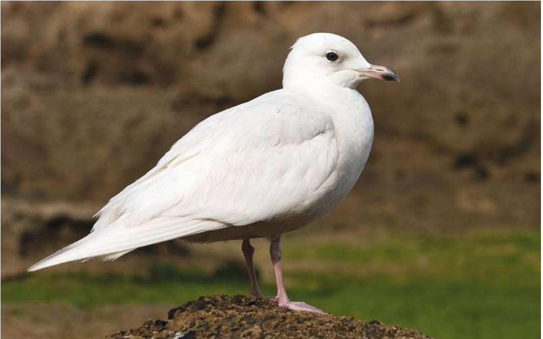
224 Iceland Gull / Kleine Burgemeester Larus glaucoides , Essaouira, Morocco, 2 March 2008