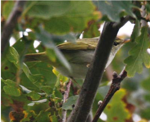
171 Kroonboszanger / Eastern Crowned Warbler Phylloscopus coronatus , Katwijk aan Zee, Zuid-Holland, 5 oktober 2007

opnamen te maken die zeer waarschijnlijk op deze vogel betrekking hadden (tijdens de opname werd de vogel in kwestie niet gezien). De volgende dag werd hij ondanks intensief zoeken niet meer teruggevonden (Zuyderduyn 2007).