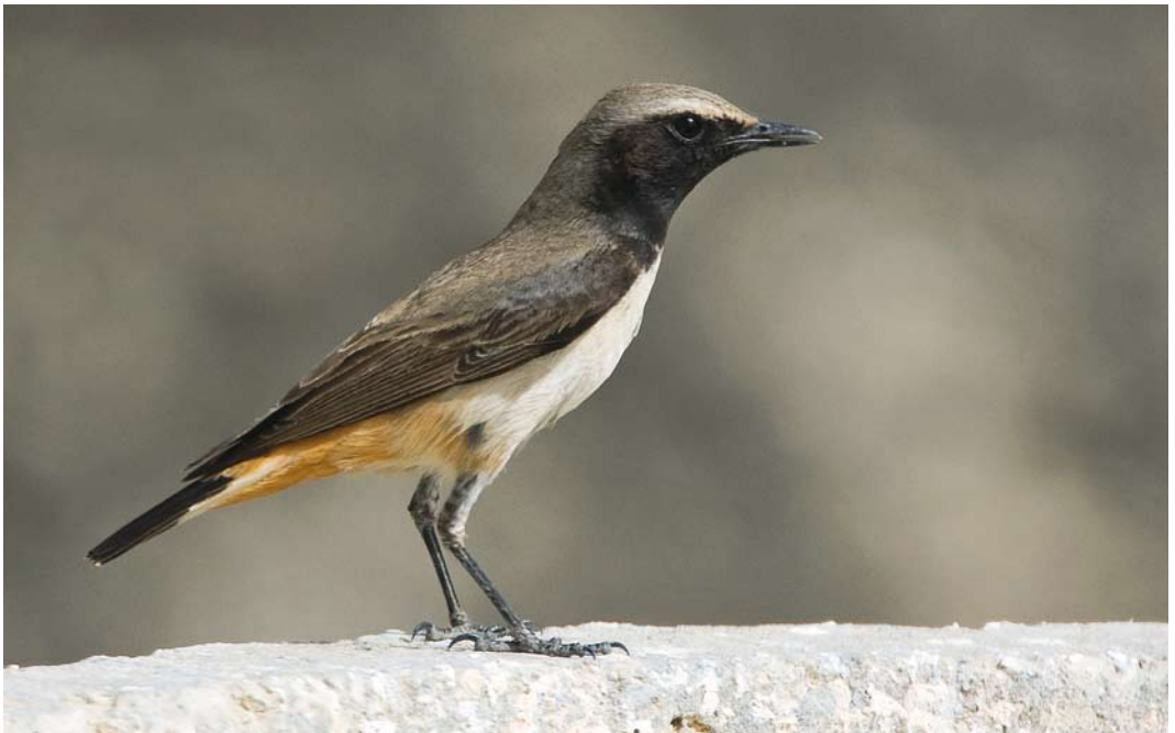
227 Kurdistan Wheatear / Westelijke Roodstaartpauit Oenanthe xanthopyrna , Eilat, Israel, 8 March 2008