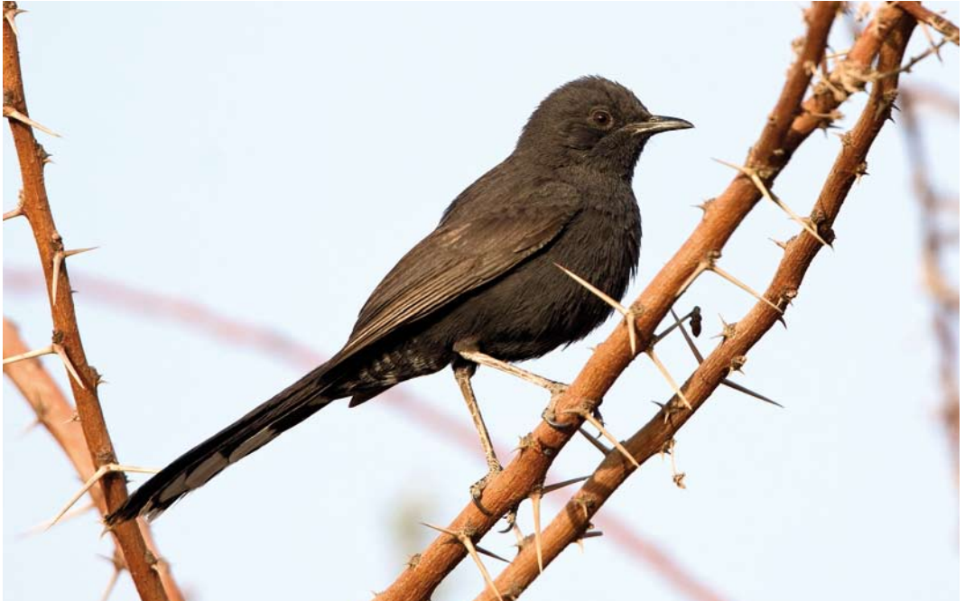
226 Black Scrub Robin / Zwarte Waaierstaart Cercotrichas podobe , Eilat, Israel, 28 March 2008