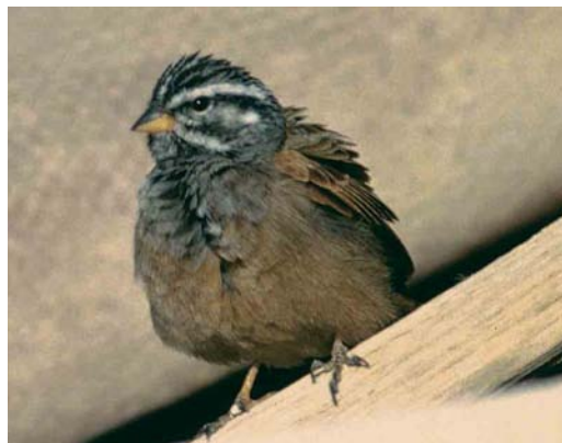
21 House Bunting / Huisgors Emberiza sahari , male, Boumalne Dadès, Dadès-Draa, Morocco, 1 April 2006 ( Arnoud B van den Berg ) 22 House Bunting / Huisgors Emberiza sahari , male, Tamri, Haha, Morocco, 1 October 2006 ( Arnoud B van den Berg ) 23 Striated Bunting / Gestreepte Gors Emberiza striolata , adult male, Eilat, Israel, January 1990 ( Hadoram Shirihai ) 24 Striated Bunting / Gestreepte Gors Emberiza striolata , adult male, Eilat, Israel, January 1990 ( Hadoram Shirihai )

purported 'hybrid' specimens are, in fact, perfectly diagnosable as members of the striolata group. Even if some of these intergrades (unexamined by us) really can be considered such, their localized occurrence and relatively stable characters might be treated as equally strong evidence of secondary contact between two species that have already diverged (cf Wiley 1981).