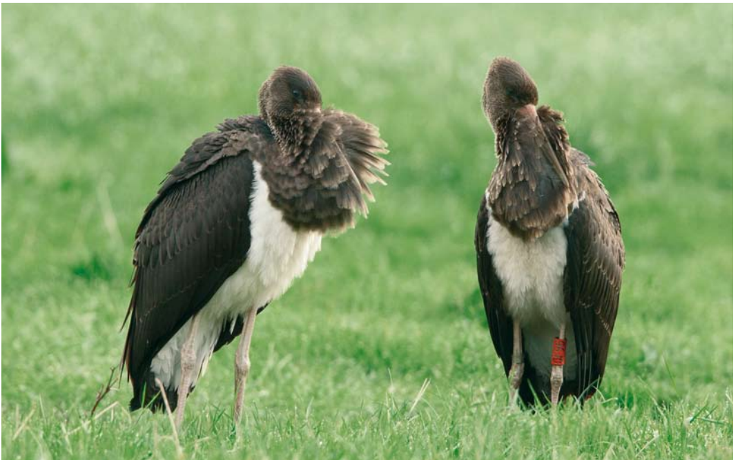
473 Zwarte Ooievaars / Black Storks Ciconia nigra , juveniel, De Uithof, Utrecht, Utrecht, 17 augustus 2007