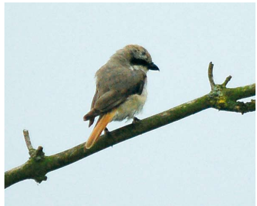
483 Roodstuitzwaluw / Red-rumped Swallow Cecropis daurica , Zwijndrecht, Zuid-Holland, 2 juli 2007 484 Orpheusspottvogel / Melodious Warbler Hippolais polyglotta , Castricum, Noord-Holland, 18 juli 2007 485 Roodkopklauwier / Woodchat Shrike Lanius senator , AW-duinen, Noord-Holland, 11 juli 2007 486 Turkestaanse Klauwier / Turkestan Shrike Lanius phoenicuroides , adult mannetje, Oostvaardersplassen, Flevoland, 26 juli 2007

9 juli maar vooral in de eerste weken van augustus op diverse locaties zoals de Makkumerzuidwaard, Friesland, met een maximum van 16 op 10 augustus, de Workumerwaard met een maximum van 27 op 11 augustus, het Lauwersmeergebied met een maximum van 30 op 18 augustus, en het Ketelmeer/Vossemeer-gebied met een maximum van 16 op 21 augustus. Er werden daarnaast ook nog c 25 doortrekkers gezien. Witwangsterns Chlidonias hybrida werden nog waargenomen op 2 juli (drie) bij Lemmer, op 4 en 5 juli (maximaal drie) op het Leikeven bij Loon op Zand, Noord-Brabant, op 6 juli in de Eemshaven, op 12 juli (vier) en op 17 juli (één) bij Stadskanaal, op 16 juli bij Harlingen, op 21 juli (twee) in de Kropswolderbuitenpolder, op 13 augustus langs Westkapelle en over de Kralingsche Plas bij Rotterdam, en op 18 augustus bij Koarntwerterstân (Kornwerderzand), Friesland, en wederom bij Harlingen. In de eerste helft