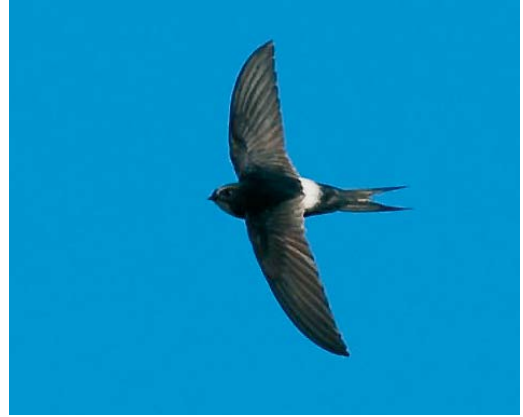
464-465 White-rumped Swift / Kaffergierzwaluw Apus caffer , Algarve, Portugal, 20 May 2007 (Ray P Tipper)