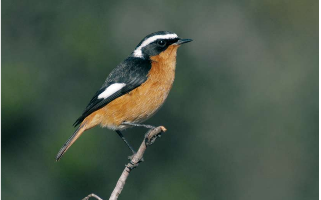
426 Moussier's Redstart / Diadeemroodstaart Phoenicurus moussieri , adult male, Cabo de São Vicente, Algarve, Portugal, 13 December 2006 ( Ray P Tipper )