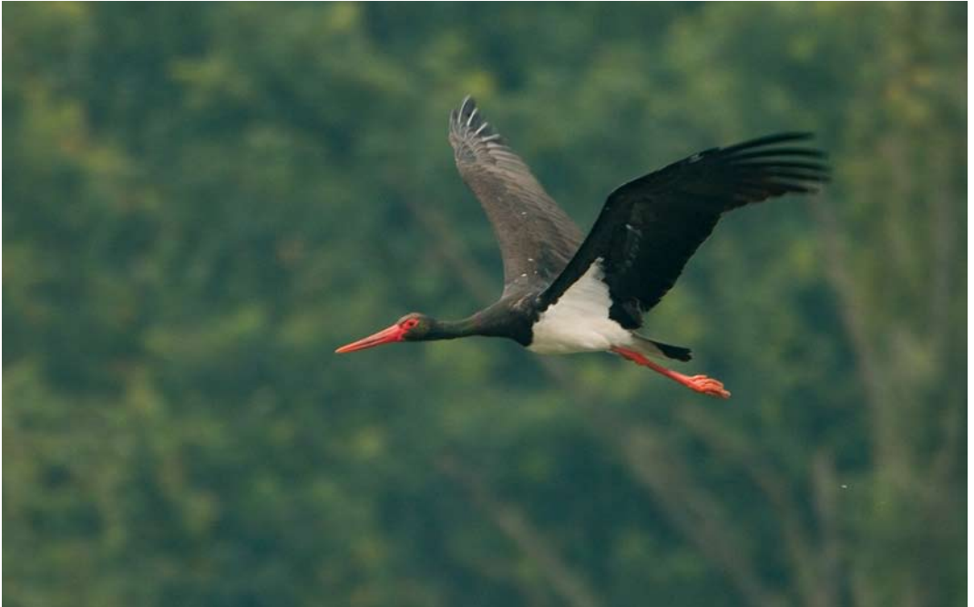
472 Zwarte Ooievaar / Black Stork Ciconia nigra , adult, De Banen, Nederweert, Limburg, 2 augustus 2007 (Jankees Schwiebbe)