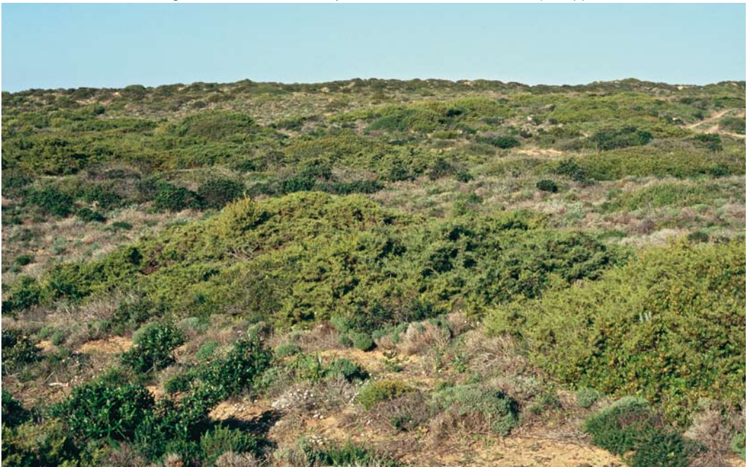
427 View of site occupied by Moussier's Redstart Phoenicurus moussieri at Cabo de São Vicente, Portugal, during November 2006-January 2007, 15 December 2006 ( Ray P Tipper )