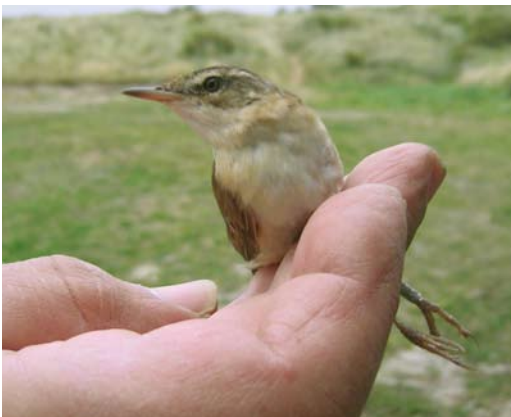
492 Veldrietzanger / Paddyfield Warbler Acrocephalus agricola , adult, Kroons Polders, Vlieland, Friesland, 21 augustus 2007 ( Marinka Schippers )