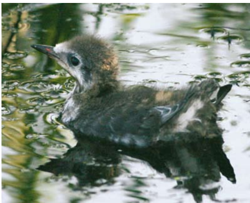
490 Witvleugelstern / White-winged Tern Chlidonias leucopterus , pullus, Stolwijk, Zuid-Holland, 13 juli 2007