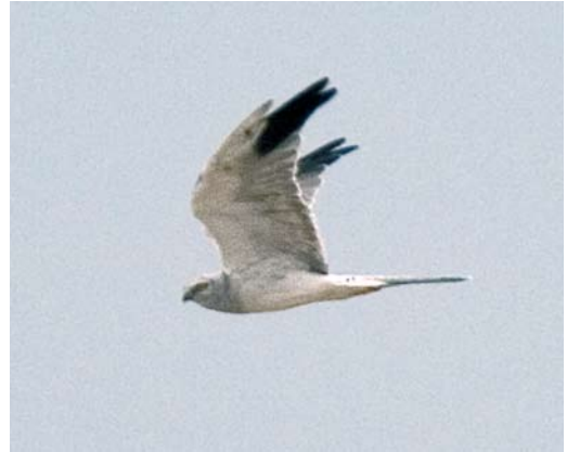
487 Steppiekiekendief / Pallid Harrier Circus macrourus , mannetje, Clermont, Cléron-Castillon, Hainaut, 31 augustus 2007 (Vincent Legrand)

mannetje bij Clermont, Hainaut. De waarneming raakte helaas pas echt bekend op de laatste dag van zijn verblijf. Op 4 augustus trok de eerste Grauwe Kiekendief C. pygargus van het najaar over Relegem-Asse. Tussen 13 en 24 augustus volgden nog 16 waarnemingen op Vlaamse bodem waarvan 10 exemplaren op 23 augustus. Waalse gegevens werden niet vermeld omwille van de broedvogelstatus. Op 14 juli vloog een Schreeuwend Aquila pomarina laag over Zwijndrecht, Oost-Vlaanderen. Wellicht was dit de vogel die reeds op 9 juli als 'kleine arend' werd gemeld bij Hoevenen, Antwerpen. Op 1 juli foerageerde een Visarend Pandion haliaetus boven het meer van Virelles. Vanaf 11 juli kwam de trek echt op gang en er volgden nog c 109 exemplaren. Op 21 augustus trok een onvolwassen mannetje Roodpootvalk Falco vespertinus langs Martouzin, Namur, en op 23 augustus vloog een juveniele langs Knokke, West-Vlaanderen. Pleisterende juveniele verschenen bij Burdinne, Namur, van 18 tot 21 augustus en bij Kalken, Oost-Vlaanderen, vanaf 30 augustus.