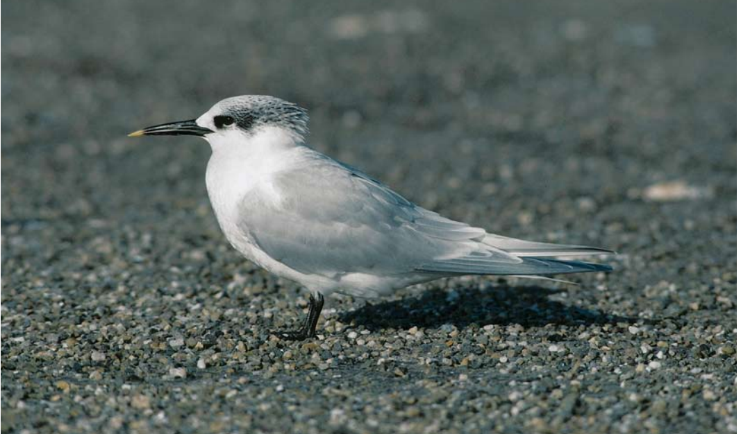
410-411 Sandwich Tern / Grote Stern Sterna sandvicensis sandvicensis , adult-winter, Brouwersdam, Zeeland/Zuid-Holland, Netherlands, 11 February 1989 ( Arie de Knijff ). This individual tests the idea that adult nominate sandvicensis and American Sandwich Tern S. s. acufflavida can be separated in adult plumages. At first glance, white fringes and tips to primaries appear too limited for nominate sandvicensis and, therefore, this bird has in the past been suspected of being vagrant acufflavida . However, with head pattern of 'peppered' black and white rear crown and rather weak-looking decurved bill, overall appearance is more like nominate sandvicensis . Plate 411 offers a more helpful view of outer primaries, showing broader white fringe and tip, which is not as striking as in many nominate sandvicensis but is too marked for most acufflavida . Combined with head pattern and bill shape, identification is resolved.