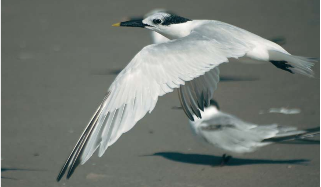
406 American Sandwich Tern / Amerikaanse Grote Stern Sterna sandvicensis acufflava , adult-winter, Florida, USA, 2 November 2005 (Thomas J Dunkerton). One aspect of acufflava plumage is that they have more dark areas in fresh winter plumage than nominate sandvicensis , including variable amounts of dark in secondaries, tail-feathers, primary coverts and tertials. Some dark can be seen here on secondaries and tail, and forehead and crown are very white contrasting sharply with jet-black (not white peppered) rear crown. Longest new grown outer primaries appear to have very little black at tips and along fringe, which is usually much more obvious in nominate sandvicensis .

shorter than those on similar-aged acufflava with obvious white fringing and tips. This produces a more 'white-peppered' or speckled effect over the black feathering on the rear crown and nape.