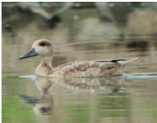
479 Ring-necked Duck / Ringsnaveleend Aythya collaris , first-year female, Budel-Dorplein, Noord-Brabant, 23 October 2005 480 Eastern Imperial Eagle / Keizerarend Aquila heliaca , third calendar-year, Kamperhoek, Flevoland, 3 April 2005 481 Falcated Duck / Bronskopeend Anas falcata , adult male, with Eurasian Wigeon / Smient A penelope , male, Nijkerkernauw, Gelderland, 30 March 2005 482 Marbled Duck / Marmereend Marmaronetta angustirostris , juvenile, Doornenburg, Gelderland, 15 August 2004