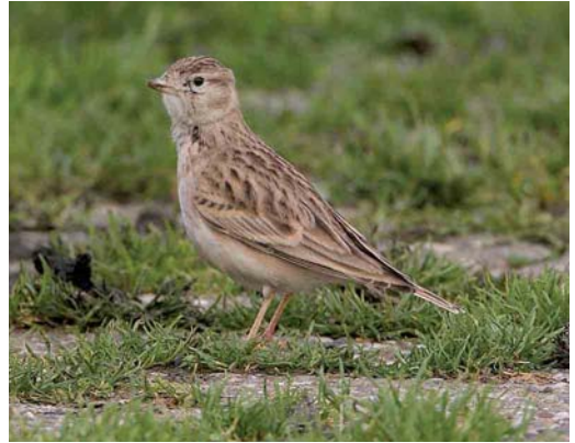
570 Raddes Boszanger / Radde's Warbler Phylloscopus schwarzi , Kennemerduinen, Bloemendaal, Noord-Holland, 13 oktober 2006 571 Veldrietzanger / Paddyfield Warbler Acrocephalus agricola , Meijndel, Zuid-Holland, 14 oktober 2006 572 Siberische Boompieper / Olive-backed Pipit Anthus hodgsoni , Oosterreeweg, Schiermonnikoog, Friesland, 15 oktober 2006 573 Kortteenleeuwerik / Greater Short-toed Lark Calandrella brachydactyla , Oosterend, Terschelling, Friesland, 25 oktober 2006

RALLEN TOT ALKEN Op 8 september werd een eerstejaars Klein Waterhoen Porzana parva gevangen en geringd in het Verdrongen Land van Saeftinghe, Zeeland. Kraanvogels Grus grus trokken door vanaf 12 oktober en vooral op 16 oktober werden grote groepen waargenomen, zoals ten minste 113 over Epen, Limburg, en meer dan 1000 over Maastricht, Limburg. Een Steltkluit Himantopus himantopus werd op 7 oktober gemeld op het Landje van Naber bij Hoorn, Noord-Holland. De Steppevorkstaartplevier Glareola nordmanni van de omgeving van Ransdorp werd weer gezien van 13 tot 18 september. Van 14 tot 20 oktober verbleef een exemplaar bij Eemnes, Utrecht. Ongedetermineerde vorkstaartplevieren vlogen op 17 oktober over natuurontwikkelingsgebied Willeskop, Utrecht, en bij telpost Brobbelbies bij Uden, Noord-Brabant. Er werden tot 13 oktober nog c 70 Morinelplevieren Charadrius morinellus gemeld. Vermeldenswaard zijn twee exemplaren aan