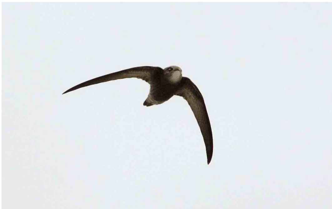
574 Vale Gierzwaluw / Pallid Swift Apus pallidus , Vlieland, Friesland, 20 oktober 2006 (Bas van den Boogaard)