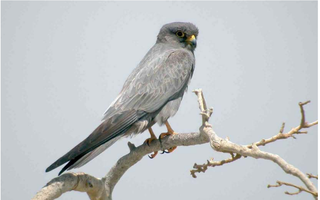
345 Sooty Falcon / Woestijnvalk Falco concolor , Hamata, Egypt, 22 May 2006