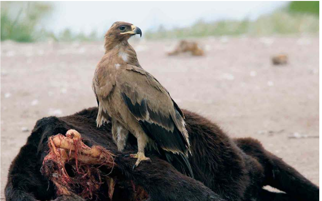
333 Steppe Eagle / Steppearend Aquila nipalensis , Evros delta, Greece, 4 May 2006