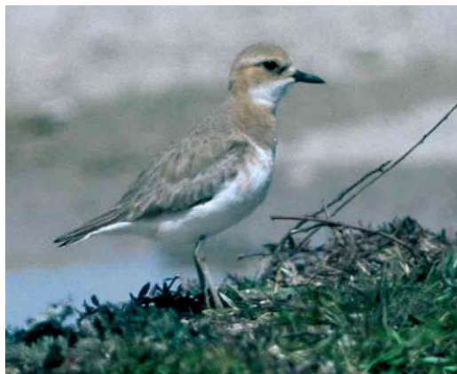
228 Anatolian Sand Plover / Anatolische Woestijnplevier Charadrius leschenaultii columbinus , female, Silifke, Turkey, 21 March 1987 (Arnoud B van den Berg). Note short but pointed bill, lacking bulbous tip of Lesser Sand Plover C mongolus .

approaches Lesser Sand most in this respect, especially the western subspecies of Lesser Sand (Tibetan Sand Plover, ie, the 'atrifrons subspecies group', comprising C m pamirensis , atrifrons and schaeferi ), but never shows a bill-tip as blunt as Lesser Sand. When measured, the nail of the mystery bird covers only c 45% of the total bill length, thereby favouring Lesser Sand. The shape of the nail is rather bulbous and, therefore, fits Lesser Sand better. Even more structural features can be measured from photographs and used for identification. In columbinus , the tarsus length is at most 1.78 times the bill length, while the minimum value for Lesser Sand ( C m schaeferi ) is 1.70. The mystery bird shows a tarsus about two times longer than the bill length, well into the range of Lesser Sand and well beyond the maximum reported for Greater Sand.