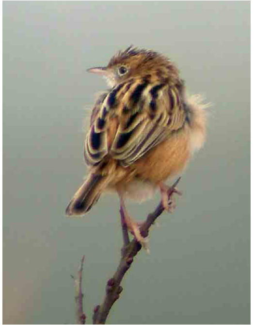
265 Graszanger / Zitting Cisticola Cisticola juncidis , Lentevreugd, Katwijk, Zuid-Holland, 22 maart 2006 266 Graszanger / Zitting Cisticola Cisticola juncidis , Lentevreugd, Katwijk, Zuid-Holland, 16 maart 2006 267 Kleine Zwartkop / Sardinian Warbler Sylvia melanocephala , mannetje, Hargen aan Zee, Noord-Holland, 27 april 2006