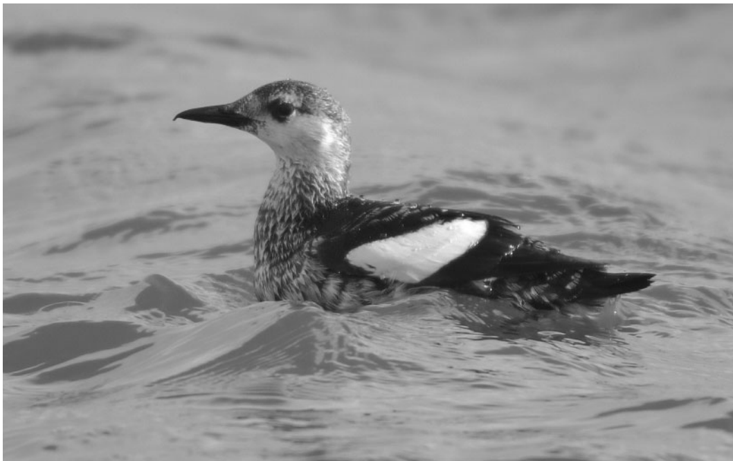
259 Zwarte Zeekoet / Black Guillemot Cephus grylle , adult, NIOZ-haven, Texel, Noord-Holland, 6 maart 2006 (René Pop)