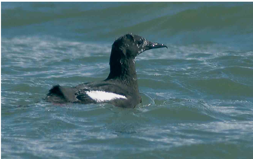
260 Zwarte Zeekoet / Black Guillemot Cephus grylle , adult, NIOZ-haven, Texel, Noord-Holland, 2 april 2006