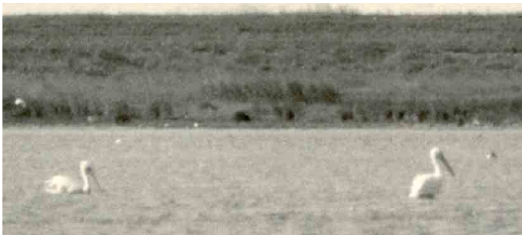
175 Kroeskoppelikaan / Dalmatian Pelican Pelecanus crispus , adult (links) en Roze Pelikaan / Great White Pelican P. onocrotalus , adult, Grevelingen, Zuid-Holland, juni 1975 (Johannes Hameeteman)

Het lijkt aannemelijk dat beide pelikanen in 1975 samen in het Deltagebied zijn gearriveerd maar het is ook denkbaar dat beide apart in Nederland zijn gearriveerd en elkaar vervolgens in het Deltagebied hebben gevonden.