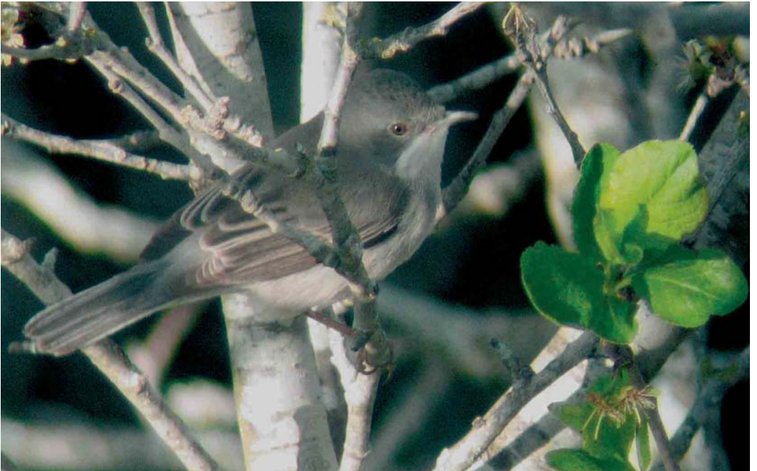
248 Rüppell's Warbler / Rüppells Grasmus Sylvia rueppellii , female, Dwejra, Malta, 26 March 2006 (Raymond Galea)