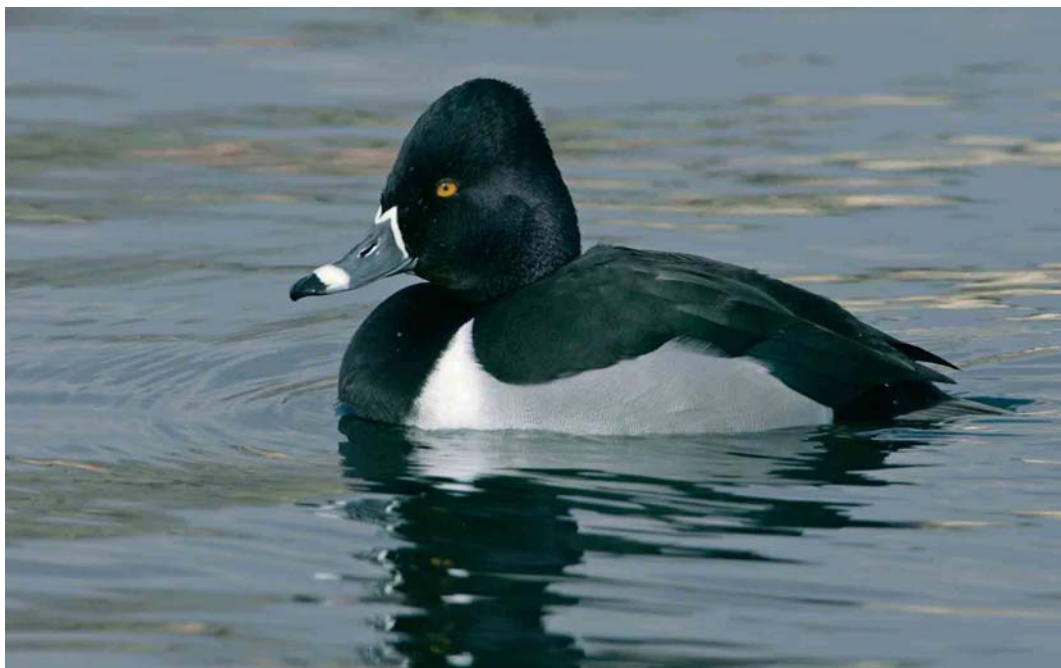
233 Ring-necked Duck / Ringsnaveleend Aythya collaris , adult male, Zürich, Switzerland, 13 March 2006 (Gabriël Schuler)