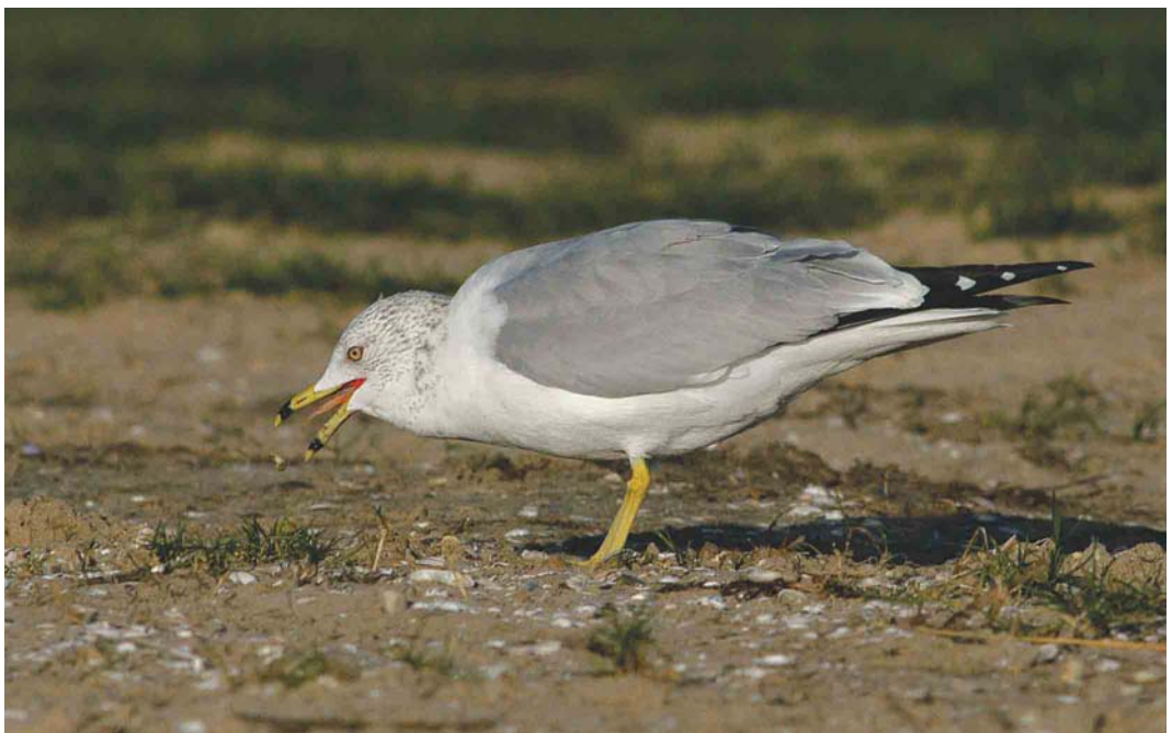
465 Ring-billed Gull / Ringsnavelmeeuw Larus delawarensis , adult, Tiel, Gelderland, 30 January 2004 (Marten van Dijl)