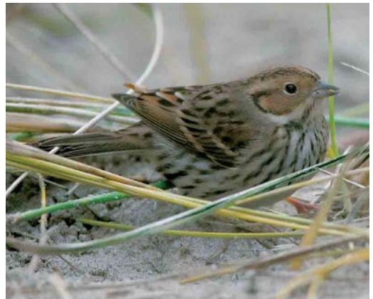
550 Kleine Klapekster / Lesser Grey Shrike Lanius minor , Grote Vlakte, Texel, Noord-Holland, 5 oktober 2005 (Leo J R Boon/Cursorius) 551 Aziatische Roodborsttapuit / Siberian Stonechat Saxicola maurus , eerstejaars, Westduinpark, Den Haag, Zuid-Holland, 26 oktober 2005 (Jeroen van der Zwan) 552 Bosgors / Rustic Bunting Emberiza rustica , Vlieland, Friesland, 16 oktober 2005 (Laurens B Steijn) 553 Dwerggors / Little Bunting Emberiza pusilla , Vlieland, Friesland, oktober 2005 (Bas van den Boogaard)

schaars met begin oktober drie en na 21 oktober 15 meldingen. Van de 39 gemelde Kleinste Jagers Stercorarius longicaudus vlogen er 19 langs tussen 28 september en 2 oktober. In het binnenland was er een waarneming bij Zwolle op 17 september. Op 29 september werden langs Terschelling 91 Grote Jagers S skua geteld en op 23 oktober langs Westkapelle 60 Middelste Jagers S pomarinus . Slechts 30 Vorkstaartmeeuwen Larus sabini werden opgemerkt, waarvan 15 tussen 28 september en 2 oktober. Van 18 september tot 1 oktober liet een juveniel exemplaar zich mooi bekijken op een akker bij Westkapelle. Op 29 september vloog er één langs Lelystad, Flevoland, en op 16 oktober één langs de Ketelbrug. De Ringsnavelmeeuw L delawarensis van Tiel, Gelderland, liet zich daar weer bekijken van 17 september tot 14 oktober. De subadulte Grote Burgemeester L hyperboreus werd de gehele periode gezien bij Katwijk aan Zee, Zuid-