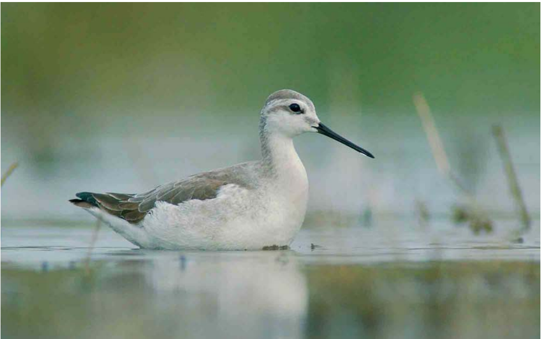
500 Wilson's Phalarope / Grote Franjepoot Phalaropus tricolor , first-winter, Balaton lake, Hungary, October 2005 (János Oláh)