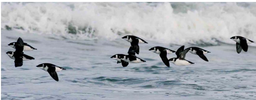
561 Kleine Alken / Little Auks Alle alle , Paal 7, Schiermonnikoog, Friesland, 23 oktober 2005 (Ralph Buij)

Nauwelijks nabij de vloedlijn aangekomen zagen