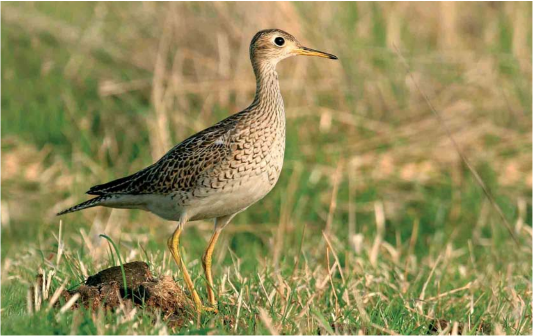
499 Upland Sandpiper / Bartrams Ruyter Bartramia longicauda , Ouessant, Finistère, France, 14 October 2005 (Aurélien Audevard)