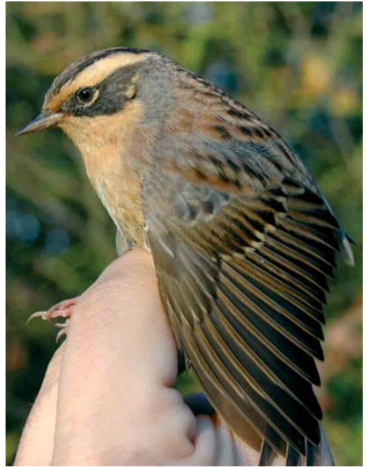
513 Brown Shrike / Bruine Klauwier Lanius cristatus , Utsira, Rogaland, Norway, 3 October 2005 (Christian Tiller) 514 Siberian Accentor / Bergheggenmus Prunella montanella , Schiffflange, Luxemburg, 2 November 2005 (Patric Lorgé) 515 Paddyfield Warbler / Veldrietzanger Acrocephalus agricola , St Mary's, Scilly, England, October 2005 (Mike Malpass) 516 Booted Warbler / Kleine Spotvogel Acrocephalus caligatus , Helgoland, Schleswig-Holstein, Germany, 13 October 2005 (Felix Jachmann)