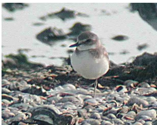
458 Pacific Golden Plover / Aziatische Goudplevier Pluvialis fulva , Grijpskerke, Zeeland, 14 January 2004 ( Leo J R Boon/Cursorius ) 459 American Golden Plover / Amerikaanse Goudplevier Pluvialis dominica (centre), Grijpskerke, Zeeland, 14 January 2004 ( Leo J R Boon/Cursorius ) 460 White-rumped Sandpiper / Bonapartes Strandloper Caldidris fuscicollis , De Hamert, Limburg, 22 May 2004 ( Patrick Palmen ) 461 Lesser Yellowlegs / Kleine Geelpootruiter Tringa flavipes , Eemshaven, Groningen, 10 August 2004 ( Martijn Bot ) 462 Buff-breasted Sandpiper / Blonde Ruiters Tryngites subruficollis , juvenile, De Hemmer, Texel, Noord-Holland, 28 September 2004 ( Ronald A van Dijk ) 463 Greater Sand Plover / Woestijnplevier Charadrius leschenaultii , adult, Battenoord, Zuid-Holland, 16 September 2004 ( Pim A Wolf )