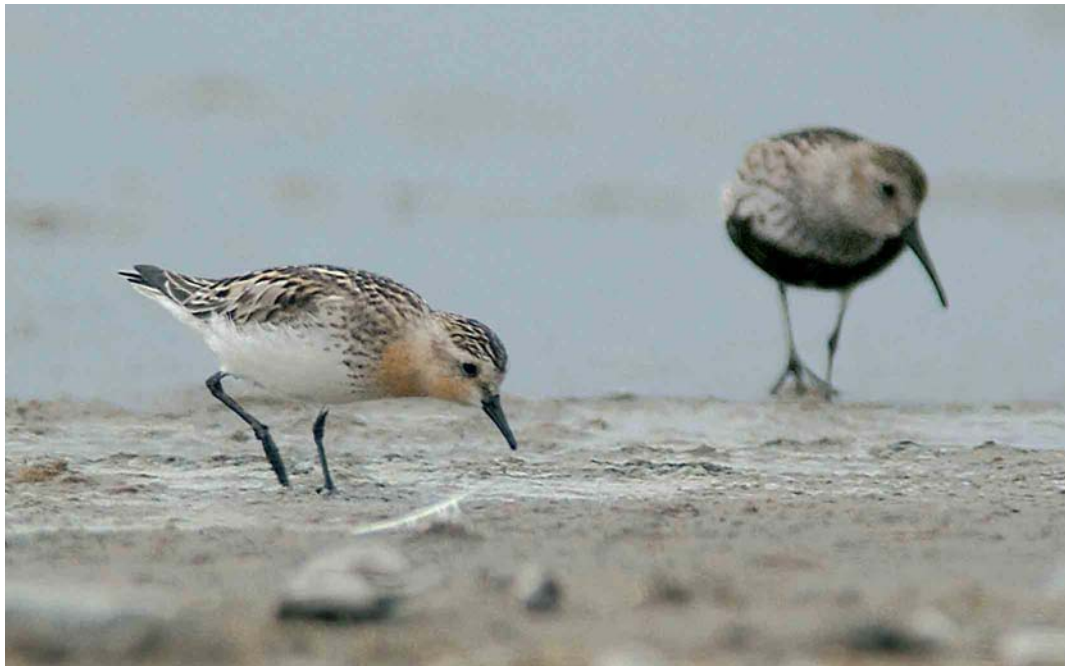
446 Roodkeelstrandloper / Red-necked Stint Calidris ruficollis , adult, met Bonte Strandloper / Dunlin C alpina , adult, Wagejot, Texel, Noord-Holland, 24 juli 2005