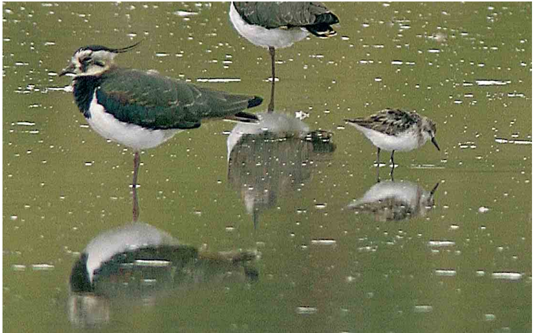
445 Griuze Strandloper / Semipalmated Sandpiper Calidris pusilla , adult, met Kieviten / Northern Lapwings Vanellus vanellus , Wagejot, Texel, Noord-Holland, 21 augustus 2005 (René Pop)