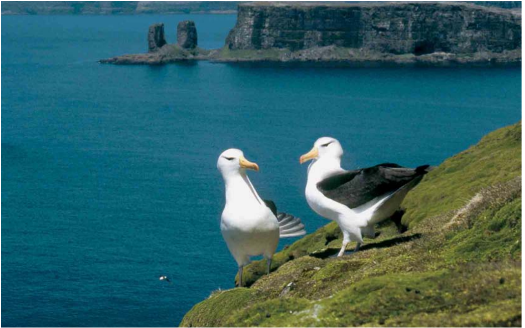
127 Black-browed Albatrosses / Wenkbrauwalbatrossen Thalassarche melanophrys , displaying in front of the 'Arche', Baie de l'Oiseau, Kerguelen Islands, 1997