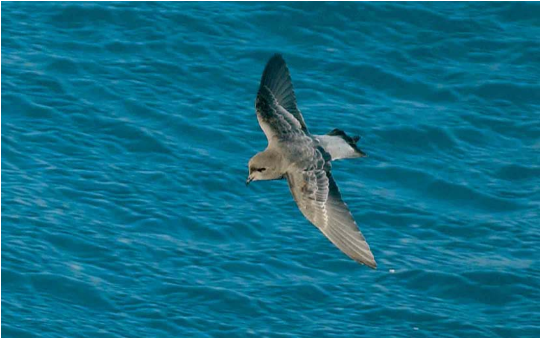
122 Grey-backed Storm-petrel / Grijsrugstormvogeltje Garrodia nereis , off Kerguelen Islands, March 2004