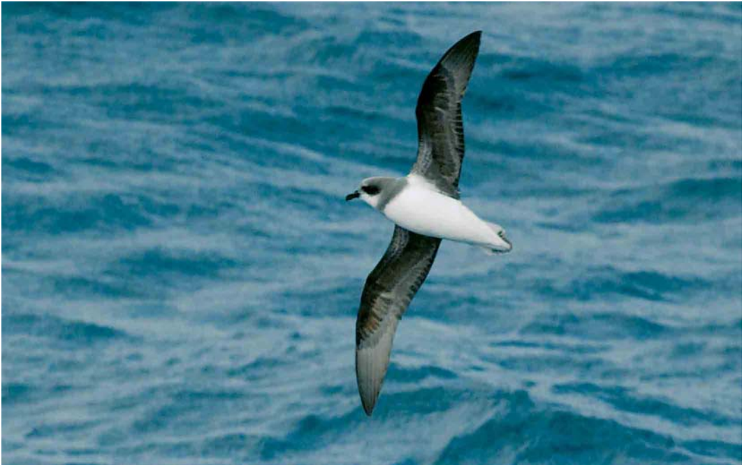
128 Soft-plumaged Petrel / Donsstormvogel Pterodroma mollis , off Kerguelen Islands, March 2004 (Hadoram Shirihai)