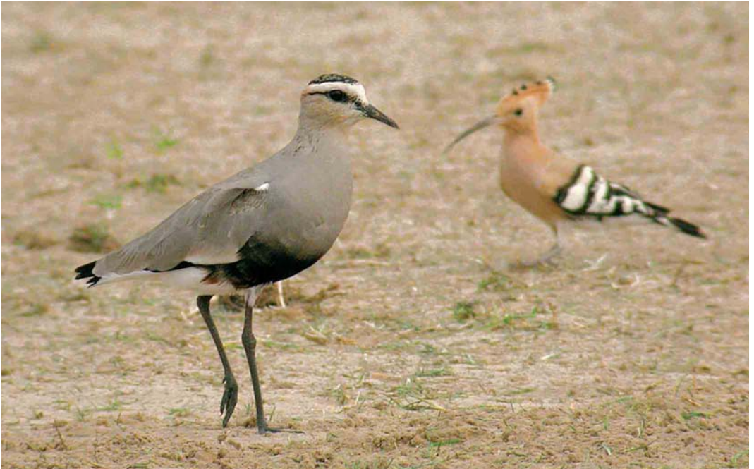
165 Sociable Lapwing / Steppekievit Vanellus gregarius , with Eurasian Hoopoe / Hop Upupa epops , Dubai pivot fields, Dubai, United Arab Emirates, 23 February 2005