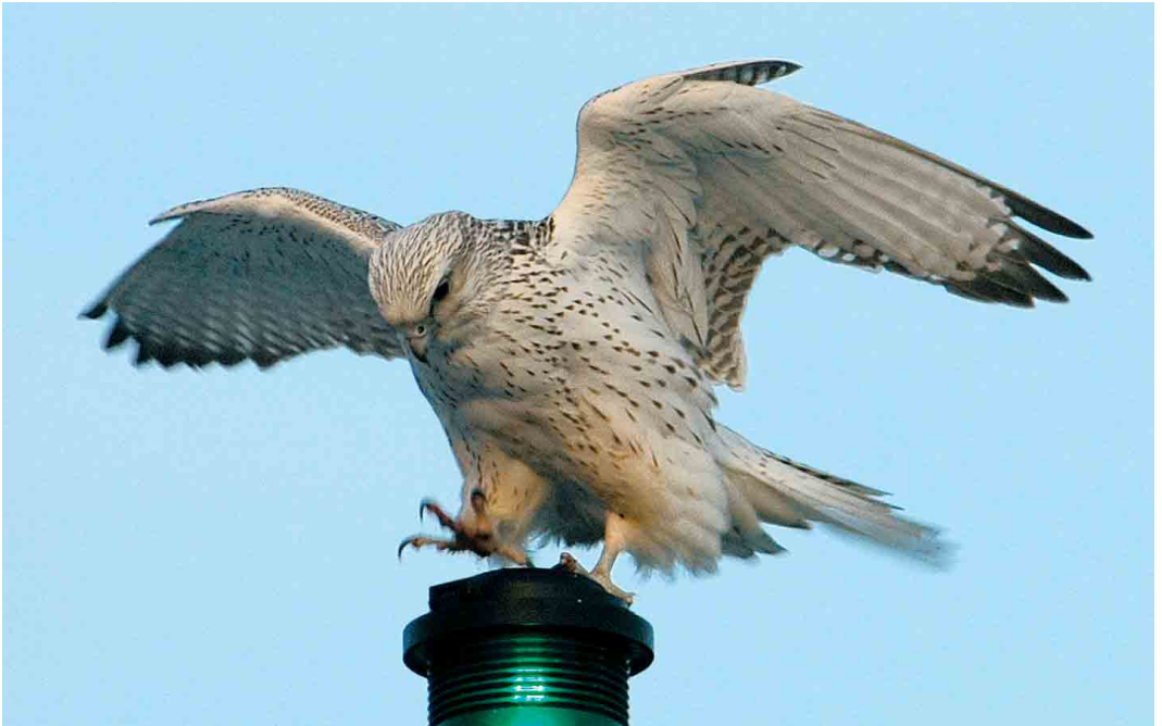
164 Gyr Falcon / Giervalk Falco rusticolus , at sea, west of Ramna Stacks, Shetland, Scotland, 12 February 2005