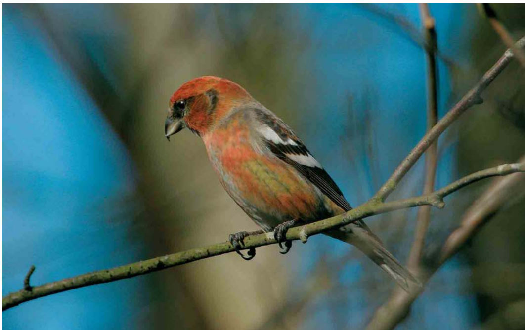
183 Witbandkruisbek / Two-barred Crossbill Loxia leucoptera bifasciata , mannetje, Wateren, Drenthe, 9 februari 2005