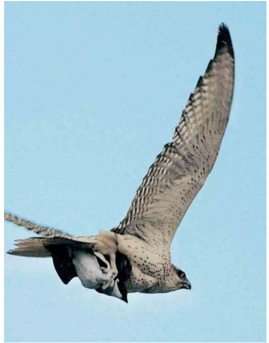
161 Upland Sandpiper / Bartrams Ruiters Bartramia longicauda , La Crau, Bouches-du-Rhône, France, December 2004 cf Dutch Birding 27: 60, 2005 162 Gyr Falcon / Giervalk Falco rusticolus , with Little Auk / Kleine Alk Alle alle , at sea, west of Ramna Stacks, Shetland, Scotland, 12 February 2005 163 Killdeer / Killdeerplevier Charadrius vociferus , Upper Lough Erne, Fermanagh, Northern Ireland, 26 February 2005