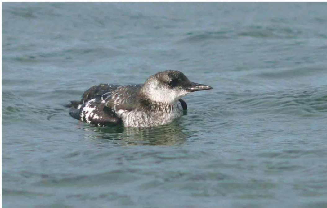
590 Zwarte Zeekoet / Black Guillemot Cephus grylle , eerstejaars, Maasvlakte, Zuid-Holland, 11 september 2004