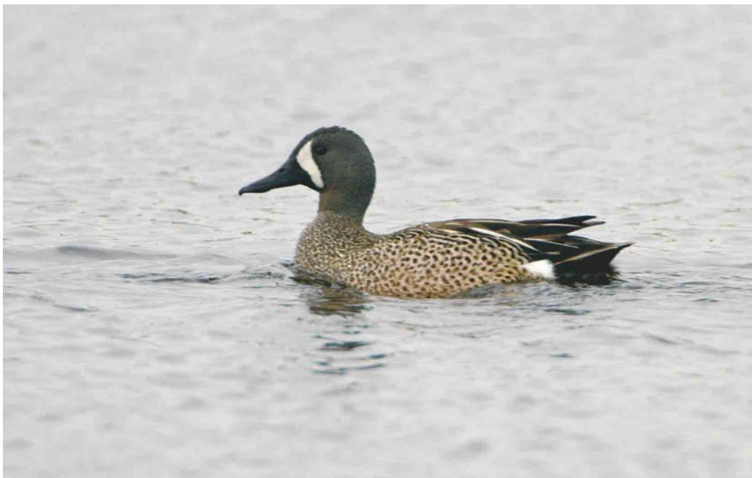
404 Blauwvleugeltaling / Blue-winged Teal Anas discors , mannetje, Groote Vlak, Texel, Noord-Holland, 20 mei 2004