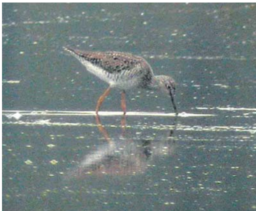
419 Grote Geelpootruiter / Greater Yellowlegs Tringa melanoleuca, Hilversumse Bovenmeent, Noord-Holland, 25 mei 2004