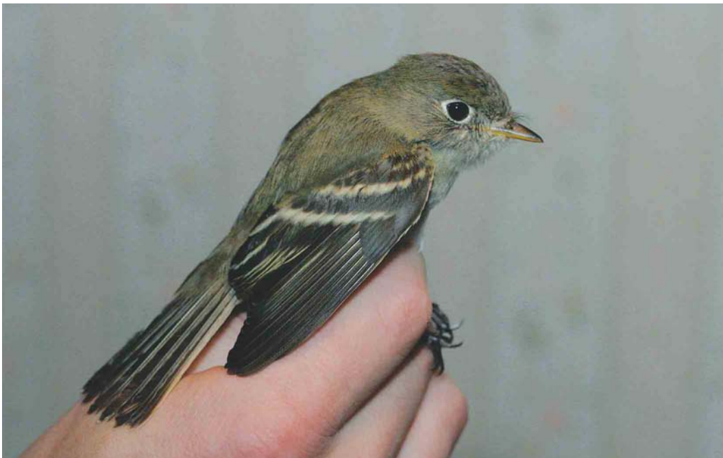
461 Least Flycatcher / Kleine Feetiran Empidonax minimus , Stokkseyri, Iceland, 6 October 2003