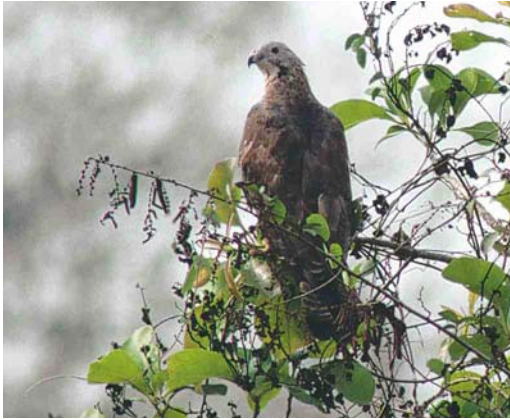
441 Crested Honey Buzzard / Aziatische Wespendifief Pernis ptilorhyncus , adult male, Goa, India, March 2002 (Diederik Kok)

dered by a dark line, can be seen. Sometimes, as in this bird, a central throat-line is present, too. A feature that supports the sexing as a male is the grey head with a dark eye (females show a pale iris). The blue cere supports the ageing as an adult.