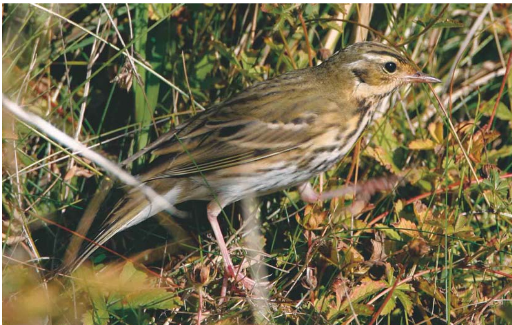
482 Olive-backed Pipit / Siberische Boompieper Anthus hodgsoni , Helgoland, Schleswig-Holstein, Germany, 17 October 2003