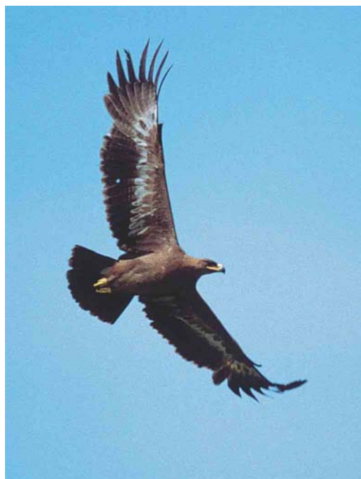
411 Steppe Eagle / Stepparend Aquila nipalensis , immature, Verdeek, Noord-Holland, 31 May 1998 (Jurren Koerts)

This juvenile was only the third to be twitchable after the long-staying individuals in 1978-79 and 1980-81.