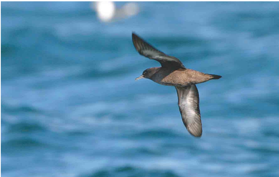
492 Grauwe Pijlstormvogel / Sooty Shearwater Puffinus griseus , Noordzee ten noorden van Ameland, Continentaal Plat, 21 september 2003 ( Bas van den Boogaard )